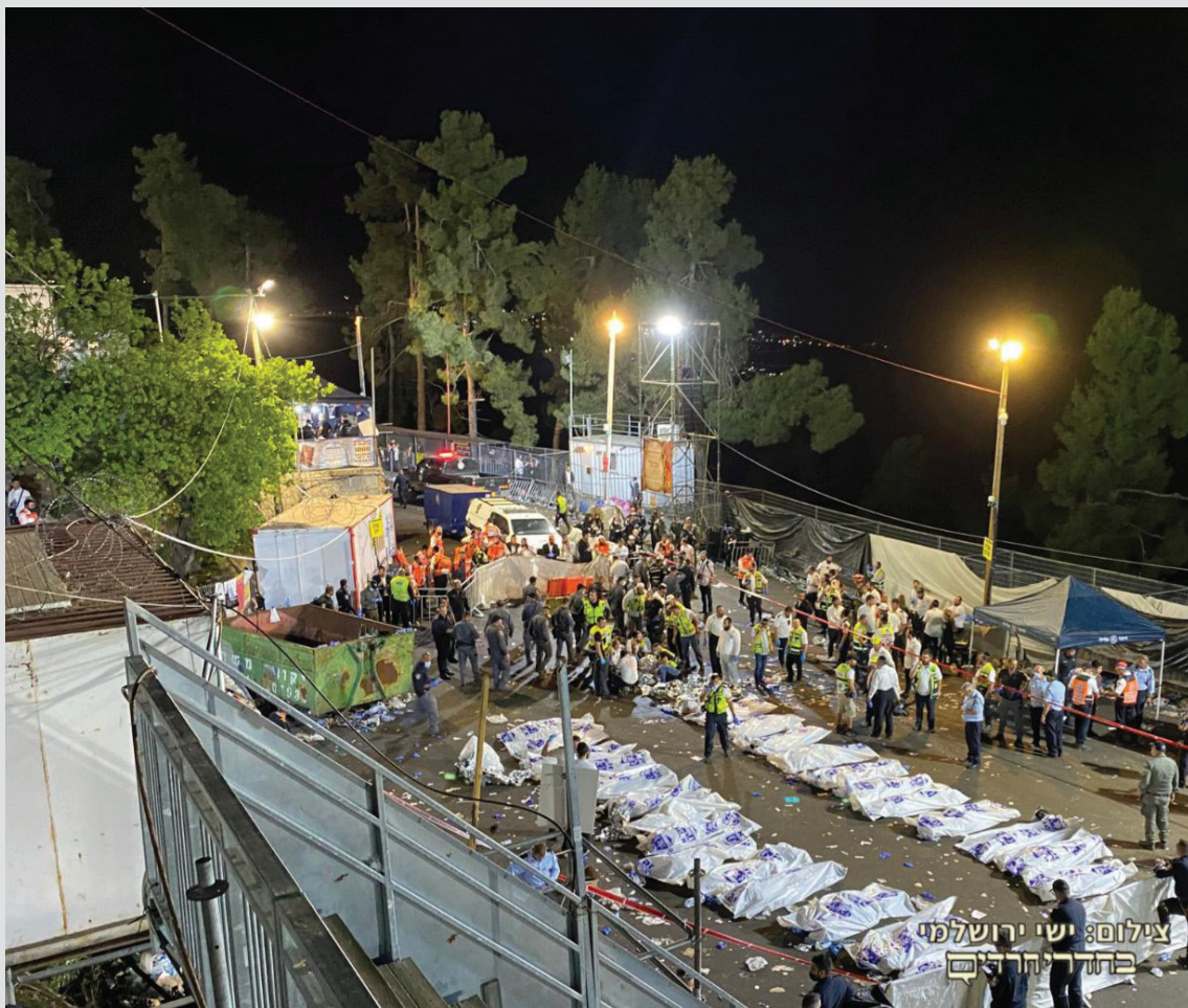
המראות שלא יישכחו. קורבנות האסון במירון

חבל שארבעים וחמישה יהודים יקרים היו צריכים לקפד את חייהם כדי שדברים יתחילו להשתנות. את מירון תשפ"א לא נרצה לזכור, אך לעולם לא נוכל לשכוח