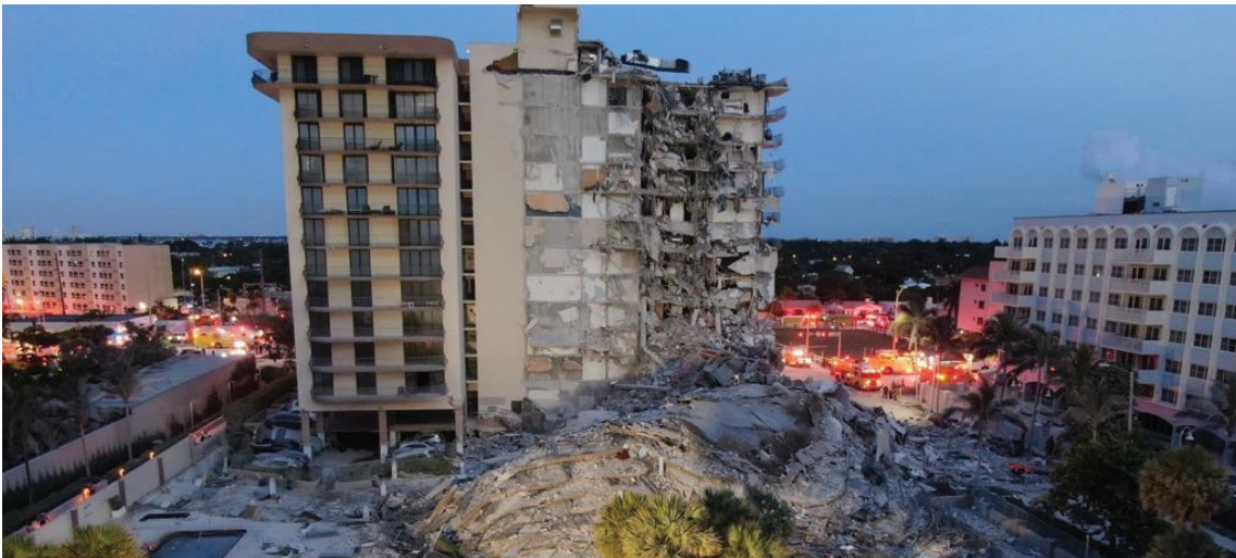
מראה הבניין ההרוס שקרס במיאמי

סיכוייהם של הדיירים ששהו בביתם בזמן קריסת הבניין בשכונת סרפסייד שבפרברי מיאמי, לא היו גבוהים מלכתחילה. בבניין שמרבית דייריו היו יהודים חרדים, נספו 98 בני אדם, באחד האסונות הכבדים שידעה הקהילה החרדית בארה"ב