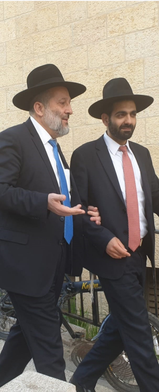
מלכיאלי עם יו"ר ש"ס אריה דרעי

מלכיאלי: "אירוע אחד נדיר שהיה כאן זו הנוכלות האדירה של האיש מרעננה ששיקר ורימה לאורך כל הדרך (גם ברגעים אלו ממש) - שהרי הוא לא יכול (אחרת). זו נוכלות שנכתב וייכתב עליה רבות. ישנם רגעים שחבריי בש"ס ואני מתביישים בחברי כנסת מסוימים והתנהגותם בעת הזו, האיש המציא מחדש את המושג נוכלות ברמה הלאומית, המהלך של לקחת קולות של מצביעי ימין ולהעניק אותם לשמאל הקיצוני של מרץ זה אירוע שלא ייסלח, אני מכיר לא מעט מצביעי ימין שמרגישים מרומים ושגנבו להם את הכל-הקול!" מי איש השנה שלך? "יו"ר ש"ס הרב אריה דרעי - ללא ספק, אריה אמיתי שנלחם השנה בכל החזיתות תוך אומץ וגבורה אמיתיים, מהמתקת גולות הקורונה במגזר החרדי מול הבריוקרטיה הסבוכה ועד הקמתו והחזקתו של גוש הימין בעור שיניו. מנהיג שעשוי מחומר נדיר ואני גאה להיות חלק ממפלגה שהוא קברניטה. מי שעוקב אחר פעילותו של יו"ר התנועה הרב דרעי מבחין שאין אצלו יום ללא עשייה, סיורים בכל עיר וירידה לפרטים הקטנים, תוך ניהול של כל מלחמת האופוזיציה והפלתה של הממשלה." ממי תרצה לבקש סליחה? "אני מביט קדימה אל כל אותם מוחלשים מהציבור הכללי, כמו גם עמלי התורה אשר סומנו כמטרה לאכזריות של הממשלה הרעה הזו, אולי לא עשינו מספיק, אני יודע שבדרך הטבע אצטרך להשיב פני רבים מהם ריקם בשנה הקרובה - אבל אין לנו על מי להישען אלא על אבינו שבשמיים ובעוד כמה ימים מיליוני יהודים מאמינים בכל העולם יעמדו בטלית לבנה בשלל נוסחים כאשר בפיהם בקשה אחת - 'כי תעביר ממשלת זדון מן הארץ'. שנה טובה ומבורכת."