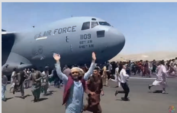
אפגנים מנסים לחסום מטוס של חיל האוויר האמריקני

ועוד לקח חשוב: אמריקה הושפלה ב-2001 באסון התאומים שהוביל לכניסתה לאפגניסטן. אמריקה הושפלה שוב גם ביציאתה מאפגניסטן.