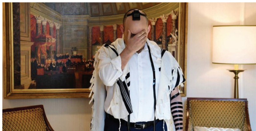
בנט בווינגטון

אולי, ורק אולי, יכול היה לצלוח עוד ארבע שנים בראשות הממשלה.