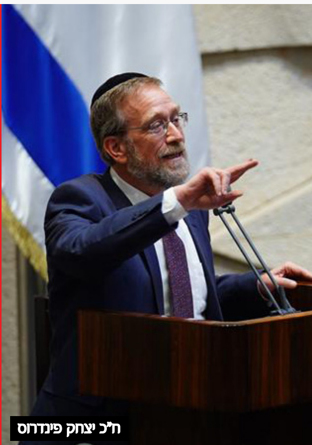
ח"כ יצחק פינדרוס