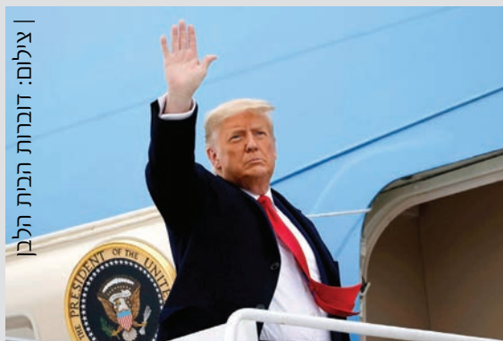
מנופף לשלום. דונלד טראמפ עוזב את הבית הלבן

דונלד טראמפ הפתיע את המפלגה הרפובליקנית כשניצח את יריביו במפלגה והפך למועמדה בבחירות לנשיאות 2016. הוא הדהים את מנהיגי העולם כשניצח את הילארי קלינטון. נתניהו היה מהיחידים שבמנהיגי המערב ששמחו על בחירתו. בתשפ"א ירד טראמפ מעל במת ההיסטוריה אחרי קדנציה אחת רוויית שערוריות