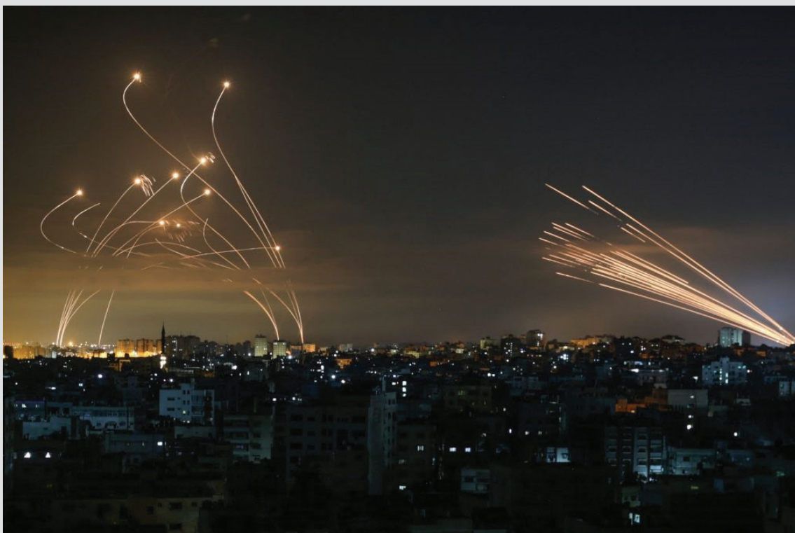
מטח טילים מעזה על ישראל אל מול טילי כיפת ברזל במהלך מבצע 'שומר חומות'

אין דרך להכניע את ארגון הטרור חמאס, כשם שאין מוצא לסכסוך הישראלי פלסטיני. העימותים הצבאיים ליוו את נתניהו ב-12 שנות שלטונו, כפי שליוו את קודמיו וכפי שילוו את כהונתו של נפתלי בנט