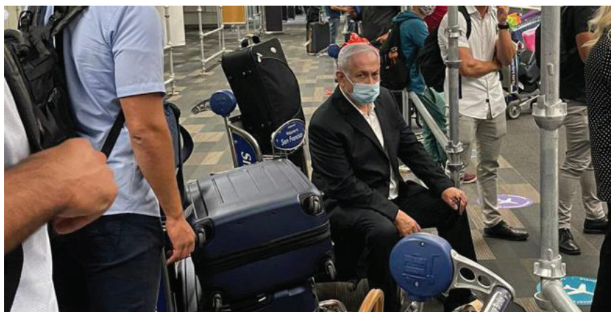
נתניהו ובני משפחתו בשדה התעופה בסן פרנסיסקו

את תשפ"א נתניהו מסיים בחופשה פרטית עם משפחתו בארה"ב, בעוד יריבו המר נפתלי בנט מתקבל בכבוד ע"י נשיא ארה"ב כראש ממשלת ישראל. זו תמצית הסיפור הפוליטי בישראל בשנה האחרונה