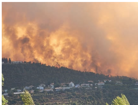
טרור לכל דבר. שריפת הענק באזור ירושלים

אם הממשלה המכהנת לא רוצה להתחיל את תשפ"ב, עם גל הצתות נוסף, עליה להפיק את לקחיה של תשפ"א: טרור, כל טרור, גודעים מיד בתחילתו.