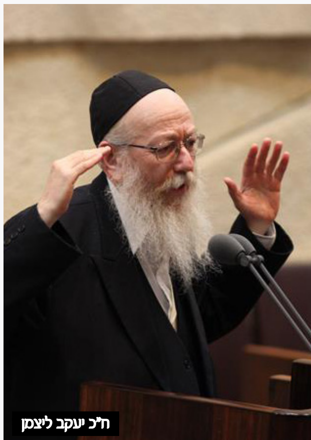
ח"כ יעקב ליצמן