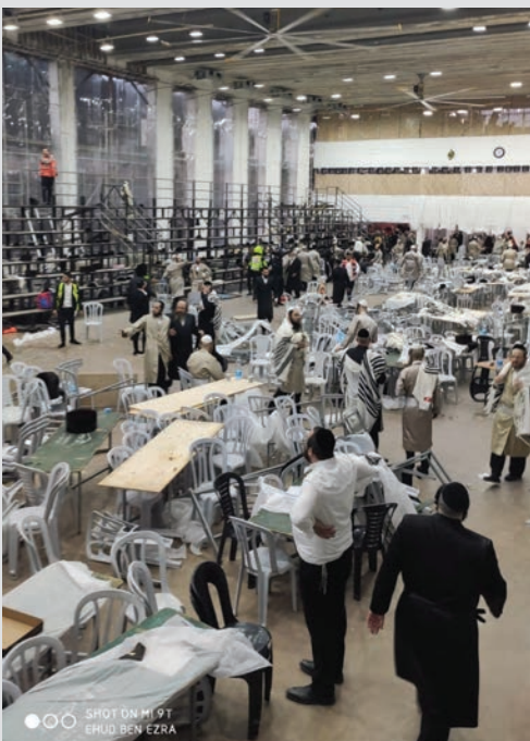
שמחת החג הושבתה. זירת האסון בקרלין

אחרי ששמחת הילולת רשב"י בל"ג בעומר הושבתה בעקבות האסון הכבד בו נספו 45 בני אדם במירון, הושבתה גם שמחת חג השבועות כאשר עם כניסת החג הגיעו הדיווחים הראשונים על האסון בחסידות קרלין, כאשר הפארנצ'עס בחנוכת הבית של ביהמ"ד החדש של החסידות קרס