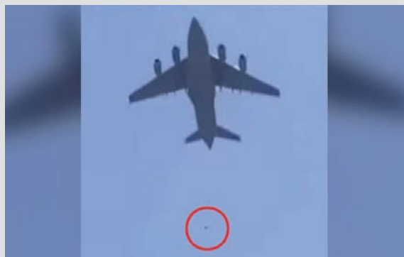
תיעוד ממכיר לב: אפגנים נתלים על מטוס של צבא ארה"ב כדי להימלט מהמדינה

אמריקה הושפלה ב-2001 לאחר אסון התאומים שהוביל לכניסתה לאפגניסטן. אמריקה הושפלה שוב גם ביציאתה מאפגניסטן, עשרים שנה לאחר מכן. האם האמריקאים למדו את הלקח?