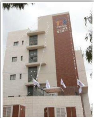
בטקס גזירת הסרט