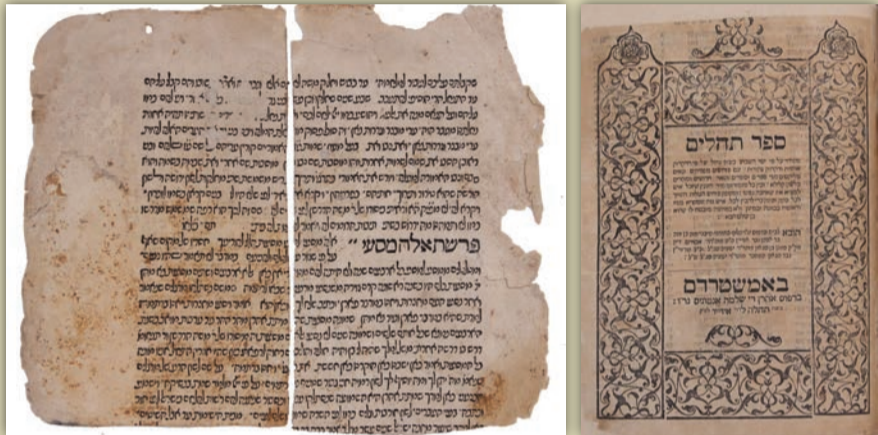
שער התהילים בסידור שער השמים לשל"ה הק' תגלית היסטורית פירוש רש"י על התורה משנת רמ"ד - 1484

מורשת מכירות פומביות מציגה: המהדורה הראשונה של סידור "שער השמים" לשל"ה, ס"ת מינאטורי שנכתב בשנת תר"א, מכתבים בכת"י של מרנו הגר"ח מבריסק, בעל הבן איש חי, המקובל רבי יהודה פתיה, מרן בעל הקהילות יעקב, ועוד מאות פרטי יודאיקה נדירים