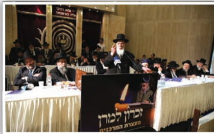
שולחן הכבוד וחלק מהקהל בעצרת

ישראל. לא בנים, לא נכדים, כלל ישראל ואפילו את צרכיו האישיים היה מקריב לטובת הכלל, לפעמים הוא שוכח לישון, לפעמים הוא שוכח לאכול, לפעמים עוברים עליו 48 שעות בלי שינה, הוא לא מרגיש, זו דרכו של אברהם אבינו, תמיד הייתה דרכו לקדושה.