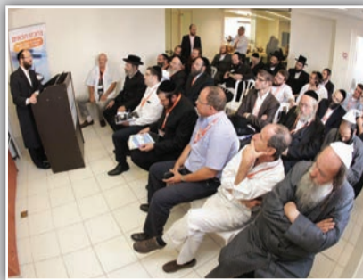
ראשי ארגוני הרפואה בכינוס במשגב לדרך