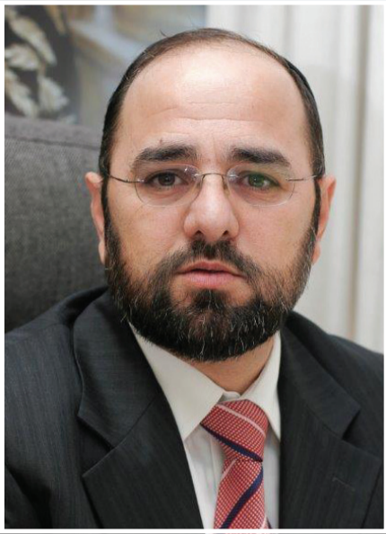
ח"כ יעקב מרגי

ע"פ החוק, רשות מקומית המשתתפת בתקציבי מוסדות חינוך רשמיים הפועלים בתחומה, תהיה מחויבת להשתתף בתקציביהם של מוסדות חינוך מוכרים לא רשמיים הפועלים בתחומה