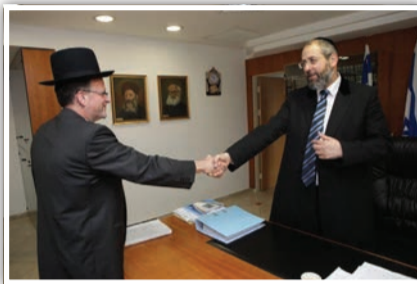
הרב שזירי עם הרה"ר הגר"ד לאו

על רקע ציון עשור לפעילות החברה המרכזית למימוש זכויות, התקיימה פגישה בין הרב הראשי לישראל, הגאון הרב דוד לאו לבין הרב שמאי שזירי, יו"ר החברה המרכזית למימוש זכויות