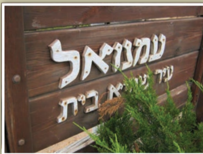
מאת: מנדי כץ

תוכנית תב"ע 120/9 שאושרה בעמנואל תביא רווחה לכלל התושבים בעיר שיתאפשר להם לבנות 60 מ"ר נוספים בדירותיהם • ראש מועצת עמנואל: "התב"ע שאושרה תאפשר לכל התושבים, להרחיב את דירותיהם"