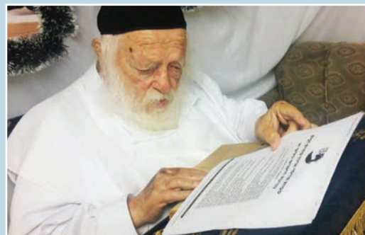
מרן הגר"ח קניבסקי מתפלל על התורמים

מרן הגר"ח קניבסקי שליט"א העתיר בתפילה עבור תורמי ארגון טהרת הבית ביום הושענא רבה