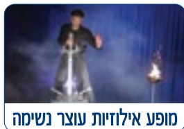
מופע אילוזיות עוצר נשימה