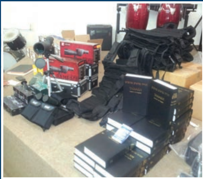
ספרי התנ"ך אליהם הוצמד הדף המיסיונרי

עשרות רכזי הביטחון של המועצה האזורית הכל אשכול שהוזמנו לטקס חלוקת ציוד בטחוני הופתעו לגלות כי גוף מיסיונרי עומד מאחוריו בניסיון לשדלם להמרת דתם • חלקם נטשו בזעם ופנו ליד לאחים • בא כוח יד לאחים שיגר מכתב דחוף לשרת המשפטים וליועץ המשפטי בבקשה למיצוי הדין עם מפרי החוק המיסיונרים