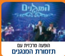
הופעה מרכזית עם תזמורת המנגנים