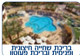
בריכת שחייה חיצונית ופנימית ובריכת פעוטון