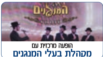
הופעה מרכזית עם מקהלת בעלי המנגנים