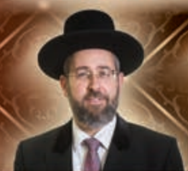
הגאון רבי דוד לאו שליט"א הרב הראשי לישראל

תתקיים אי"ה ביום ראשון כ"ט טבת (ליל ר"ח שבט) תשע"ו (10/1/16) באולמי ויולה החדשים והמפוארים (גאלרי לשעבר), רח' היהלומים 1, צומת וולפסון, תל אביב פתיחת שערים: בשעה 19:00 | טקס הדלקת נרות הצדיקים בגן האולם: בשעה 19:30 בדיוק