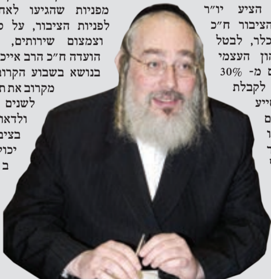
מאת: אלי מזרחי

מפניות שהגיעו לאחרונה לועדה לפנינות הציבור, על סגירת סניפים וצמצום שירותים, החליט יו"ר הועדה ח"כ הרב אייכלר לקיים דיון בנושא בשבוע הקרוב, כדי לבחון מקרוב את תכניות הבנקים לשנים הבאות ולדאוג שלא יפגעו בציבורים שאינם יכולים להיעזר בשירותים האוטומטיים.