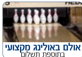
אולם באולינג מקצועי בתוספת תשלום