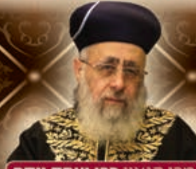
מרן הגאון רבי יצחק יוסף שליט"א הראשון לציון וראש אבות בתי הדין