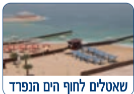
שטלים לחוף הים הנפרד