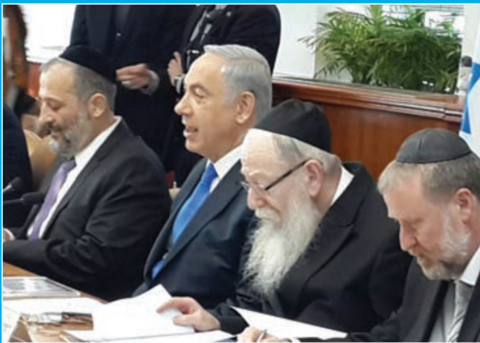
העדפה מתקנת בממשלה. דרעי, נתניהו וליצמן בישיבת הממשלה, השבוע

כעשרים שנה אחרי שהרב אברהם רביץ ז"ל קידם הצעת חוק העדפה מתקנת לחרדים, אישרה הממשלה את יוזמת יו"ר ש"ס דרעי והחליטה על שורת צעדים מעשיים לשילוב חרדים במשרדי הממשלה ובשירות הציבורי • היעדים המידיים: שילוב מאה וחמישים עובדים חרדים חדשים מדי שנה בשירות המדינה • הפלטפורמה להצעת ההחלטה: הצעת החוק שהגיש ח"כ משה גפני בקדנציה שעברה, אשר הוכללה בהסכמים הקואליציוניים של ש"ס ויהדות התורה • רה"מ נתניהו: "מתחייב לאפשר לחרדים להשתלב גם בסקטור הציבורי וגם בסקטור הפרטי" • יו"ר ש"ס דרעי: "זהו ההישג הגדול של הקדנציה" / בי"ס לפוליטיקה