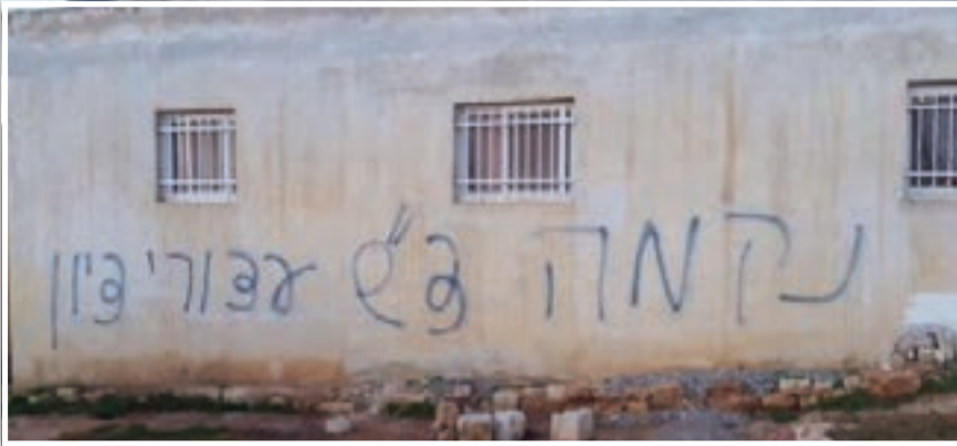
הבית שנפגע בכפר ביתילו.

על רקע חקירת עצורי דומא, התרחש ביום שני בלילה אירוע דומה שבדרך נס נגמר ללא נפגעים • רימוני עשן הושלכו לעבר בית בכפר ביתילו בסמוך לרמאללה. על קיר הבית רוססה הכתובת: "נקמה"