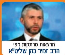
הרצאות מרתקות מפי הרב זמיר כהן שליט"א