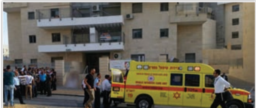
זירת פיגוע הדקירה בבית שמש

נשק קרים ובאמצעות כלי רכב, במטרה לרוצחם". בהשראת אירועים אלה, החליטו המחבל וחברו, לבצע פיגוע רצחני נגד יהודים. ב-22 באוקטובר, בשעת בוקר מוקדמת, הגיעו הנאשם וחברו לרמת בית שמש, כשכל אחד מהם נושא שתי סכינים בבגדיו. השניים המתינו בתחנת אוטובוס ברחוב יחזקאל ברמת בית שמש. לאחר דקות ספורות, הגיע לתחנה רכב הסעת ילדים והם החלו לעלות עליו. הנהג אמר להם "רדו למטה! זה לא קו שירות!". בתגובה, השניים ירדו מרכב ההסעה. בהמשך, עצר בתחנה אוטובוס אגד קו 419. הנאשם ומחמוד שאלו את הנהג אם הוא מגיע לבית שמש. אישה שהייתה במקום קראה לעבר הנהג כי השניים "חשודים" וכי היא הזמינה משטרה. הנהג סגר את דלת