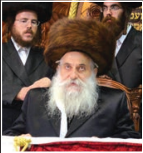
כ"ק האדמו"ר מבוטושאן שליט"א