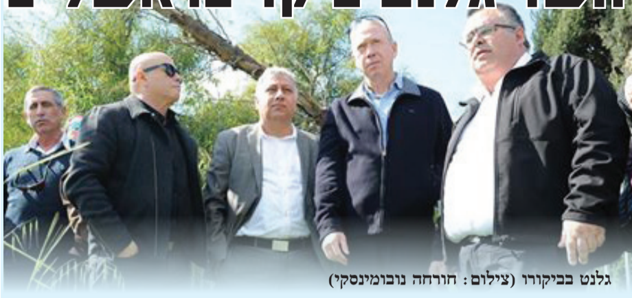
גלנט בביקורו