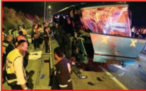
כוחות הצלה בפניו הפצועים

לקבל את אחד הנפגעים ולהבין שבעצם אין כבר מה לעשות, להמשיך משם ולטפל בפצוע שבמצב קשה מאוד והיה בין חיים למוות בידיים שלך, ובהמשך לקבל את הידיעה שהוא לא שרד בסופו של דבר את הפגיעה האנושה.