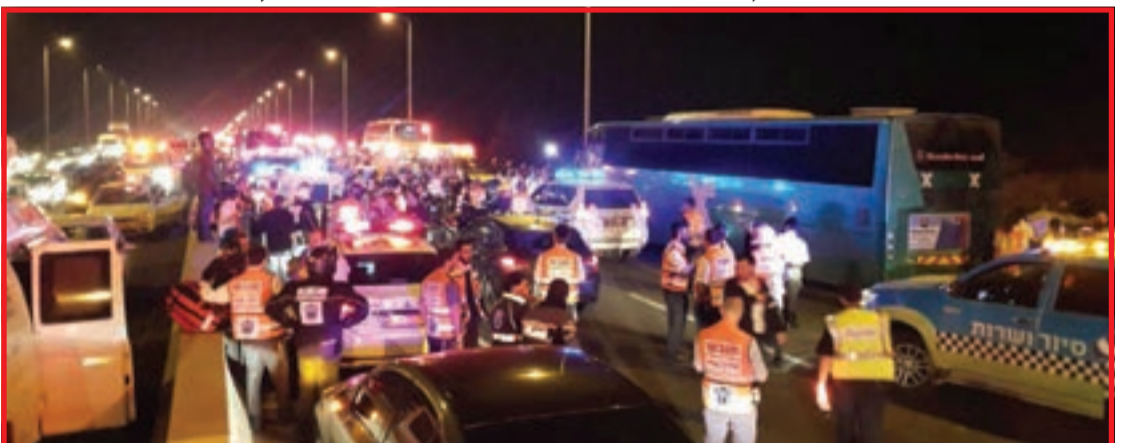
פונתה במצב קשה מאוד. זירת התאונה בכביש 1

בבית החולים אסף הרופא, ממשיכים הרופאים לנסות לייצב את מצבה של שרה שפרלינג שנפצעה באורח קשה בתאונה • מועד החתונה שתוכנן לחודש אדר נדחה