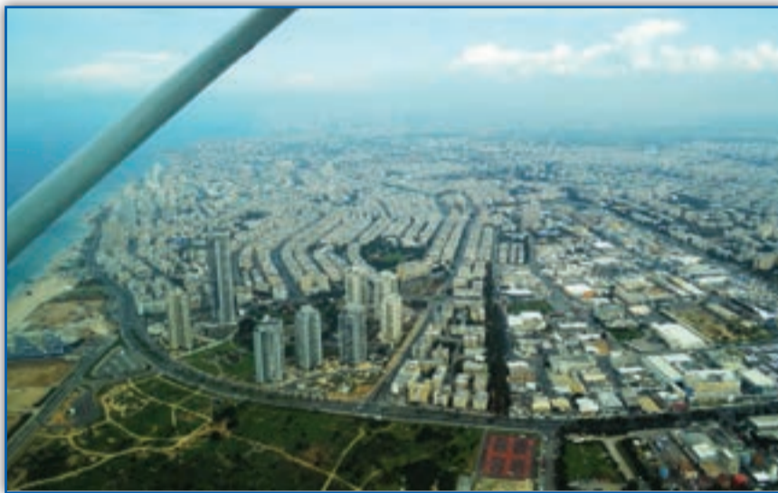
תאוחד עם תל אביב? בת ים

הנראה, מהליכים לפי פקודת העיריות, אשר אכן מתקיימים בעניינה.