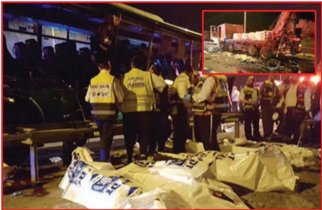
זירת התאונה הקשה. בקטן: המשאית בה התנגש האוטובוס

המשטרה האריכה את מעצרו של נהג האוטובוס, לאחר חקירה במשך שעות ארוכות • בחקירה התברר: לפני שנתיים היה הנהג מעורב בתאונת דרכים דומה בה נפצעו 18 מנוסעי האוטובוס שבו נהג