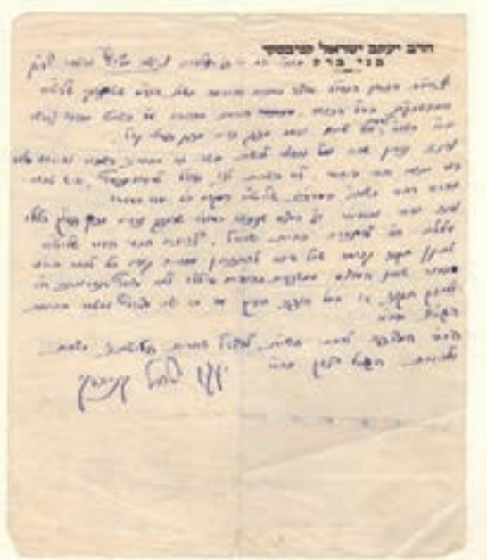
המכתב הנדיר של מרן הסטייפלר זצ"ל, לגר"מ שטרנבוך היותו או צעיר לימים, האריך הסטייפלר זצ"ל בשבחים רבים ומופלגים: "לפאר מעלת כבוד הגאון הגדול, אוצר התורה והיראה, כבוד שם תורתו הגאון רבי משה שטרנבוך שליט"א. אחר

לאחר למעלה מחמישים שנה נמצא בשבוע שעבר המכתב הנדיר שכתב מרן הסטייפלר זצוק"ל בעניין טהרת הייחוס בסוגיא שהסעירה את היהדות בארץ ובעולם לפני יובל. המכתב שמוען לזקן הפוסקים הגר"מ שטרנבוך נמצא לפני שבוע בידי אחד האספנים הגדולים בארה"ב.