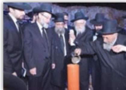
מאת: חיים רייך

ברוב הוד וחרדת קודש התקיים מעמד התפילה ההיסטורי והנחת אבן הפינה לישיבת 'אחינו' במודיעין עילית • המעמד התקיים בראשות רבנים וראשי ישיבות ובהשתתפות רבי דוד הופשטטר נשיא ישיבת 'אחינו' • בשיאו של המעמד סיימו תלמידי הישיבה מסכתות שנלמדו בין הסדרים