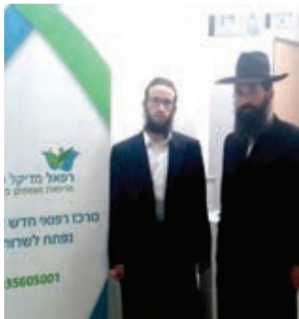
מאת: מנדי קליין

מפגש מיוחד התקיים השבוע ביוזמת "רפאל מדיקל סנטר", לליבוך סוגיות רפואיות שונות לאור ההלכה ● שני מומחי אורתופדיה מביה"ח איכילוב הצטרפו לסגל המומחים של מרפאת "רפאל מדיקל סנטר", ויקבלו קהל מטופלים מכל קופות החולים, מבוטחי ביטוח משלים