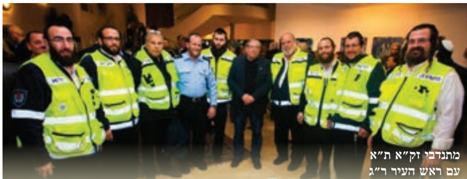
מתנדבי זק"א ת"א עם ראש העיר ר"ג