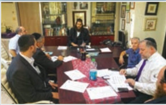
ישיבת העירייה השבוע

כמו כן אושר בישיבת העירייה האחרונה תקציב לשיפוץ מערכת הניקוז העירונית ליד פארק אלעד