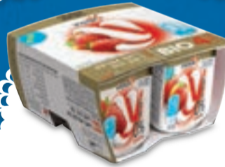
מארז רביעייה דיאט יופלה 0% בטעמי תות ואפרסק 4 יח'י X 150 גרם