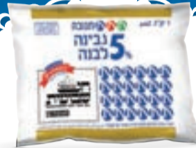
שקית גבינה לבנה 5% 1 ק"ג