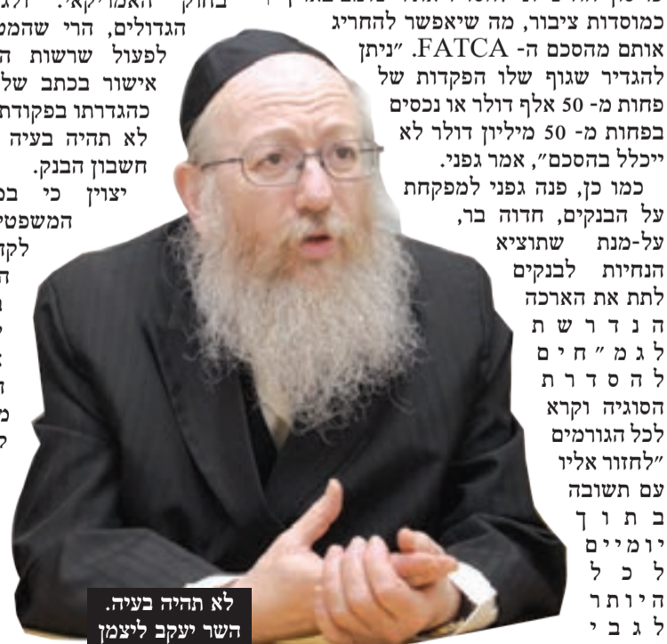
לא תהיה בעיה. השר יעקב ליצמן

כמו כן, פנה גפני למפקחת על הבנקים, חדוה בר, על-מנת שתוציא הנחיות לבנקים לתת את הארכה הדרושה לגמ"חים לחדש הסוגיה וקרא לכל הגורמים "לחזור אליו עם תשובה בתוך יומיים לכל היותר ליגבי