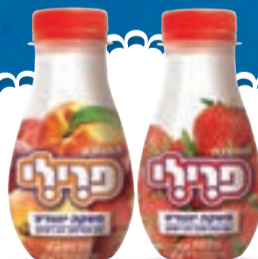
משקאות פרילי בטעמי תות ואפרסק 250 גרם