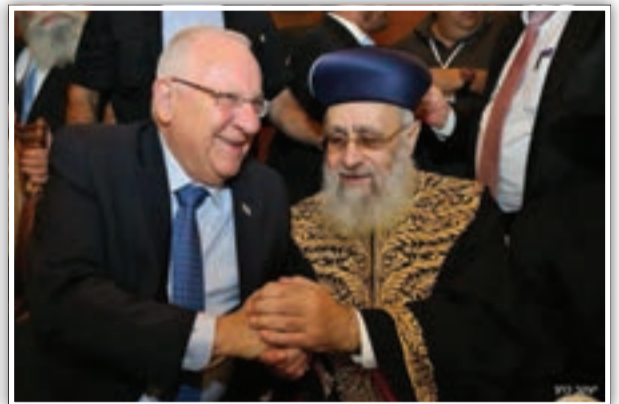
מאת: יעקב אמסלם

השמחה נמשכה עד השעות הקטנות של הלילה, כאשר רצף הבאים לא פוסק, וכולם מתאמצים בדוחק רב ללחוץ את ידו של הראשל"צ ולשמוח בשמחתו. רבים ראו בחתונה זו מפגן כוח ועוצמה של הציבור הספרדי שהצליח להתאחד לאחר פטירת מרן סביב דמותו של בנו וממשיך דרכו, הראשל"צ הגר"י יוסף שליט"א.