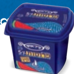
פרוסות בולגרית 5% פיראוס 200 גרם