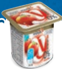
דיאט יופלה 0% בטעם אפרסק 150 גרם