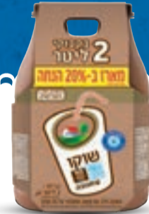
מארז זוג שוקו תנובה 2 יח'י X 1 ליטר