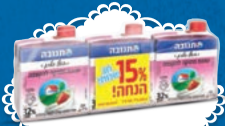
מארז שלישייה שמנת מתוקה להקצפה 32% 3 יח'י X 250 מ"ל