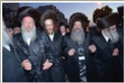
הכנסת ספר התורה