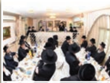
האירוע המיוחד, השבוע

נכון וקשוב להקים ולהפריח יש מאין, במסירות גוף ונפש. לסיום העתיר מברכותיו והעניק לכל תורם כשי את הספה"ק צמח צדיק בכריכת עור עתיק לשמירה ולברכה. המעמד נערך בהפקת מח' יח"צ ע"י הר"ר יחזקאל מילר וצוות המשרד בהשקעה וברמה גבוהה במיוחד כמיטב המסורת, לאות הכרת הטוב לידידים והתומכים הנכבדים, המסייעים לנווט את ספינת המוסדות הק' במסירות רבה, ולזכות סיועם הלבבי ניתן לזקוף את המשך ההתפתחות האיתנה.