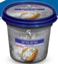
קדם פרש 30% מסדרת השף הלבן 200 גרם