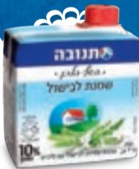
שמנת לבישול 10% 250 מ"ל