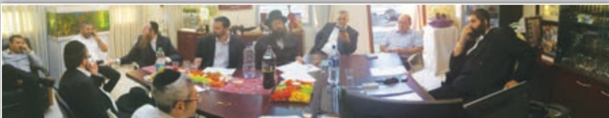
ישיבת הוועדה לזהירות בדרכים

הרשות הלאומית לבטיחות בדרכים הביעה הערכה לפעילות ראש העיר בנושא הזהירות בדרכים, בישיבת הוועדה לבטיחות בדרכים שהתקיימה השבוע