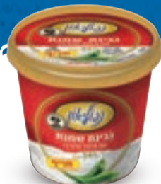
גבינת שמנת נפוליאון עם פלפל חלפניו 24% 225 גרם