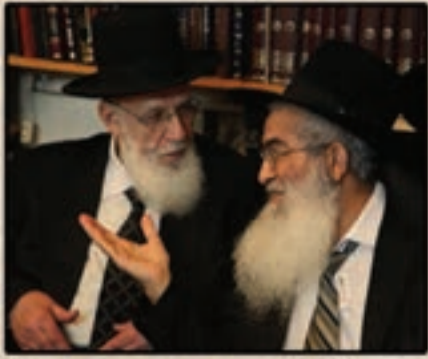
* מן העתונות