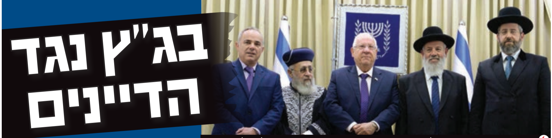
המינוי הקבוע יישאר, הזמניים - בוטלו. הדיין הרב איגרא עם הרבנים הראשיים ונשיא המדינה

בג"ץ ביטל השבוע את מינויים הזמניים של שבעה מדייני בית הדין הגדול של הרבנות • המשמעות: הוועדה למינוי דיינים נדרשת למנות באופן מיידי דיינים בטרם תשותק פעילותו • עד כה הוועדה לא הגיעה להסכמות על זהות הדיינים וכפשרה מונו דיינים באופן זמני