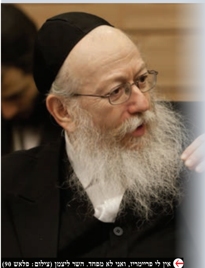
אין לי פריימריז, ואני לא מפחד. השר ליצמן

בשבוע שעבר במסגרת הקמפיין בעד תזונה בריאה יותר, העלה משרד הבריאות קמפיין נגד הנתרן בחטיפים. חברות החטיפים שחששו שהקמפיין יגרום להם לנזק תדמיתי כבד, הבטיחו להציג על גבי האריזות במקום בולט את הערכים השליליים בחטיף. כאמור, כעת חוששים בחברות המזון, שליצמן לא יסתפק בהבטחתם, ויטיל עליהם פיקוח הדוק יותר. בשבוע הבא, צפוי עוד דיון במעמד נציגי חברות המזון ומשרד הבריאות.