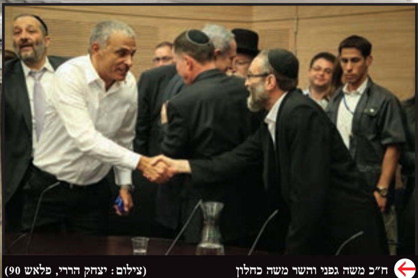
ח"כ משה גפני והשר משה כחלון