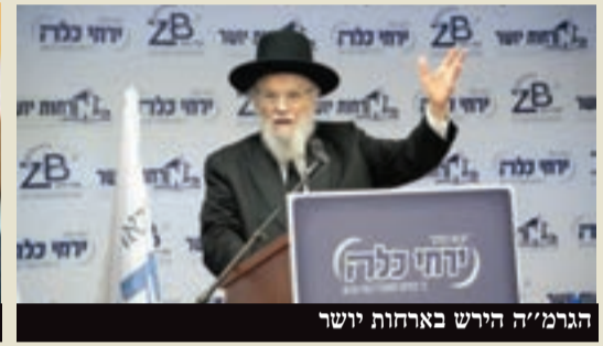
הגרמ"ה הירש בארחות יושר