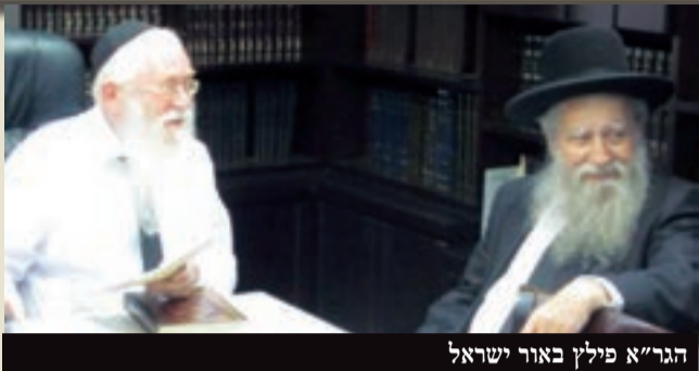
הגר"א פילץ באור ישראל