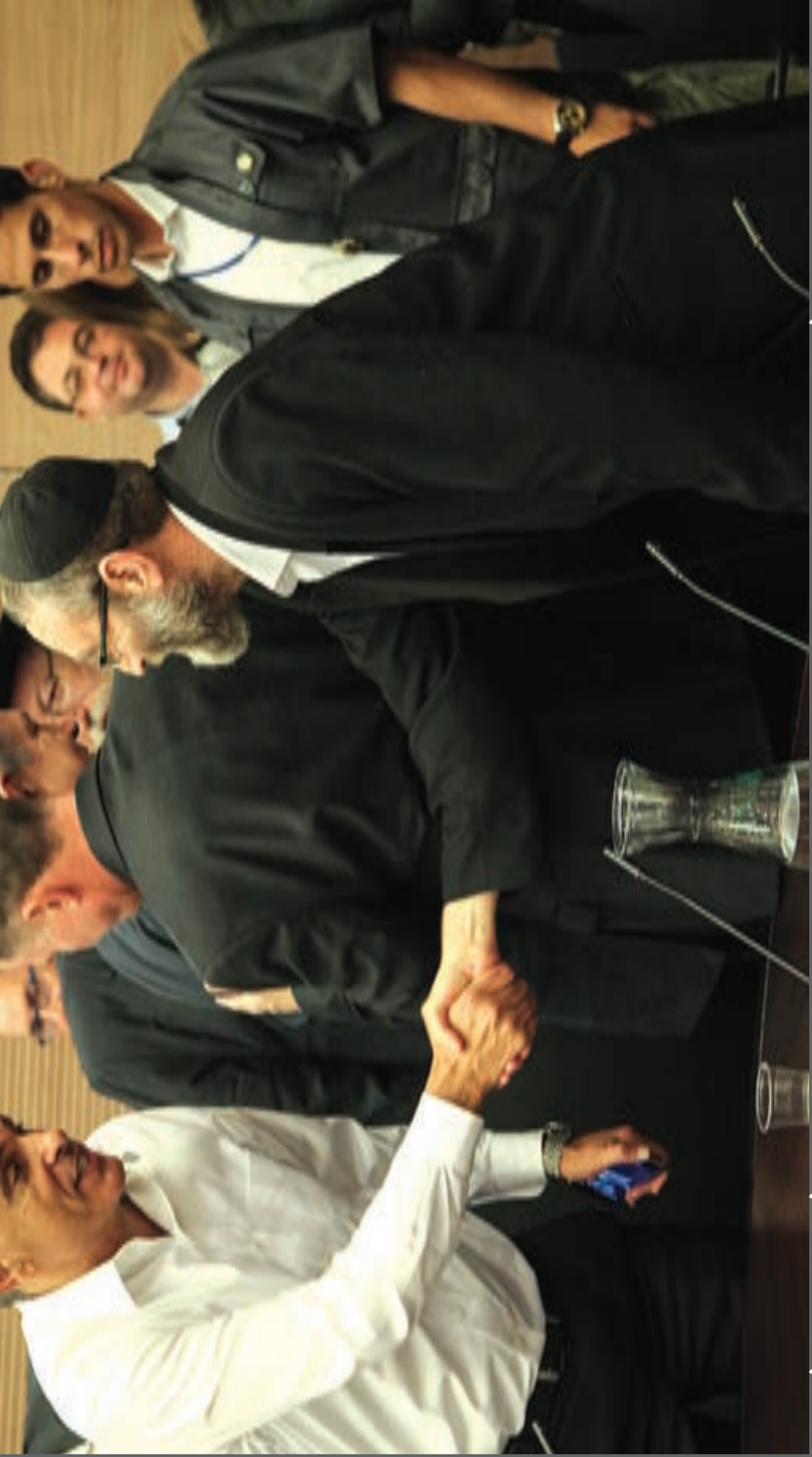
ח"כ משה גפני עם השר משה כהלון

מאבקם של יהודי תימן שדורשים לגלות את בניהם ואחיהם החטופים צובר תאוצה • בתום פגישה שהתקיימה השבוע בכנסת, הודיע ראש הממשלה: צחי הנגבי יוסמך לדון בחומרי ההקירה • עמ' 10