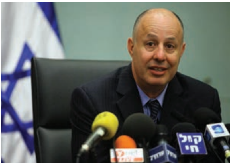
יטפל בחומרים. ח"כ צחי הנגבי