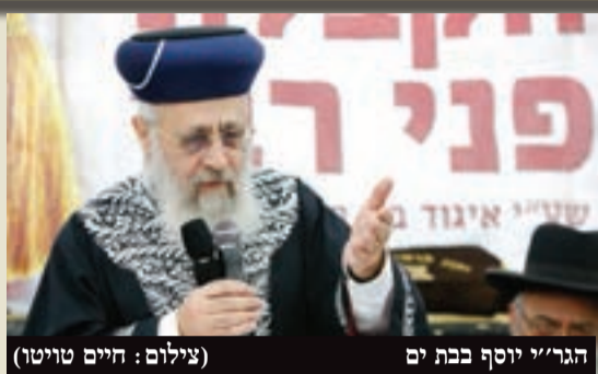
הגר"י יוסף בכת ים