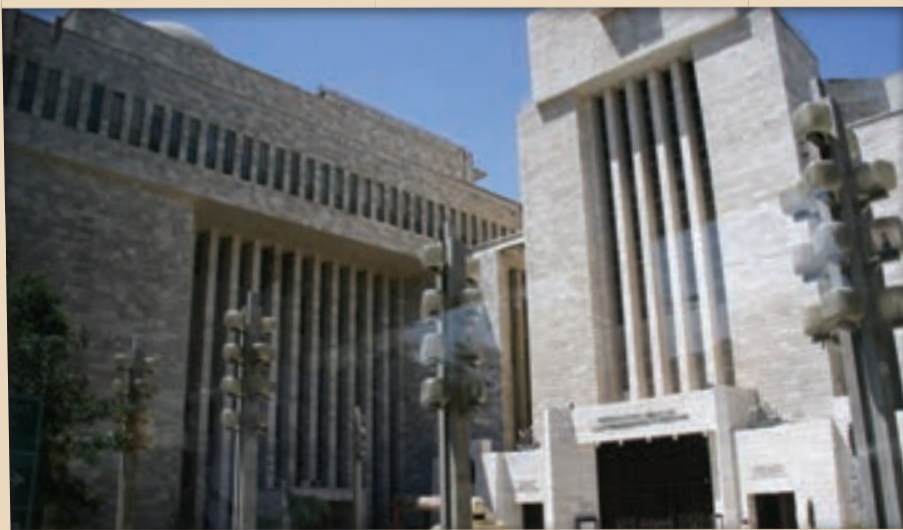
זהו את האתר המופיע בתמונה!