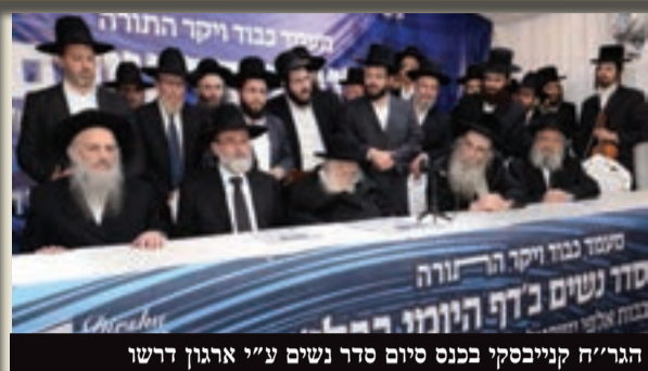
הגר"ח קנייבסקי בכנס סיום סדר נשים ע"י ארגון דרשו