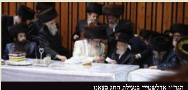
הגר"י אדלשטיין בנעילת החג בצאנז