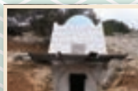
בשבוע שעבר: קבר רבי חנניא בן עקשיא