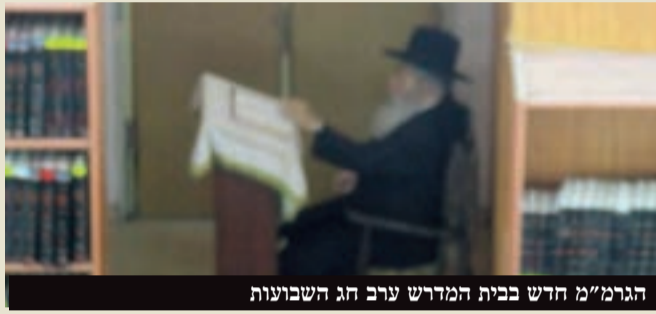
הגרמ"מ חדש בבית המדרש ערב חג השבועות