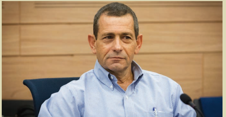
ראש השב"כ, נדב ארגמן אתמול

ראש השב"כ הגיע להופעה ראשונה במליאת החוץ והביטחון, וסיפק נתונים מזעזעים על גל הטרור האחרון • בחודשים האחרונים בוצעו מעל ל-300 פיגועים וניסיונות לפיגועים, מעל 90 פיגועי ירי וכ-30 פיגועי דריסה