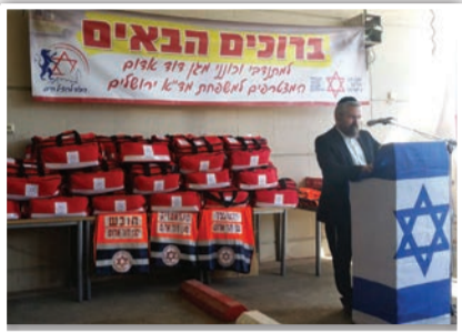
כונני צוות הצלה סניף ב"ש

עשרות מתנדבים חרדים הוכשרו ככונני מד"א ו'צוות הצלה - סניף בית שמש' • המתנדבים החרדים הוכשרו מקצועית בידי מד"א והלכתית בידי רבני צוות הצלה - סניף בית שמש • במד"א נערכים לקראת הקמת תחנה ברמת בית שמש ג'