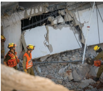
כוחות החילוץ השבוע באתר

עמד בדרישות ונעשה חיטוי כחומרים. המהנדסים והחוקרים יאספו את הקלסרים והמסמכים, ויעברו על החישובים ועל תוכניות הביצוע בכדי לקבל תשובות ברורות יותר.