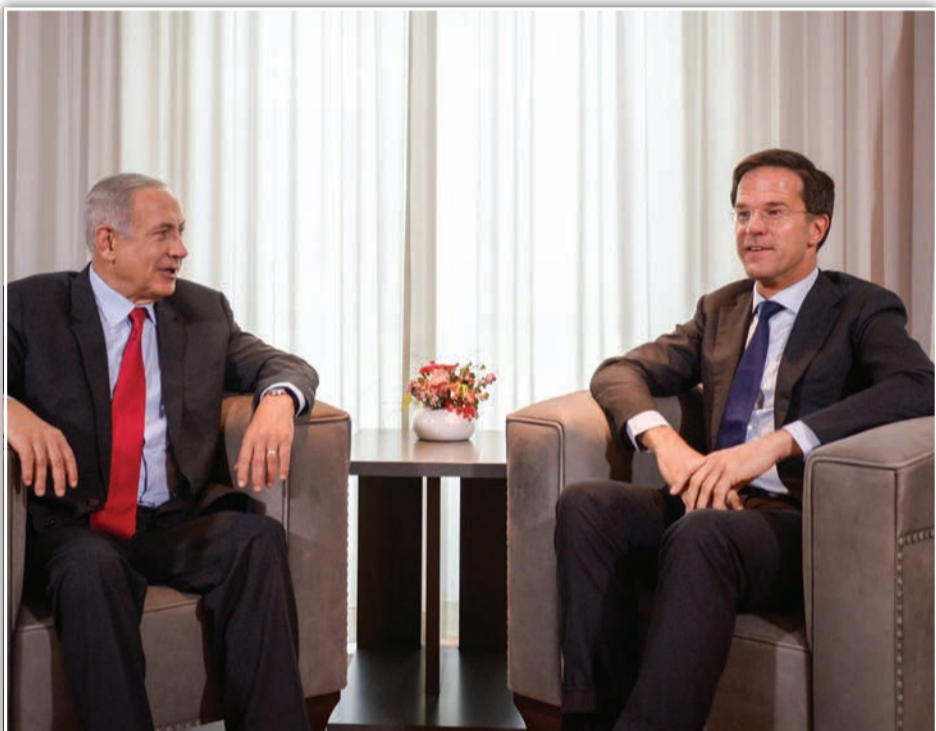
נתניהו עם ראש ממשלת הולנד, השבוע