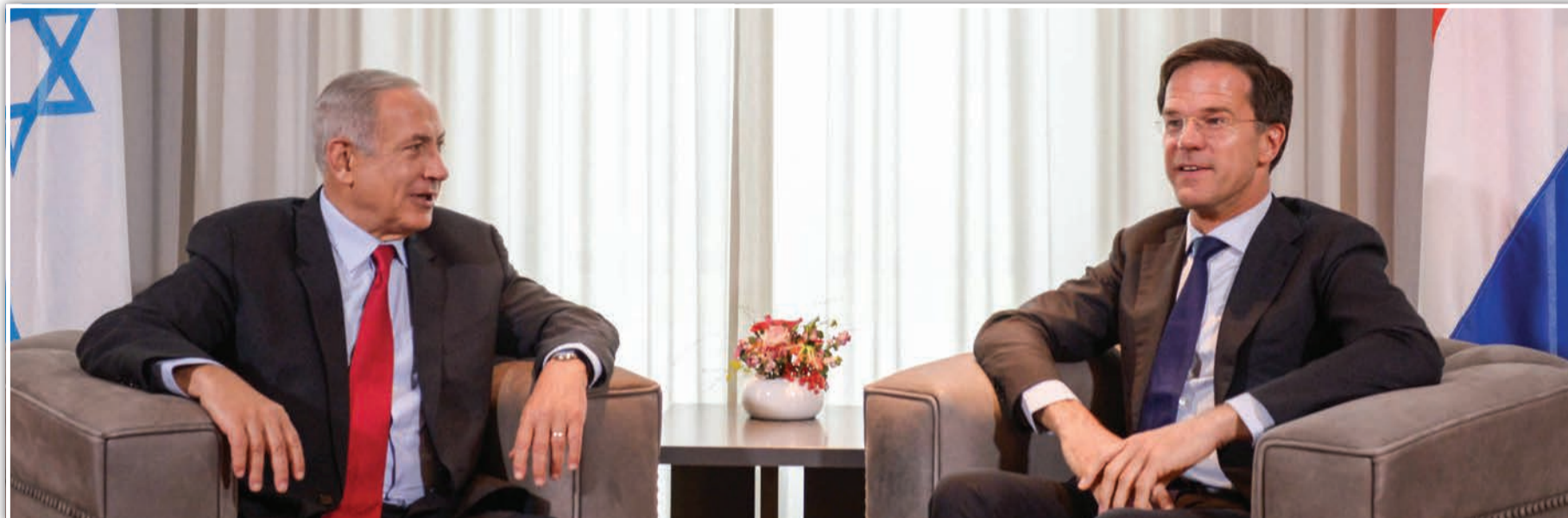
ינחת מהולנד היישר להכנות לשבת. רה"מ נתניהו בביקורו בהולנד, השבוע

משרי הליכוד (ולא ישראל כץ), שאל השבוע את החרדים על הרקע הזה, האם הם מתעקשים להקפיץ את יאיר לפיד בבחירות הבאות לשלושים מנדטים. אכן נראה לאחרונה, שמישהו אצלנו שכח איפה היינו לפני שנתיים.