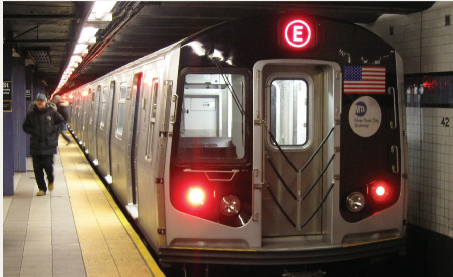
בקרום ברחובות? הסאבווי בניו יורק

"הרעיון ההזוי של פקיד האוצר דאז, לבטל את הקווים שהחלה בנייתם ולהפוך על פיו את כל הפרויקט, נעלם ברגע זה. למעשה, התכנית המקורית שכללה שילוב של רכבות עיליות