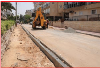
עבודות מערכות העול והתקנת מדרכות

עיריית בני ברק פנתה לתושבי העיר בבקשה לחסום את חצרות הבתים כדי למנוע את הגעת הפסולת למדרכות, כהכנה לקראת ירידת הגשמים שכן הצטברות הפסולת בחצרות וירידתה לרחובות בזמן הגשמים עלולה לגרום לחסימת קולטני תעלות הניקוז ולהצפות, וזאת למרות הניקוי היסודי של התעלות ברחבי העיר.