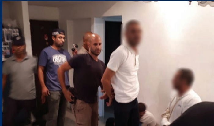
נתפסים בדירת המסתור.

שבוע לאחר שתועדו מכים באכזריות מאבטחים בבית החולים 'איכילוב', נתפסו התוקפים בדירת מסתור בבת ים ● תיעוד המקרה ממצלמות האבטחה זעזע רבים, והציף מחדש את סוגיית האלימות בבתי החולים