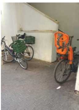
אופניים בשכונה, על הכוונת

על פי הערכה, מרבית הגנבים הינם צעירים שנשרו ממסגרות ומדרך הישר, שאף קשורים ביניהם ופועלים בסוג של תיאום. מתיעוד של שני מקרי גניבה שהתרחשו במוצאי שבת פרשת בראשית וביום שלישי שלאחר