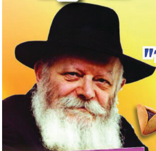
ברכת הרבי שליט"א מלך המשיח לבאי הכנס