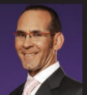
ישי לפידות זמר ומפיק מוסיקלי