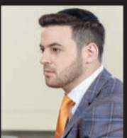
אהרליה נחשוני המאסטרו