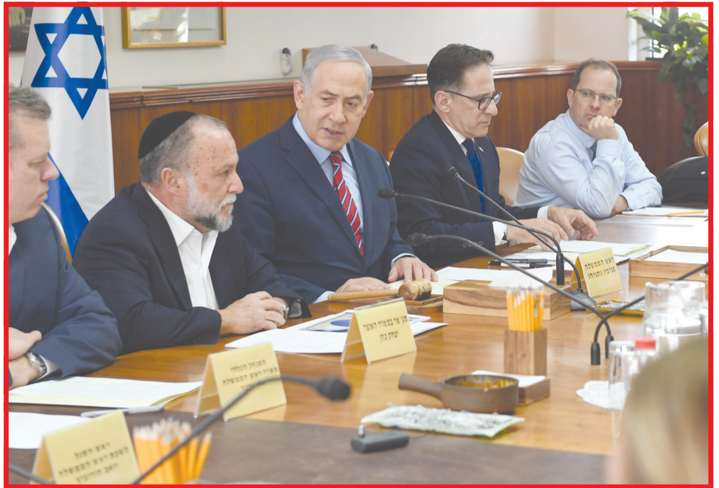
"להכיר במגבלות הכוח, דווקא מעמדת כוח", נתניהו וכהן בישיבת הממשלה.

את התרגילים של הערמה על גופי חקירה מקבילים והשתלטות על התיק ברגעים המכריעים – אלשיך הביא עמו מחדרי החקירות של השב"כ. במסדרונות הכנסת נמצא השבוע מי שהתלוצץ ואמר, כי אלשיך הוא התימני השני עם כיפה שעומד לחסל ראש ממשלה