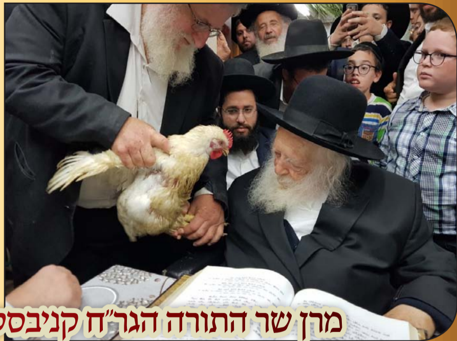
מרן שר התורה הגר"ח קניבסקי בערב ומוצאי יום הכיפורים