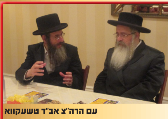
עם הרה"צ אב"ד טשקווא