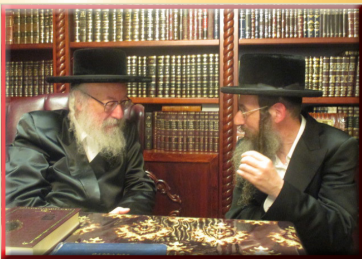
בביקור אצל האדמו"ר מוועין