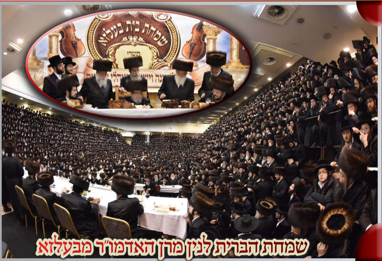
שמחת הברית למן מרן האדמו"ר מבעלזא