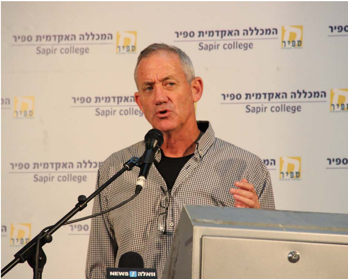
בני גנץ.

ככל שהבחירות מתקרבות, כך רף הדיווחים עולה והלחץ סביב הרשימות השונות, ימין, שמאל, המפץ החרדי, החיבורים בציונות הדתית ועוד - גדל. בבחירות הנוכחיות, כמעט לכל מעשה של מפלגה כזו או אחרת, יש השלכה על גוש שלם ולכן החישובים מדודים מאוד מכל כיוון. חיבורים שטבעי שיעשו, עוד לא נעשו, קולות נספרים בצורה מדוקדקת ובעיקר לחץ מאוד גדול מראש הממשלה לחיבורים בימין, ומנגד, מפעילי שמאל לחיבורים בתוך השמאל, במטרה להצליח ליצור אפקטיביות מכל מנדט באשר הוא.