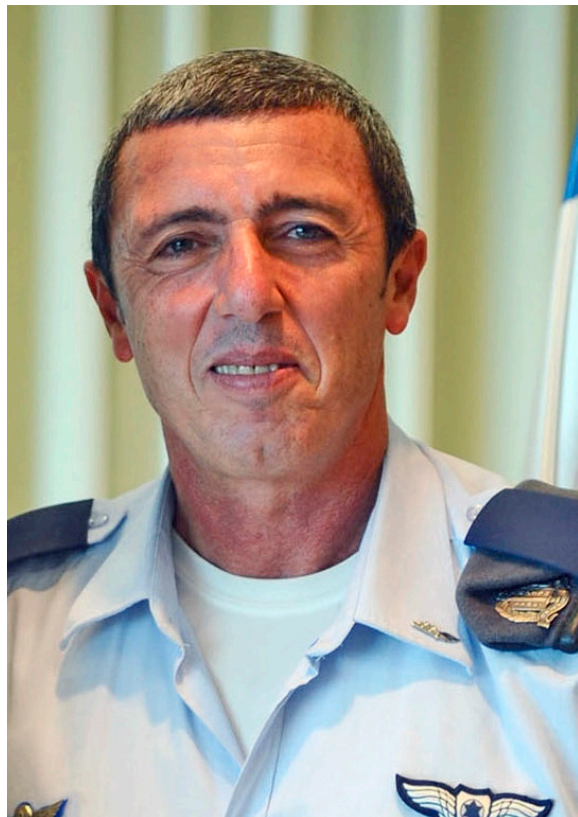
הרב רפי פרץ בשירותו הצבאי

מסיבת סיום ב-600 אלף שקלים מכספי המיסים". כשנאמר לו שגנץ לא היה מודע לעלויות המסיבה, הוא השיב: "כאילו הרמטכ"ל הוא איזה אוטיסט שלא מבין כלום". ההתבטאות החריפה עוררה רבה בקרב הפוליטיקאים. וראשון המגיבים היה דווקא יאיר לפיד יו"ר יש עתיד המתמודד עם בת אוטיסטית. בפוסט ברשתות החברתיות כתב לפיד: "דודי אמסלם אמר עכשיו ברדיו על בני גנץ שהוא אוטיסט. כי להיות הילדה שלי זו קללה בעיניו. כי בעולם של אמסלם הולכים תמיד על הראש של החלשים".