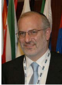
א.די.בי גירעון עצום של 444 מיליון שקל בהון העצמי, שהעמיק מהיקף של 230 מיליון שקל בסוף 2018. לחברה מזומנים של 671 מיליון שקל בקופה, חוב של 2.8 מיליארד שקל, ובשנתיים הקרובות היא אמורה לפרוע 1.249 מיליארד שקל.