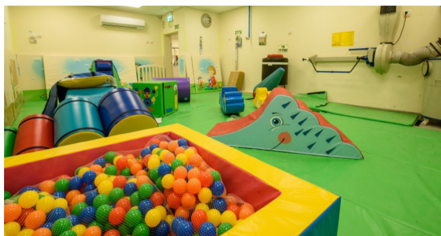
מעון ה"ד בקריות

יזמה חדשה החל מהשנה הקרובה: הכשרת מטפלות לגיל הרך • ההורים ירוויחו שקט נפשי - הגננות יתומצו ב-2,000 שקלים • כל הפרטים