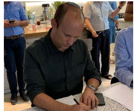
בנט חותם על הסכם האיחוד בימין

המפלגות הערביות מציגות אחדות שורות, כאשר כל התנועות ירוצו תחת מפלגה אחת. האחרונה להצטרף לעגלת הבחירות הייתה