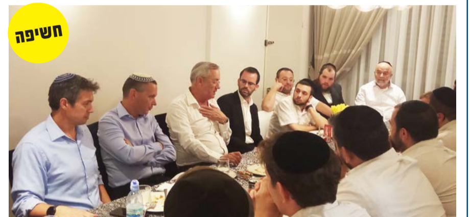
ח"כ בני גניץ בביקורו בבני ברק

יו"ר 'כחול לבן' הגיע לסיור ליל-שישי בבני ברק והתיישב לשיעור גמרא ולשיח עם תושבים • על יחסי דת ומדינה: "הסוגייה לא צריכה להיות הפרדת דת ומדינה אלא הסדרת דת ומדינה, בסוף, אנחנו מדינה יהודית עם ערכים יהודיים ומסורת יהודית" • על אידי לפיד: "הוא לא אנטי חרדי. תפיסתו חילונית, ישרה, עמוקה - לשיטתו. לכל אחד יש את הגוונים שלו, אני מציע לכולנו: בואו נימנע מפסילות"