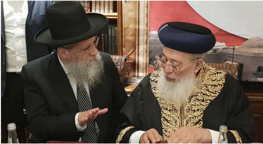
מאת: חיים וייס

המעמד נערך בלשכת בעל 'הלכה ברורה' וראש מוסדות 'יחוד דעת' חבר ה'מועצת' הגאון רבי דוד יוסף, שאף יעמוד בנשיאות הארגון • הגרש"מ עמאר: "הרעיון הזה יצליח ויעשה מהפכה בעם ישראל" • הגר"ח רבי: "מעלת הגבאים גדולה וביכולתם לחולל מהפכה רוחנית" • הגר"ד בצרי: "זה הדבר הכי גדול שבעולם"