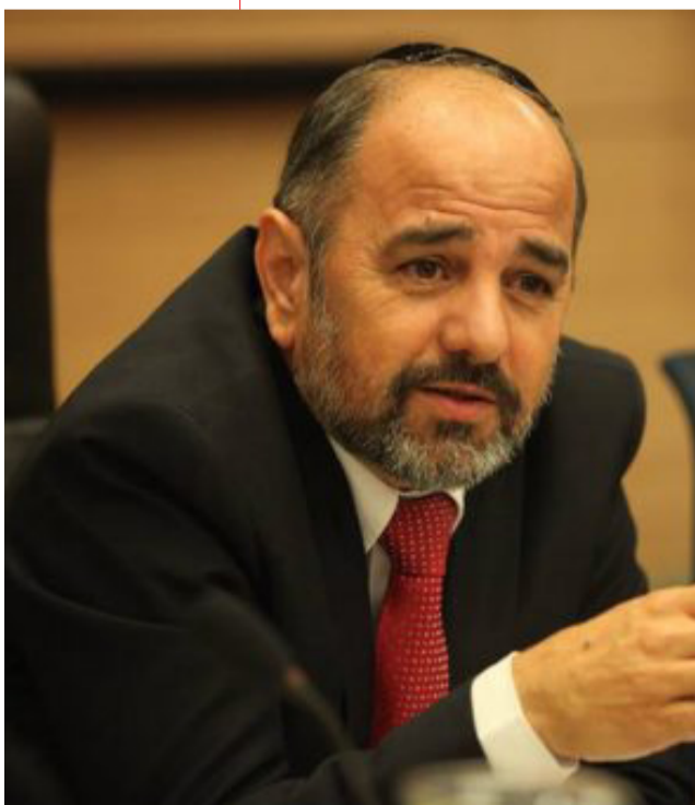
סולח אן לא שונח. ח"כ מרגי

את העקבים הגבוהים ששקד קיבלה השבוע בזכותו, ביבי עוד יחוש פעם אחר פעם ננעצים בגבו. שקד, ייאמר לזכותה, הוסיפה ומחלה על כבודה הנרמס, ועשתה זאת באותה מידת צניעות שמאפיינת לאחרונה את הנהגת הבית היהודי - והרב רפי הפליג בשבחה (ובשבחו). הצניעות והצביעות מעולם לא דרו כך בכפיפה אחת, אם כי, דווקא האישה שבחבורה - נודעה תמיד כמי שפיה וליבה שווים, בניגוד לכמה מהגברים.