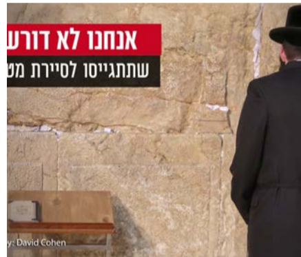
מתוך סרטון התעמולה של ישראל ביתנו

ביום ראשון, כינסה מפלגת העבודה 'מסיבת עיתונאים' מיוחדת ובה נמסרה הודעה "דרמטית": "...ח"כ איציק שמולי נשאר במפלגה. ההודעה מגיעה על רקע לבטים ארוכים של שמולי, תוך שהוא שוקל לחבור למחנה הדמוקרטי, אך לבסוף החליט להיותר בביתו הפוליטי, לא לפני שמתח ביקורת על יו"ר מפלגתו על התעקשותו שלא לחבור למפלגות האחרות בגוש. על פי הסיכומים, שמולי יוצג בפרסומי הבחירות כחלק מההנהגה לצד לוי אבקסיס ופרץ, והוא יהיה אחראי על הקמפיין.