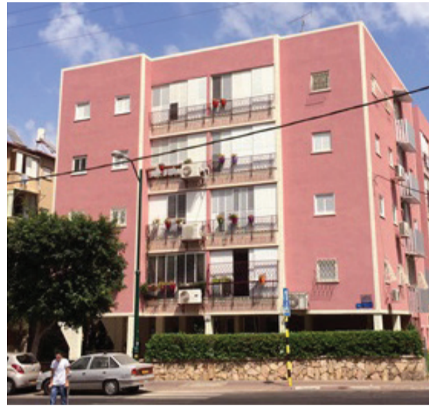
רחוב דרו 26.

שנים למימון מלא של חלקו בשיפוץ, העירייה מצידה סופגת את כל עלויות הריבית וההצמדה. עבור הדייר מדובר בתשלום חודשי קבוע של עד 250 שקלים לחודש. בכל בניין היקף השיפוץ שונה, אולם בדרך כלל מדובר בשיפוץ כניסה ולובי, החלפת מסתורי כביסה, יישור מזגנים, ע יטורים וכמובן צביעת המעטפת החיצונית ב מגוון צבעים אפשריים. משך השיפוץ הוא