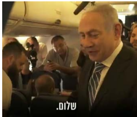
נתניהו מקבל פני עולים במטוס

במסגרת המאבק על הקול הרוסי, הטריח את עצמו ראש הממשלה בנימין נתניהו לנתב"ג, לקבל פנים לעולים מברית המועצות. נתניהו שוחח, הצטלם וחילק דרכונים. השבוע פורסם כי נשיא רוסיה פוטין צפוי לבקר בישראל לפני הבחירות, וכי נתניהו ביקש מעיריית ירושלים למהר לאשר הצבת אנדרטה שתמנף את הביקור. הידיעה הוכחשה. עוד במסגרת המאבק על קולות עולי ברית המועצות: נתניהו צפוי לצאת בחודש הקרוב לביקור באוקראינה.