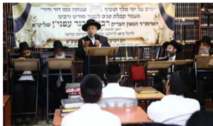
מעמד סיום הזמן