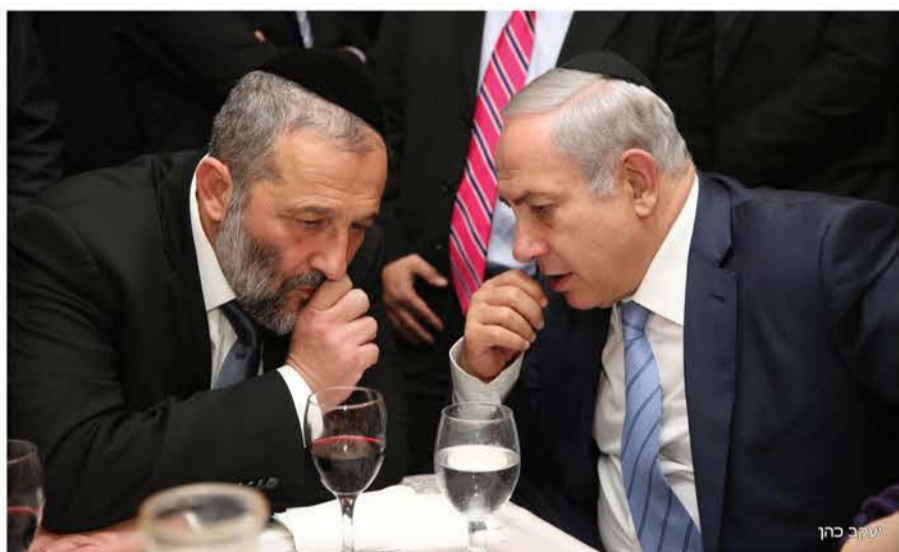
מנע את פיטורי השר סמוטריץ'. דרעי ונתניהו

החלטת השופט יונתן אברהם למנוע אירוע בהפרדה של הופעת זמר חסידי עוררה סערה ציבורית ופוליטית חסרת תקדים • השר בצלאל סמוטריץ' תקף את נתניהו על שלא מטפל במערכת המשפט וכמעט פוטר מהממשלה, עד שהשר אריה דרעי נזעק כדי לתווך ולדבר על ליבו של ה"מ שיסתפק בנזיפה • במקביל, שורה של חברי כנסת מהימין ומהשמאל, כמו גם אנשי תקשורת חילונים הביעו תמיכה בקיום אירוע בהפרדה עבור הציבור החרדי • היום, בעקבות עתירה שהגישה ש"ס, בג"צ יכריע סופית האם האירוע יתקיים במתכונתו | עמ' 10