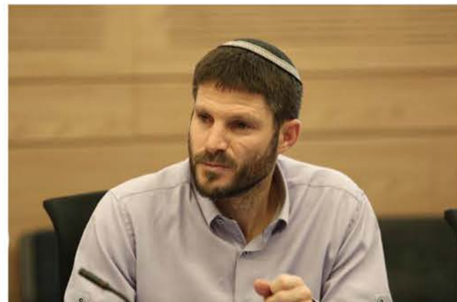
השר בצלאל סמוטריץ

“לחברות השדולה בטח אין כל קשר לאירוע ואף אישה שהייתה מעוניינת להגיע לאירוע לא מרגישה מיועגת על ידי השדולה. כנראה שהסלוגן ‘חיה ותן לחיות’ הוא חד צדדי וצבוע. לחרדים מגיע כמו כולם להנות מאירועי תרבות