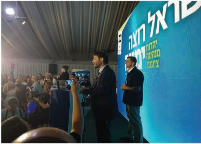
השר סמוטריץ בהשקת "ימינה"

השר בצלאל סמוטריץ נגד ראש הממשלה נתניהו, השרה מירי רגב נגד השרה לשעבר איילת שקד, אהוד ברק נגד בני גנץ, הליכוד נגד אבי ניסנקורן • המערכת הפוליטית נכנסת לישורת האחרונה של מערכת הבחירות ובימים מנסים לשמור על כל קול כדי לא לאבד את השלטון