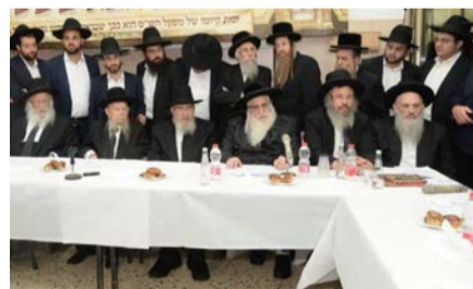
התחלת הזמן בישיבות ובכוללים.