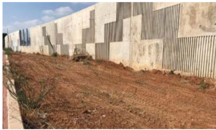
סלילת הכביש העוקף