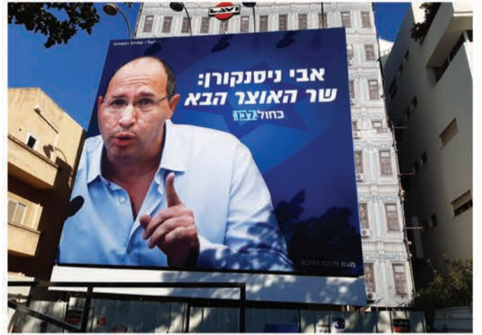
הקמפיין נגד אבי ניסנקורן