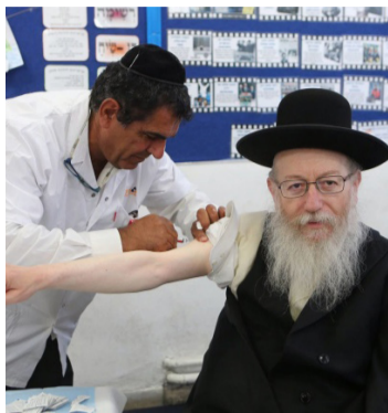
מאת: זאב סגל

שר הבריאות יעקב ליצמן התייחס בדברים שנשא לרגל תחילת יישום 'חוק סימון המזון' למחסור בחיסוני שפעת ותלה את האשמה בכך בארגון הבריאות העולמי.