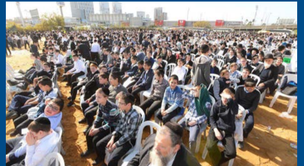
אלפי הילדים במעמד ההיסטורי