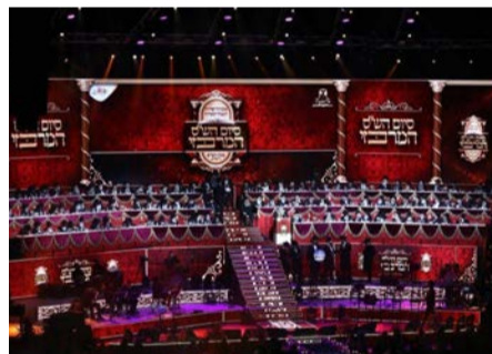
היכל הארנה לפני האירוע