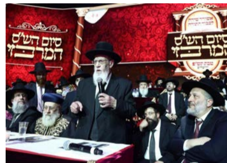
מרן הגר"ש כהן במשא