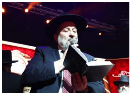
יו"ר ש"ס השר דרעי במעמד הסיום