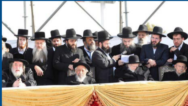
מורנו הגר"ש מביא את ברכת אביו מרן הגר"ח קניבסקי