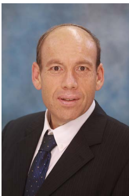
תרומה לילדים האלרגיים. מבקר המדינה מתניהו אנגלמן

בשיחה עם מקורבי סער הם דוחים את רעיון העוועים, "כל הכותרות, השמועות, הרעיונות והסיפורים שעוסקים בסער מגיעים מיריביו", הם מבהירים, "כשגדעון רוצה להגיד משהו - הוא עושה זאת בקולו באופן צלול וברור. מפלגת הליכוד היא ביתו, ובניגוד לאחרים שלוטשים עיניים לצמרת - הוא מעולם לא 'עשה סיבוב' במפלגות אחרות"