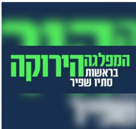
מפלגות נולדות. הלוגואים החדשים של המפלגה הירוקה ושל הבית היהודי המאוחד

נציגייה ביקשו מהוועדה המסדרת בראשות ח"כ אבי ניסנקורן להתפצל לשתי סיעות – אגודת ישראל ודגל התורה. ובכן, לא מדובר בדרימה אלא בפיצול ל"צרכים טכניים" עם רווחים כספיים בתקציבי מימון הבחירות. ובתוך כך, בישיבת הממשלה בבוקר יום ראשון, אושר פה אחד מינויו של יעקב ליצמן לתפקיד שר הבריאות, תפקיד אותו החזיק באופן רשמי ראש הממשלה, שנאלץ לעזוב בשל כתבי האישום.