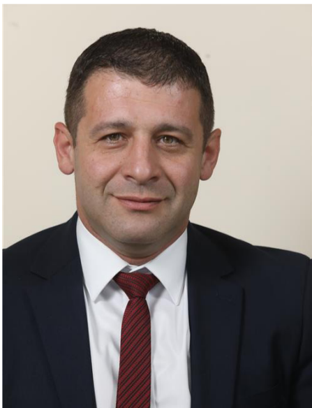
« הסתה חמורה. ח"כ אלכס קושניר | צילום: דוברות הכנסת »

מראה מרנן ורבנן גדולי ומאורי הדור נשהם יושבים בכותל המזרח וכל העם תחתם וביציעים היווה את המסר החינוכי החשוב ביותר שניתן היה להשיג מערב שכזה. גדולי התורה למעלה, עסקנים למטה. עיקר וטפל אינם משמשים בערבוביה. סיום הש"ס הינו אירוע תורני, ואת עיקר הבמה אמורים לקבל התורניים שבחבורה. לעסקנים שבחבורה יש את הזמן והמקום בו הם יכולים וצריכים להביא את עצמם לידי ביטוי