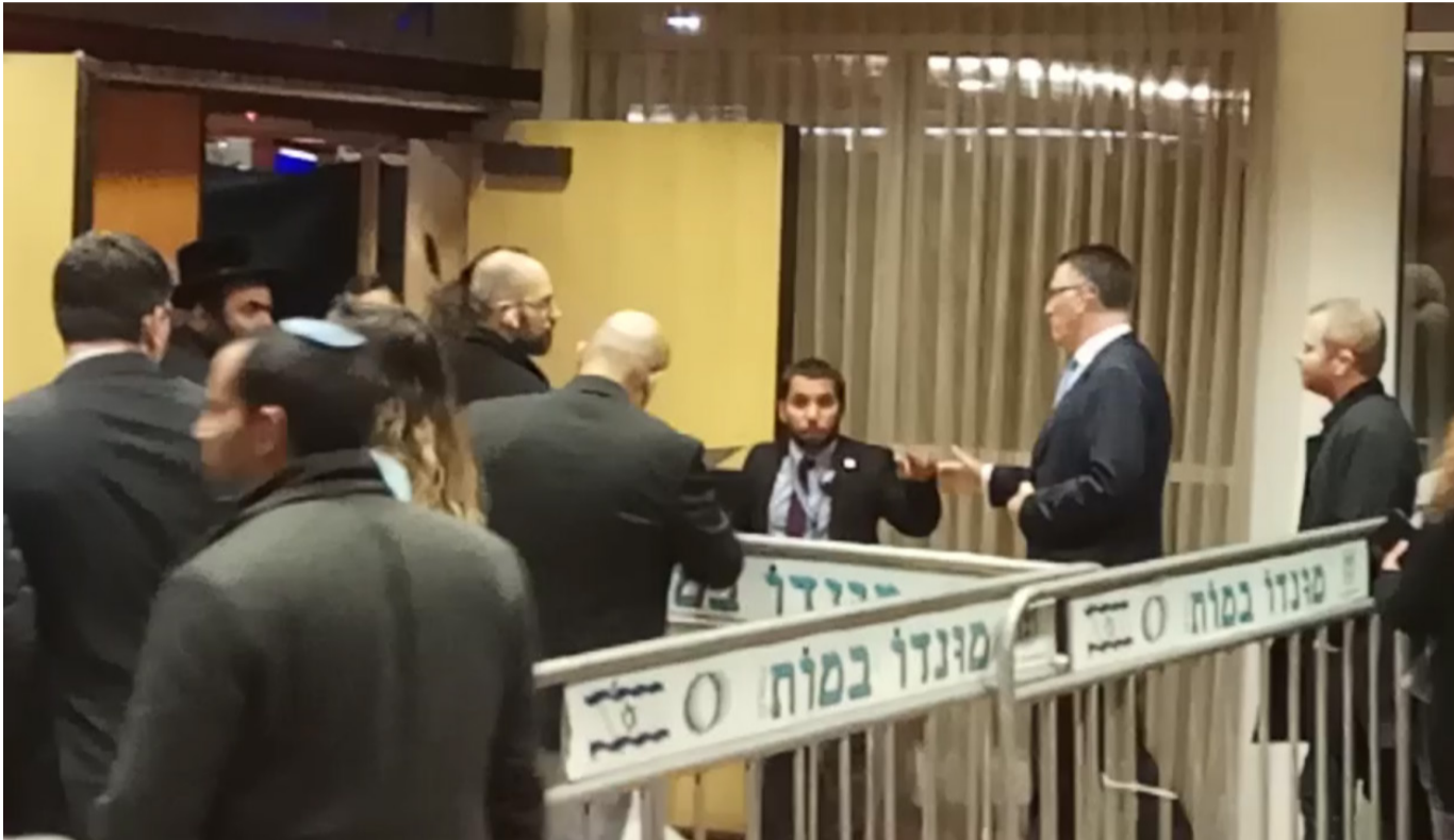
סער נכנס לאירוע הליכוד

אנחת רווחה בבית דין: שופטי בג"צ טרם הכריעו אך מדברי השופטים במהלך הדיון, נטו השופטים בדעתם שאין מקום להתערבות משפטית בסוגיית נתניהו צלח את 2 המשוכות הראשונות בדרך לבחירות: החלטת בג"צ וקודם לכן, הניצחון בפריימריז על גבעון סער בפער עצום • ובימין הדתי: שבוע וחצי אחרי התרגיל הפוליטי שעשו לו רפי פרץ ואיתמר בן גביר, השר בצלאל סמוטריץ' שבר שתיקה