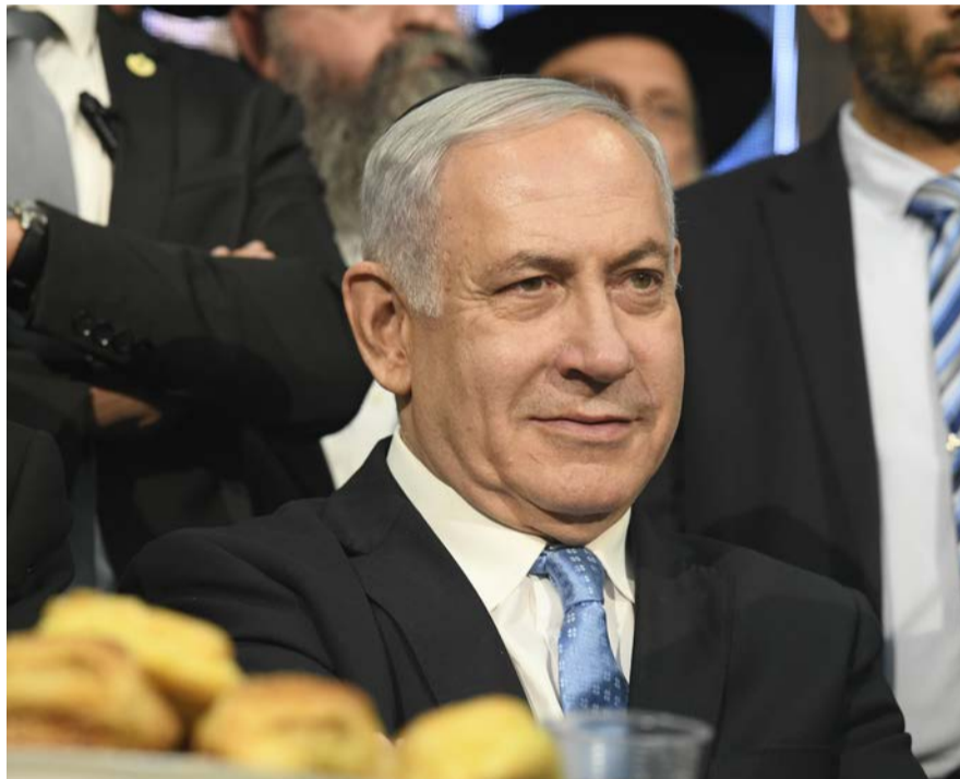
בנקודת זינוק לקראת הבחירות הקרובות. נתניהו

זו אינה אמריקה המוכרת. היבשת הבטוחה פינתה את מקומה לטובת זו המאוימת. לא עוד חוף מבטחים שבו קיים פולחן לכל הדתות ויהודי יכול לצעוד בקומה זקופה מבלי לחשוש לשלומו. מזה זמן התושבים החרדים בברוקלין