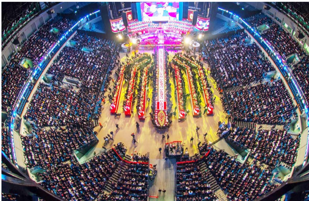
הקהל הנצום בהיכל הארנה בירושלים

החסידי אברהם פריד ותזמורתו, שהקפיץ את הקהל בשירי שמחה על כבוד התורה, יחד עם