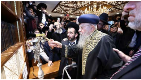
מאת: מנחם הירשמן

מעמד מרומם בהדלקת נרות חנוכה בבית מדרשו של הראשון לציון הגר"א בקשי-דורון