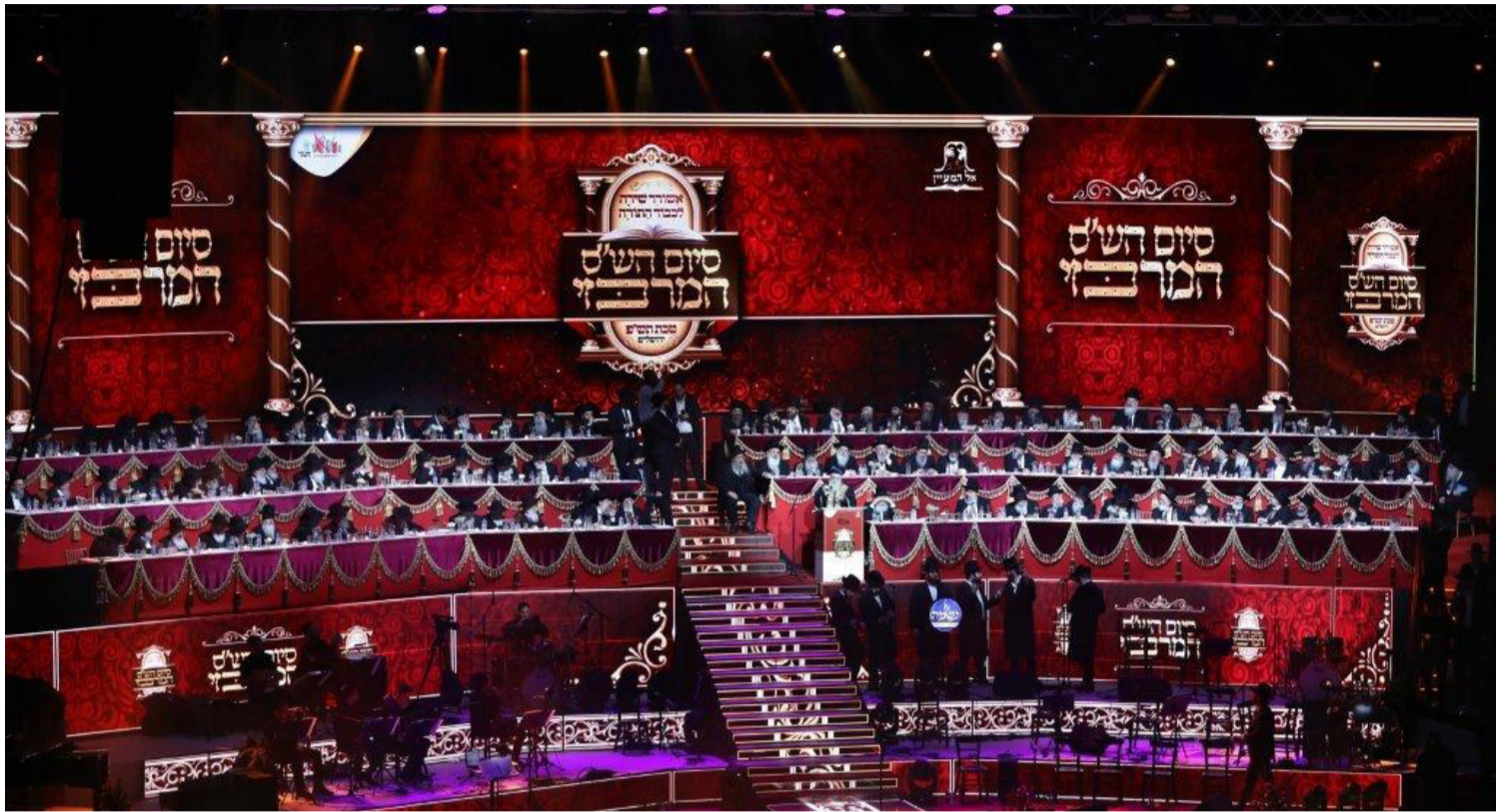
סיון הש"ס הינו אירוע תורני, ואת עיקר הבמה אמורים לקבל התורניים שבחבורה. שולחן המזרח בהיכל הארנה | צילום: יעקב כהן

» כל אחד במערכת הפוליטית יודע שיתכן ייבוא יום שהוא יהווה מטרה לפתיחת חקירה ויהפך לחשוד בפלילים כשהיכולת היחידה שתהיה לו להתמודד מול המערכת היא באמצעות החסינות. עשרות תיקים של אנשי ציבור נפתחו בקול רעש גדול ולבסוף נסגרו בקול ענות חלושה לא לפני שהתפרקו חייו של האובייקט התורן ומשפחתו שילמה מחיר אישי נכבד. חסינות בהחלט יכולה להועיל בהאטת הקצב וביכולת להוכיח חפות