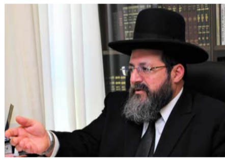
מאת: אלי כהן

רב הרב הראשי של בת ים יוצא למתקפה נגד מינוי רבנים על ידי ראשי ערים, ומזהיר כי מדובר בפרצה שתכניס בעתיד רפורמים למערך הרבנות בישראל. על פי חשיפת 'יום ליום', הרב אליהו