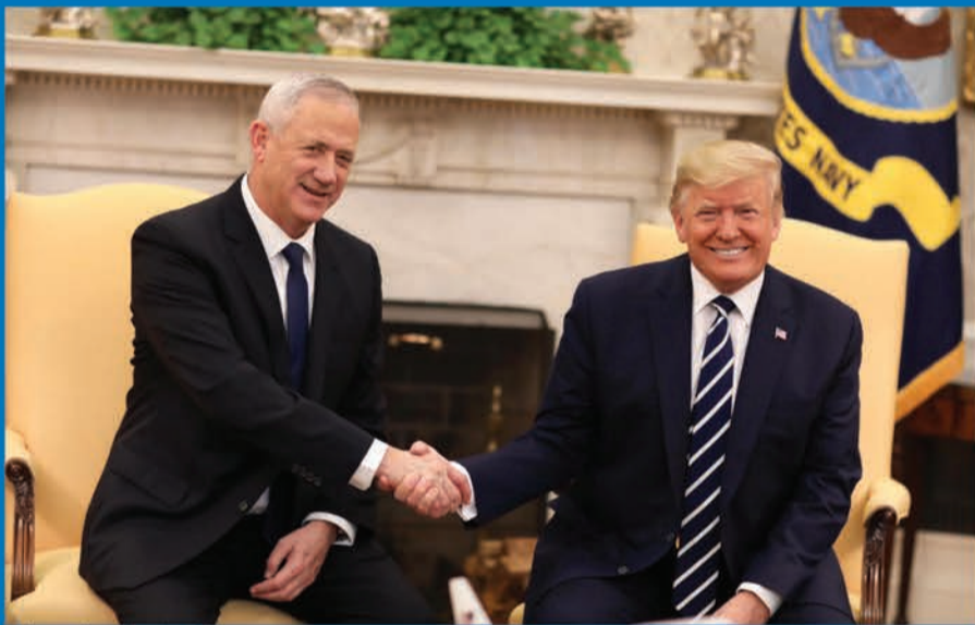
תמונה שהיא הישג. טראמפ עם יו"ר כחול לבן