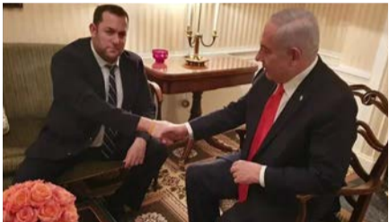
נתניהו עם יוסי דגן

בשיחה עם 'קו עיתונות' אומרים אותם גורמים כי "המהלך להחלת הריבונות על ההתיישבות ביהודה ושומרון מבורכת, ובאמת הגיע הזמן שאחרי כל השנים שמדברים על זה שזה אכן יצא לפועל בתמיכת הקהילה הבינלאומית".