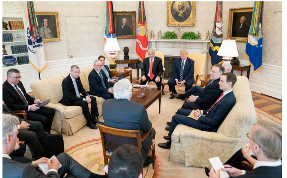
טראמפ ונתניהו עם המשלחת הישראלית בבית הלבן