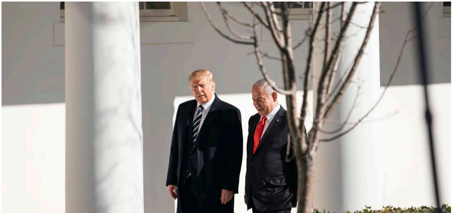
מנסה לקבוע סדר יום ביטחוני. נתניהו וטראמפ בבית הלבן

» נאמנה למסר העיקרי של מהסבבים הקודמים, מחבקים את נתניהו לאורך כל הציר ומשדרים למצביע הפוטנציאלי ששמירה על שלטון הימין עוברת דרך הצבעה לש"ס. כל מהלך שנתפס כימני, זוכה לתמיכתה של ש"ס, החל מהתמיכה בפסילתה של חברת הכנסת היבא יזבק מהרשימה המשותפת בעקבות התבטאויותיה מהעבר וכלה בסיוור מתקשר בבקעת הירדן, סיור שנולד מהשיח על סיפוח הבקעה והחלת הריבונות בכל רחבי ארץ ישראל. בכל מחקרי העומק שעשו בש"ס הם נחשפו לנתון שחזר על עצמו פעם אחר פעם. ישנו ציבור ימני מסורתי שיכולים להיות חלק מהאלקטורט הש"סי רק אם המפלגה תשדר עודף ימניות והיצמדות לנתניהו. מתוך תשעת המנדטים שיש כיום לש"ס, ששה מהם הם חרדים הכפופים למועצת חכמי התורה, שימור שלושת המנדטים הנוספים יקרה רק באמצעות שילוב הדוק של מסרים ימניים ומסרים הקשורים במסורת ישראל. דמותו של מרן הרב עובדיה יוסף זצוק"ל וקולו הקורא להצביע ש"ס מצליחים כל פעם מחדש לרגש את המצביע הספרדי הפוטנציאלי ובתוספת מסרים ימניים שלא נראו בעבר הופכים את המנדט העשירי למשהו שהוא בר השגה. למרות המשואה המפורסמת נתניהו זה הליכוד והליכוד זה נתניהו, בסרטון הבחירות הראשון, העלו יועצי הקמפיין של ש"ס מהאוב התבטאויות של חברים מהליכוד וממפלגות הימין כנגד נתניהו. האיום של איילת שקד באזכור פשעי אוסלו ובהפצת השקר המפורסם בדבר תמיכת ש"ס בהסכם מוכיח את אמיתות הטענה שבהזדמנות הראשונה עלולים כמה מהחברים שם לקפוץ על העגלה של 'כחול לבן' ולכן אין להם בעיה לירות בתוך הנגמ"ש. אמנם באיחור, אבל ביבי כבר מפנים את דברי הנביא "אויבי איש אנשי ביתו".