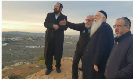
תורת ישראל בע"ה החוט המשולש לא במהרה ינתק, התחייב.

יו"ר ש"ס נשאל על ידי עיתונאים שנכחו בסיוור על הפרסומים אודות הקמת מטה הספרדים בדגל התורה, וטען כי "מאז שדגל הקימו את המטות אנחנו עולים כל פעם המנדט, אז שיהיה להם בהצלחה".