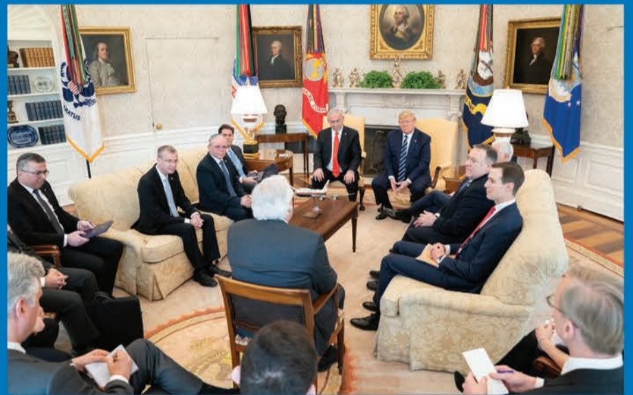
טראמפ ונתניהו עם המשלחת הישראלית בבית הלבן

בעוד מנהיגי העולם שהו בישראל לציון יום השואה הבינלאומי, התפרסמה הידיעה על כוונת נשיא ארה"ב טראמפ לזמן לוושינגטון את נתניהו וגנץ לדון בתוכנית המאה שאמורה להתפרסם • נתניהו קיווה שהנסיעה לוושינגטון תגרום לביטול הדיון במליאת הכנסת להקמת ועדת הכנסת, אבל גנץ, בתרגיל פוליטי משלו החליט להיפגש עם טראמפ ביום שני ולחזור לדיונים במליאה ביום שלישי • בתגובה משך נתניהו את בקשת החסינות והפך את הדיון בכנסת לחסר משמעות | ישראל פריי, עמ' 10