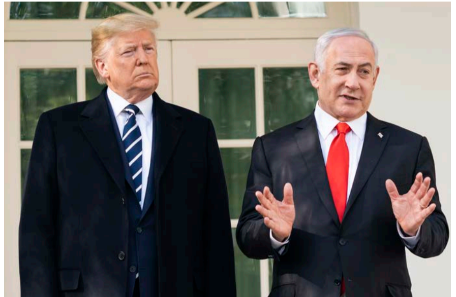
חרב פיפיות. נתניהו וטראמפ, השבוע