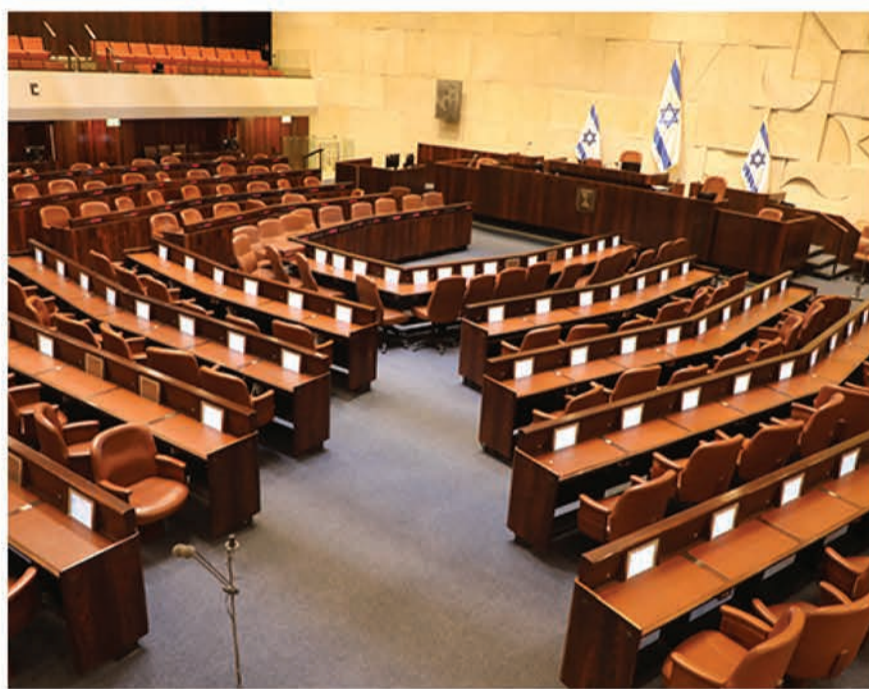
הקואליציה החרימה את הדיונים. מליאת הכנסת

כאשר הבין שהקמת ועדת הכנסת היא עניין של זמן, החליט רה"מ נתניהו למשוך את בקשת החסינות ובכך הפך את הדיון במליאת הכנסת לחסר משמעות • שעות אחדות לאחמ"כ כבר הגיע שליח מטעם הפרקליטות והגיש את כתב האישום לבית המשפט