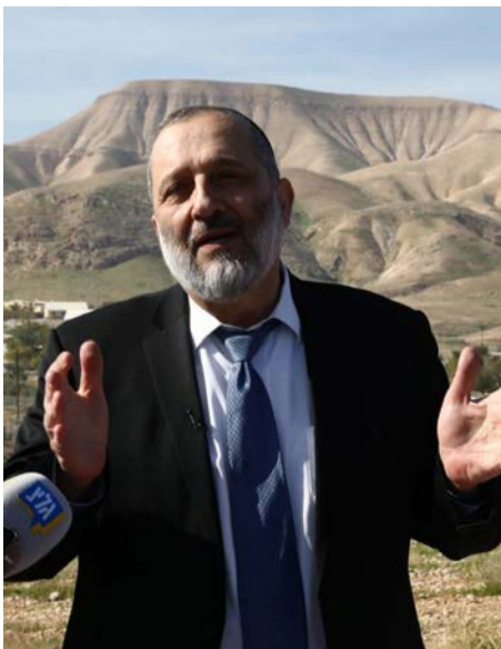
« יו"ר ש"ס השך דרעי בבקעת הירדן »

כשבני גנץ אמר "כחול לבן תפעל למען החלת הריבונות בבקעת הירדן בתיאום עם הקהילה הבינלאומית" הוא למעשה קשר את עצמו בקשר גורדי. מחד הוא דורש הסכמה בינלאומית שלעולם לא תגיע בגלל התנגדות הממלכה בעמאן. בזמן אמת גנץ לא הבין לאן הוא נכנס כשבחר להתייחס לסוגיית סיפוח בקעת הירדן, הוא לא העריך נכון את עומק המלכודת אותה טמנו לו ראש הממשלה בסיוע הנשיא האמריקני טראמפ