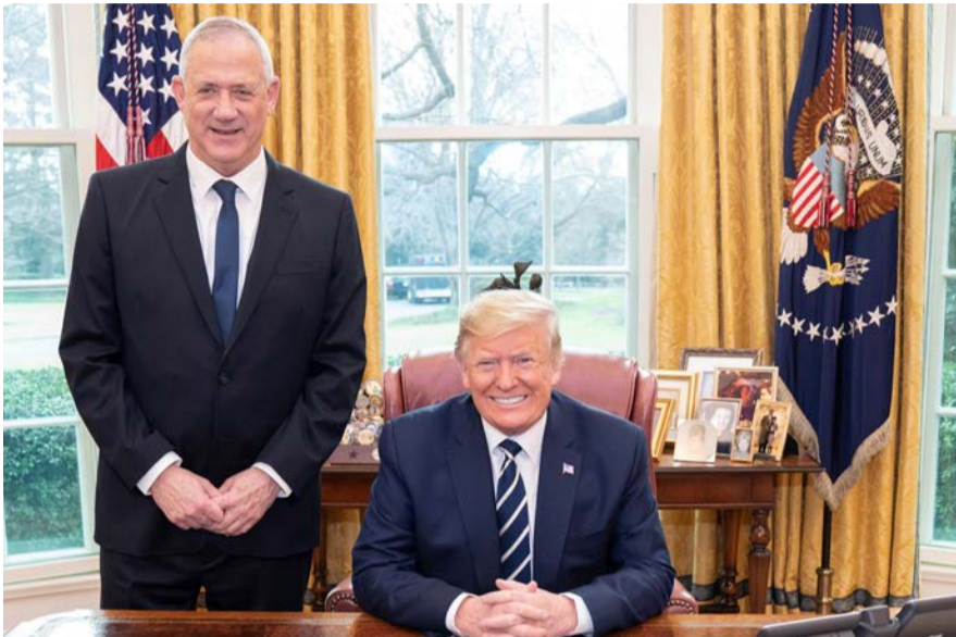
תמונה לקמפיין. גנץ בחדר הסגלגל, השבוע | צילום: הבית הלבן