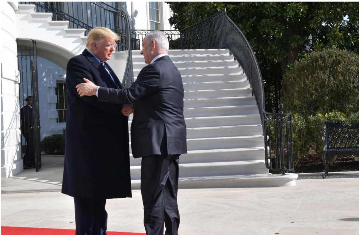
בושינגטון הוא כבר ניצח, נתניהו עם הנשיא האמריקני