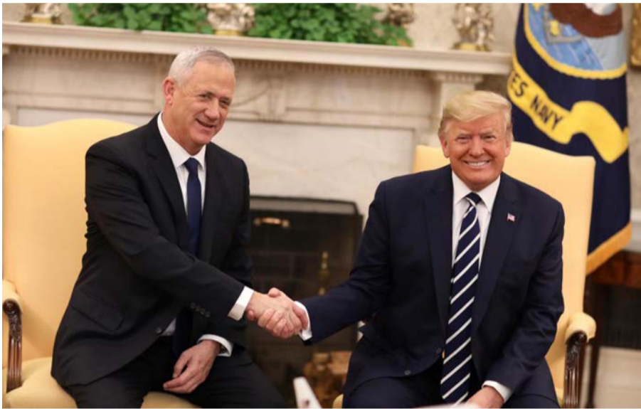
תמונה שהיא הישג. טראמפ עם יו"ר כחול לבן

בעוד מנהיגי העולם שהו בישראל לציון יום השואה הבינלאומי, התפרסמה הידיעה על כוונת נשיא ארה"ב טראמפ לזמן לווינגטון את נתניהו ואת גנץ לרון בתוכנית המאה שאמורה להתפרסם • נתניהו קיווה שהנסיעה לווינגטון תגרום לביטול הדיון במליאת הכנסת להקמת ועדת הכנסת, אבל גנץ, בתרגיל פוליטי משלו החליט להיפגש עם טראמפ ביום שני ולחזור לדיונים במליאה ביום שלישי • בתגובה משך נתניהו את בקשת החסינות והפך את הדיון בכנסת לחסר משמעות