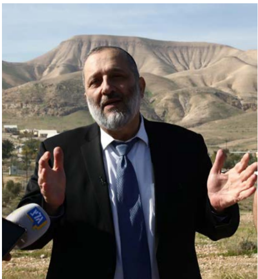
יותר ימין מימינה, דרעי יוצא לגבעות

מי שכבר ספג כתב אישום השבוע, הוא ח"כ דוד ביתן, שלפי