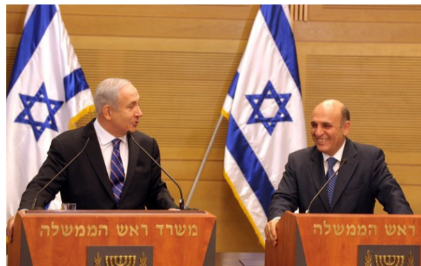
נתניהו ומופז