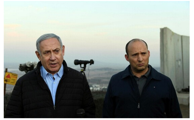
נתניהו ובנט

נתניהו הזניח שוב את חושי החדים ואפשר ליעלון לשמר את מעמדו כשר ביטחון, עד להצטרפותו של ליברמן