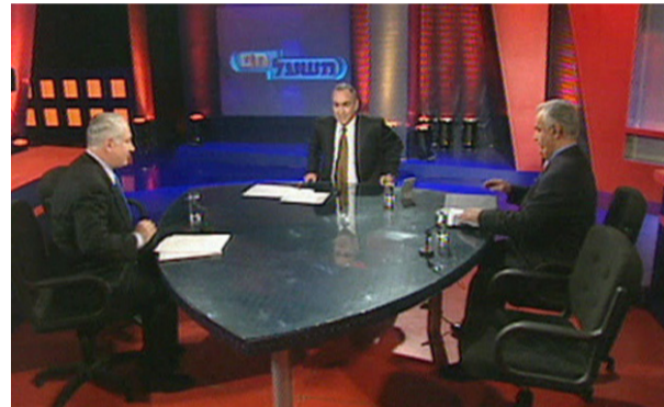
נתניהו בעימות המפורסם מול איציק מרדכי | צילום מסך

למפרע, הבין ליברמן את התרגיל שרקם לו נתניהו, בתזמון הקרוב ביותר שהגיע אי פעם לכניסה לבית בבלפור. מאז יאכיל את נתניהו מרורים, עד להעלאת המסך בפומבי בבחירות האחרונות, עם המלצה לנשיא להטיל את הרכבת הממשלה על גנץ וציטוטים לפיהם "על נתניהו ללכת הביתה".