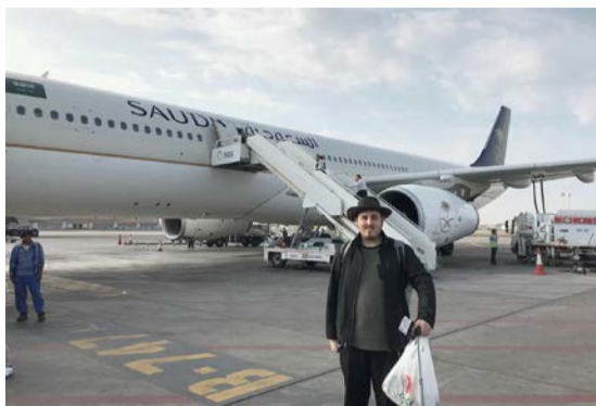
זייאניץ בדרך לסעודיה, ליד מטוס חברת התעופה הסעודית