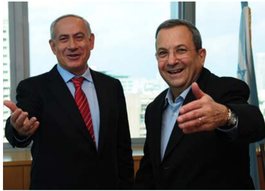
מפקדו ושותפו לשעבר ויריב פוליטי מר כיום נתניהו עם אהוד ברק

ומה יעלה בגורלם בהמשך? האם החזילה לחיקו של נתניהו תסמן עבורם את הסוף כפי שסימנה עבור ברק ומופז? האם יודחו בשלב מסוים באופן משפיל כפי שאירע ללבני ולפיד? שמא ינסו את כוחם בבחירות הבאות ויישלו במודל הרצוג ואיווט? ואולי אולי, לראשונה ימצא נתניהו מולו יריבים במידותיו. ימים יגידו. ■