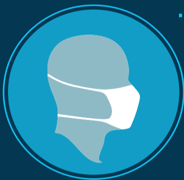
6. חשוב שהמסכה תהיה צמודה לפה ולאף