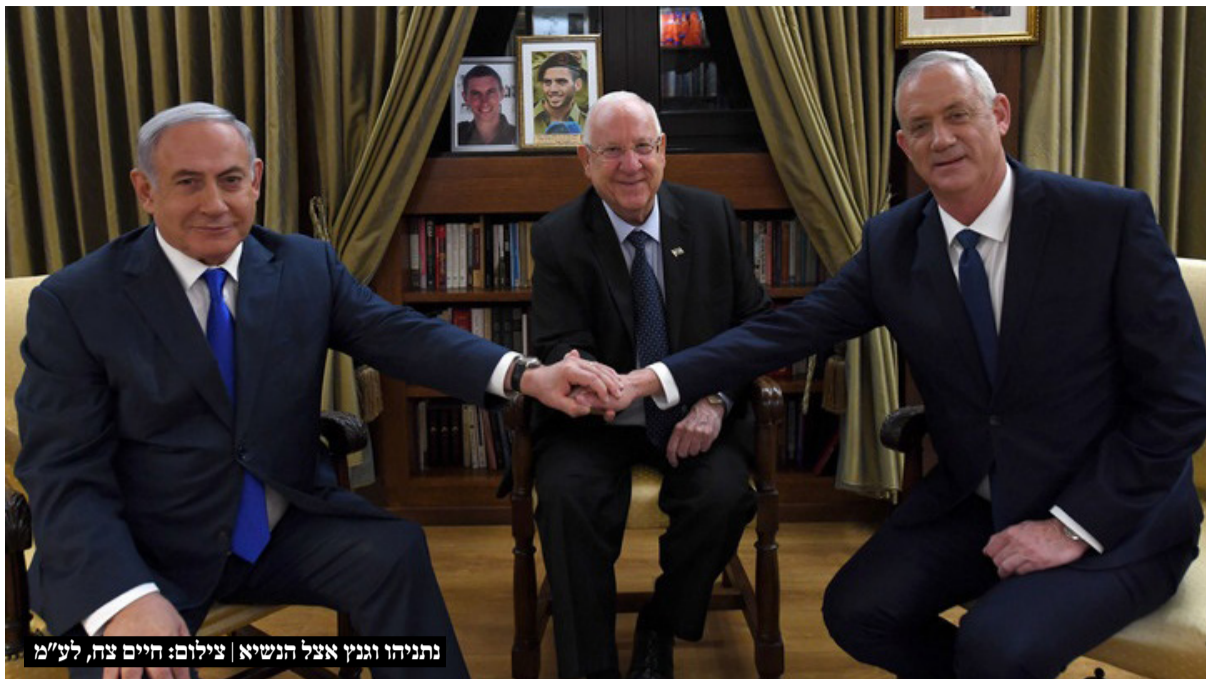
נתניהו וגנץ אצל הנשיא

איציק מרדכי, האלוף הראשון שהגיע לליכוד אחרי שנות בצורת ומחסור ב'ביטחוניסטים' בולטים. מרדכי - נישא על גבי הערצת הליכודניקים - סירב להצעת שריון מביבי, חרש את הארץ וכבש בפריימריז את המקום הראשון ברשימה. בהמשך מינה אותו נתניהו כיו"ר מטה הבחירות של המפלגה ב-96' ולאחר מכן גאתה הפופולאריות שלו כשר ביטחון. נתניהו הבין והפנים שצומח לו בשקט בשקט איום של ממש על הבכורה.