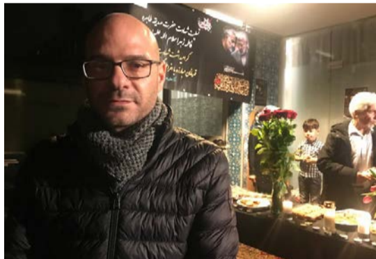
חמו נמסגד בברלין, בטקס לזכרו של קסאם סולימאני