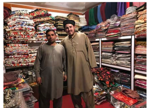
עם סוחר שטיחים אפגני, בכאבול, אפגניסטן

ברגע שקיבלנו אישור להמשיך פנימה, המראה היה לא פחות מקסום. טיילת מדהימה של כמה מאות מטרים הובילה מהקשת בכניסה ועד לכיכר מול המלון. הטיילת כללה שני נתיבים בכל כיוון, מרוצפים בצבעים ובעיצובים מרשימים. משני צידי הטיילת ניצבו גנים מטופחים, הכוללים עצי דקל, פרחים ועמודי תאורה בסגנון מערבי. משהו שמזכיר את השדרה שמובילה למגדל אייפל בפריז, אבל המלון בסעודיה