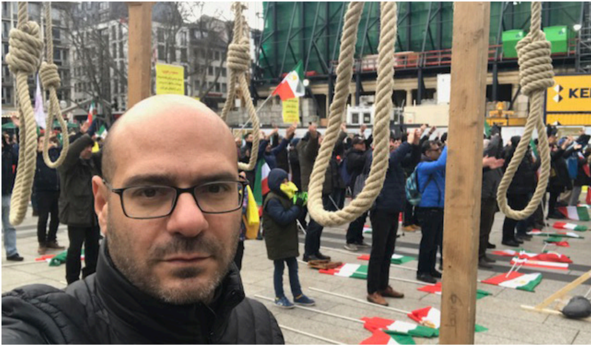
חמו בהפגנה נגד האיראנים בעיר קלן