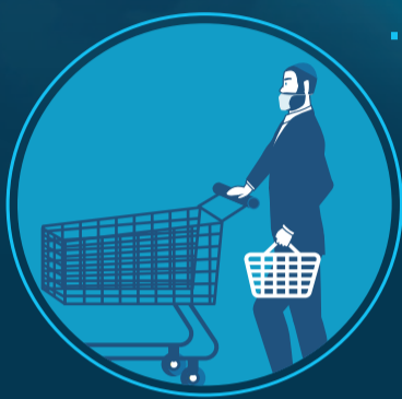
3. במרחב הציבורי ובעבודה חייבים לחבוש מסכת פה ואף, בבית אין צורך