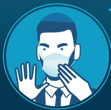
2. מסכת פה ואף מצמצמת את הסיכוי להדביק ולהידבק