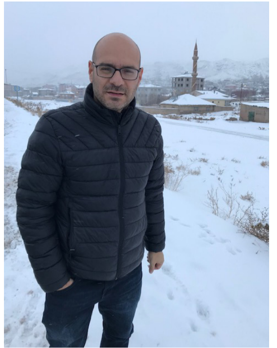
חמו בואן, טורקיה, על גבול איראן

כעת, יותר מאי פעם, סיפרו ואמרו לי שמחסום הפחד של האזרחים שם הולך ונשבר. ה"עובדה היא שהאזרח האיראני כבר מרשה לעצמו, שנה אחר שנה, לצאת ולהפגין. בעבר זה היה אחת לעשור, אם בכלל. וכעת, שנה אחר שנה יוצאים אנשים, מסכנים כל מה שיש להם. הם יודעים שאם הם ייתפסו, במקרה הטוב יעונו, ובמקרה הרע הם עלולים לצאת להורג, ועדיין יוצאים להפגין ושורפים את תמונותיהם של חמינאי וסולימאני וחומייני וכו'. וכשזה המצב, אנחנו מבינים שיש כאן משהו מבפנים שבווער. "זה כבר לא סתם גוף אופוזיציה חיצוני שמנסה לשים טריגר, אלא מדובר על משהו מבפנים, מתוך העם. 82 מיליון אנשים חיים באיראן. עשרות רבות מאד של מיליונים מהם אינם תומכי המשטר בשום צורה. אתה יודע, מדברים על בעבוע שאכן מתרחש שם. האם באיראן כבר בשלים להפיכה? אני לא יודע. אגיד לך, איראן מתנהגת שונה ממשטרים אחרים, כמו למשל מצרים או לוב, שם בסוף השליטים קדאפי ומוברק, לא הלכו עד הסוף. שם, ברגע שהם הבינו שיש פה מרי אזרחי שהם לא יכולים לעמוד מולו, הם לקחו צעד אחורה ועזבו, כמובן בעיקר במקרה של מובראק ומצרים. אבל זה לא המקרה פה. כשהמשטר האיראני חש בסכנה לשלטון, הוא נעמד על רגליים אחוריות ועושה הכל, כולל לטבוח באנשיו הוא – 1,500 הרוגים לפני חודשים, במהומות הגדולות של נובמבר – רק כי הוא חש סכנה לשלטון. ולכן, אולי יש כאן איוושהי משאלת לב ואולי פרשנות נכונה אבל הרבה, מאד אנשים מדברים על כך שאיראן במקום אחר היום".