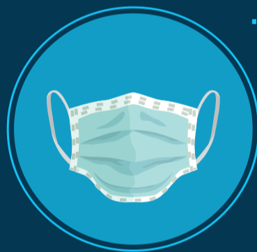
5. למסכה ביתית מומלץ, בד כותנה ארוג בצפיפות ולא נמתח, לדוגמא בד של סדין מסוג פרקל או סאטן מקופל ל-3 שכבות