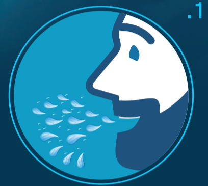
1. נגיף הקורונה עובר בטיפות