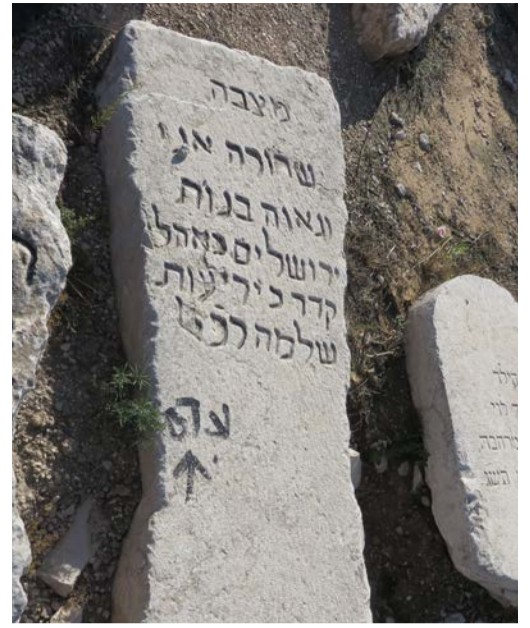
מצבה מעוררת סקרנות