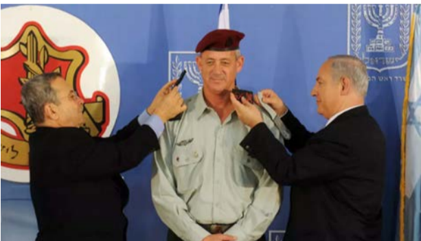
נתניהו כראש ממשלה עם ברק כשר ביטחון בהכתרת גנץ לרמטכ"ל