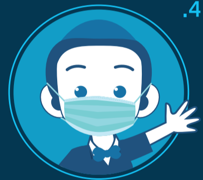
4. סוגי המסכות המומלצות לציבור: מסכה רגילה או מסכה ביתית מבד