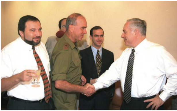
נתניהו עם ליפקין שחק ואביגדור ליברמן

לקואליציה שנה לאחר הבחירות, במאי 2016. הקואליציה סבלה מחוסר יציבות בשל היותה תלויה על חודו של קול ונתנה לחסדי ארון חזן ושות', והיא נזקקה לאמצעות נוספות כאוויר לנשימה. חמישה כאלו הביא ליברמן – אחרי בריחתה של אורלי לוי – והם סיפקו בלון חמצן יעיל, במחיר פשוט, הדחתו של יעלון ממשרד הביטחון. למרות הפיזיו שהוצע לו בדמות משרד החוץ, בחר יעלון לעזוב את הכנסת חדר תחושת נקם מעורבנת, כשהיעד הנוכחי הוא נתניהו. ציניקנים יאמרו שזהו הרגע בו 'נזכר' יעלון גם בפרשת הצוללות, ממנה הוא מסרב להיפרד עד לימים אלו.