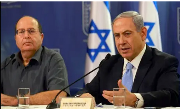
נתניהו ויעלון