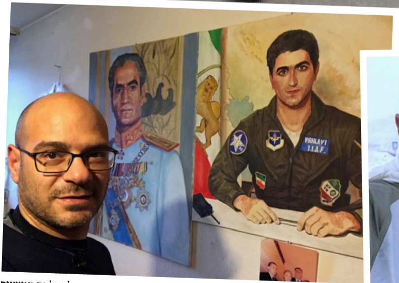
בבית גולים איראנים. תלו את תמונות השאה, ממתנינים להחלפת המשטר