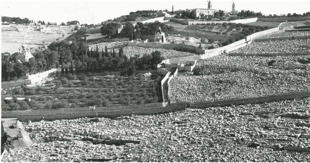
תמונה של הר הזיתים בעת ההרס של הירדנים