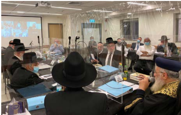
ישיבת מועצת הרבנות הראשית השבוע

נשיא מועצת הרבנות הראשית, הראשון לציון הרב הראשי לישראל הרב יצחק יוסף בירך את השר הרב יעקב אביטן שיצליח בתפקידו כשר לשירותי דת ושיבא את פעולותיו הברוכות בפעילותו לשמירת מעמדה של הרבנות הראשית והרבנים בישראל. הרב קרא לשר לפעול ולמנות רבני ערים בכל הערים בהם עדיין לא מכהן רב עיר. השר בדבריו הודה לראשון לציון וברך את הרבנים חברי מועצת הרבנות הראשית על פעילותם המסורה למען עולם התורה והבטיח לרבנים כי בתפקידו הוא יפעל ככל שביכולתו לשמור על מעמד הרבנים והרבנות בישראל. במהלך הישיבה מינתה המועצה מספר