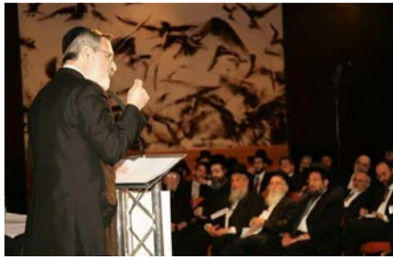
הגר' זקס נושא דברים

הגאון רבי פנחס גולדשמידט, נשיא הוועידה ורבה של מוסקבה אמר עם הסתלקותו של הגר' זקס: "הרב זאקס היה דובריה הרהוט ביותר של יהדות אירופה שייצג את עם ישראל לגאון ותפארת בפני עמי תבל. הרב זאקס שקיבל את האצולה מאת מלכת אנגליה נודע בספריו הרבים על בעיות השעה שבו שזר את השקפת התורה מול פילוסופיות העולם הגדול, והגותו ופירושו הפכו לנחלת העם כולו".