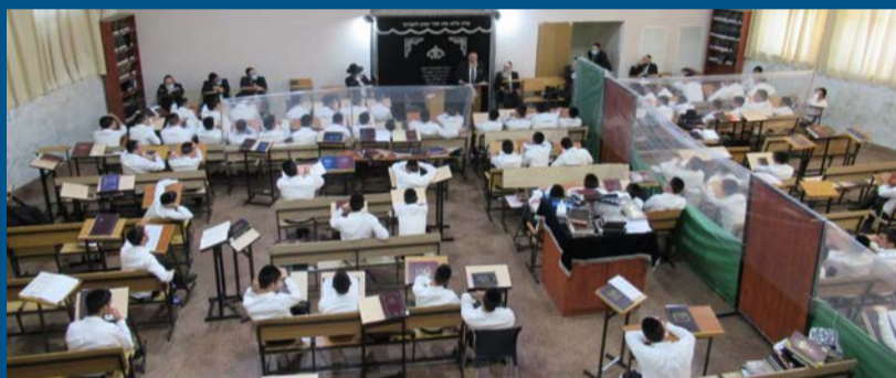
תחלואה אפסית. קפסולה בישיבת 'תפארת לוי' באלעד | תמונת אילוסטרציה

האלוף במיל' רוני נומה, ראש דסק החרדים: "לא על הפרק לסגור את הישיבות. רמת התחלואה שם היא נמוכה, פחות מאחוז" • על פתיחת הת"תים: "הנתונים שם יותר אופטימיים ממה שחשבנו" | עמ' 8