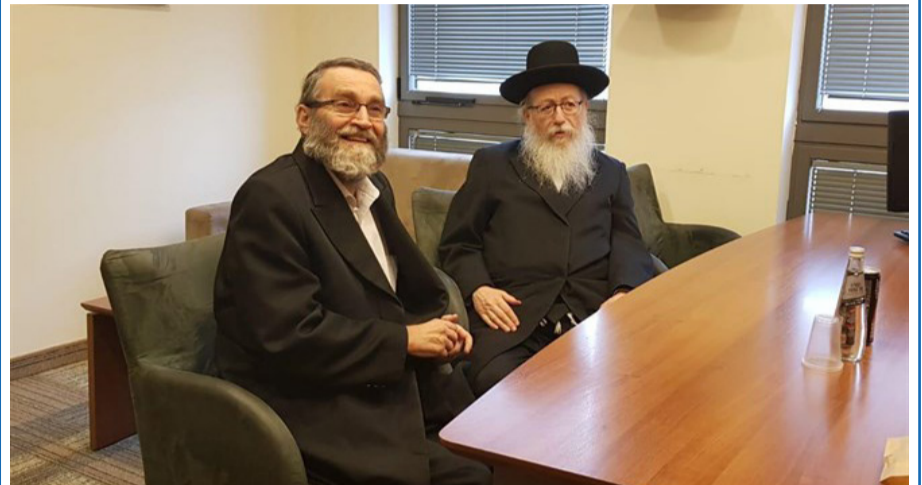
הפגישה עם רה"מ הרגיעה את הרוחות. ליצמן וגפני

לאחר פגישה של גפני וליצמן עם נתניהו ולאחר שהוקפאה ההצעה להגדיל את הקנסות על מוסדות החינוך - יהדות התורה הודיעה כי היא מאמצת את המשמעת הקואליציונית, ותחדש התיאום בין הסיעה לממשלה