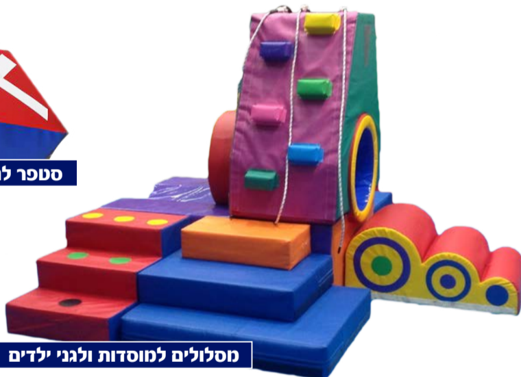
מסלולים למוסדות ולגני ילדים