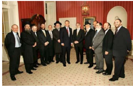
במפגש עם ראש ממשלת בריטניה דאז טוני בלייר

"בנאומיו ובשיעורים שלו, אביכם הביא את המסר הזה של הרבי, ההנעה לעשייה, לפעולה,