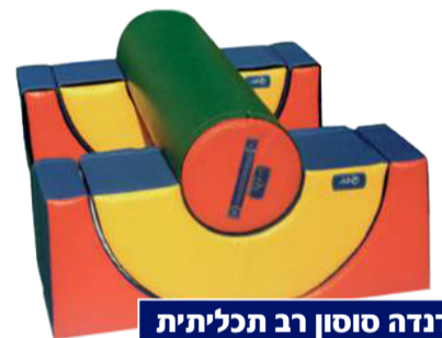
נדנדה סוסון רב תכליתית