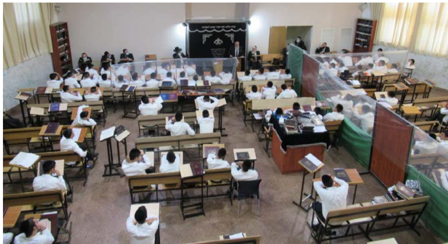
תחלואה אפסית. קפסולה בישיבת 'תפארת לוי' באלעד | תמונת אילוסטרציה

מבעבר, והנתונים יותר אופטימיים משחשבו. לא כל תלמודי התורה נפתחו בבת אחת. יש פה מהלך שבאופן טבעי היה מדורג. לכן צריך להיזהר מהמסקנות. יש פה משהו שבועוד שבועיים כשנסתכל על הדברים, נראה שיש פה משהו שהצליח להביא שינוי יותר ממה שחשבנו. הנתונים שם יותר אופטימיים ממה שחשבנו, אך נדרש זמן כדי להסיק מסקנות". נומה הבהיר כי בימים האחרונים נעצרה הירידה בתחלואה במספר מקומות במגזר החרדי. "יש הפנמה של חלק מהדברים. לצערי שבועיים האחרונים יש שאננות, אולי זה תורם לבלימת הירידה. חלק מהירידה בנתונים זה בגלל נושא הבדיקות שמאוד מעסיק אותנו". נומה התייחס לטענה לפיה הירידה בתחלואה בציבור החרדי מקורה בהפסקת חלקים גדולים מתוכו ללכת להיבדק. "אני שומע את הרמזים. אי אפשר להסתיר את התחלואה במגזר החרדי, בציבור של מיליון ורבע איש, אי אפשר להסתיר את התחלואה. יש ירידה גם במספר הנפטרים והחולים הקשים. רוב הציבור החרדי הקשיב להוראות ושמר על הכללים". עם זאת הבהיר: "אנחנו לא במצב של חיסון עדר במגזר החרדי, אך ללא ספק הנתון של 11 אלף מחלימים בעולם הישיבות תורם לעצור את שרשרת ההדבקה".