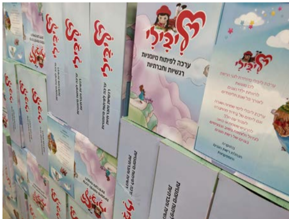
ערכת ליבילי שחולקה לילדי הגנים

משקה חם או קר בהתאם להעדפת הילד וכדומה. ה ק ל ט ה ס י פ ו ר י ם למרחב הקולי של רשת הגנים, מאפשרת את המשך הקשר הילדי עם הבובה ליבילי, גם במקרים בהם כל ילדי הגן או חלק מהם ייאלצו להיכנס לבידוד ולהפסיק את מסגרת הלימודים השוטפת, במקרה של הידבקות בקורונה או חלילה סגר כללי. כך הילדים יוכלו להמשיך להתחבר להווי הגן גם בשינוי השגרה, כי הם זוכרים את הבובה