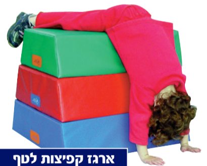
ארגז קפיצות לטרף

מחפשים מוצרים דומים? מחפשים לגילאים גדולים יותר?