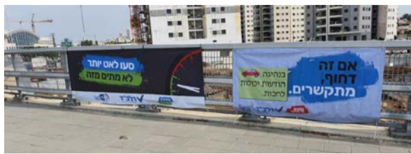
שלטי זהירות בדרכים ברחובות

ירידה במספר תאונות הדרכים בעיר לעומת השנים קודמות. בעיריית רחובות פועל באופן קבוע המטה העירוני לבטיחות בדרכים, שמנהל אייל לוי, במסגרת אגף הביטחון, בטיחות, חירום, תקשורת ומוקד עירוני. ברחובות, כמו בכל הארץ, מציינים את שבוע הבטיחות בפעילות הקמפיין העירוני לציון השבוע שנועד להעלות מודעות כדי להציל חיים. בשל מגבלות הקורונה הפעילות מתבצעת בעיקר באופן מקוון – במוסדות החינוך יזמו רכזי זה"ב שיעורי הדרכה לילדים ולנערים על כללי ההתנהגות כהולכי רגל, רכיבה בטוחה באופניים וחגירת חגורות בטיחות במושב הרכב במהלך הנסיעה. שילוט חוצות עלה ברחבי העיר, פרסום בעיתונים ובמדיה הדיגיטלית וגם ברשתות החברתיות. בנוסף, מתקיימות פגישות מקצועיות בהן מציג המטה העירוני את מצב הבטיחות בדרכים בעיר ותכניות עתידיות לקידום התשתיות בעיר. ראש העיר, רחמים מלול קורא לכל תושבי רחובות לנהוג