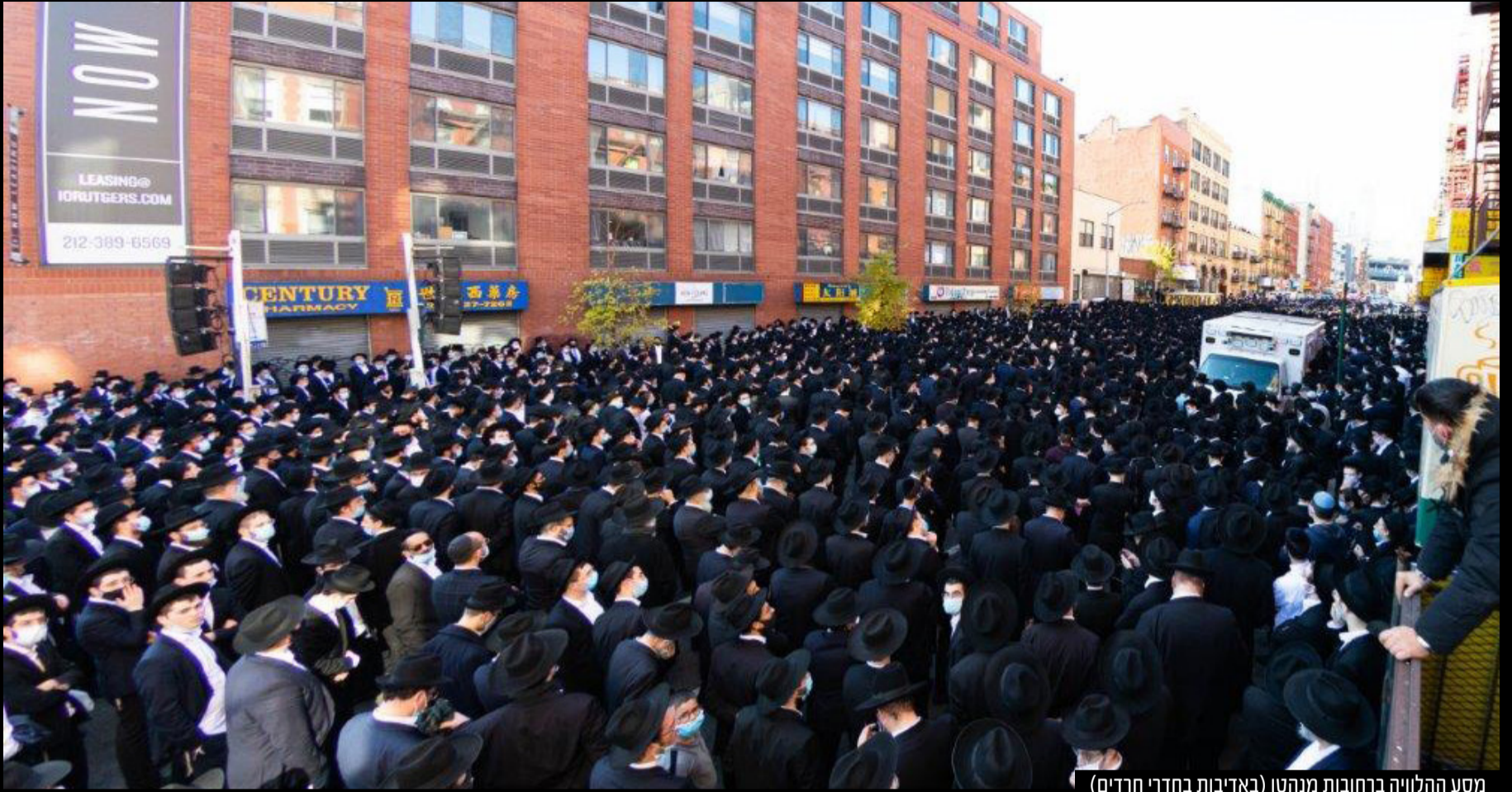
מסע ההלוויה ברחובות מנהטן

מסקנותיהן, ודברי הראשונים והאחרונים היו שגורים על שפתי באופן חד וברור בצורה מופלאה כשהוא מפגין בקיאות נדירה ומופלגת של גדול בישראל שכל רז בש"ס ופוסקים לא אניס ליה כשהוא עצמו התנהל באותה צורה בפסיקותיו כמו אביו פוסק הדור זצוק"ל.