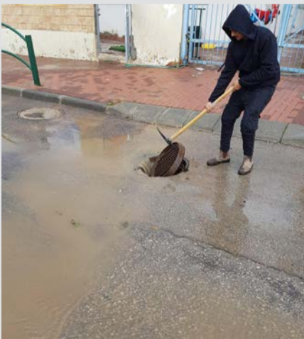
תיקון ביוב ע"י עובד עירייה

בין היתר פעלו העובדים בכל רחבי העיר בהשבת מכסי ביוב שזזו - למקומם, שאיבת מוקדי מים באמצעות ביובית,