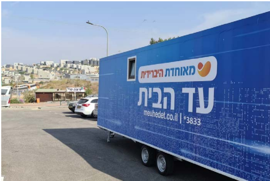
הניידת היברידית של מאוחדת לחיסונים נגד שפעת