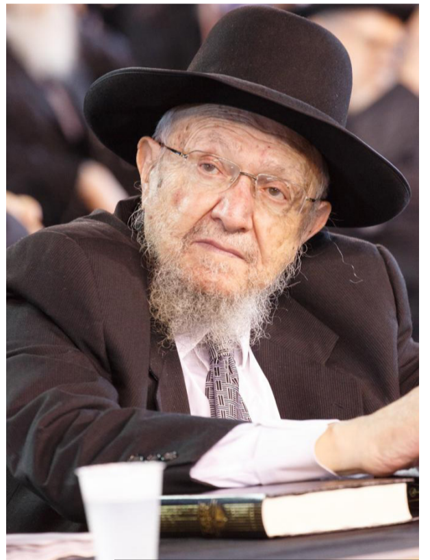
הגר"ד פיינשטיין זצוק"ל

בהיותו במוסקבה שהה עם המשפחה בדירה שהיתה שייכת לאחד מקרובי אמו ממשפחת דוידוביץ' ולא בכתובת הרשמית