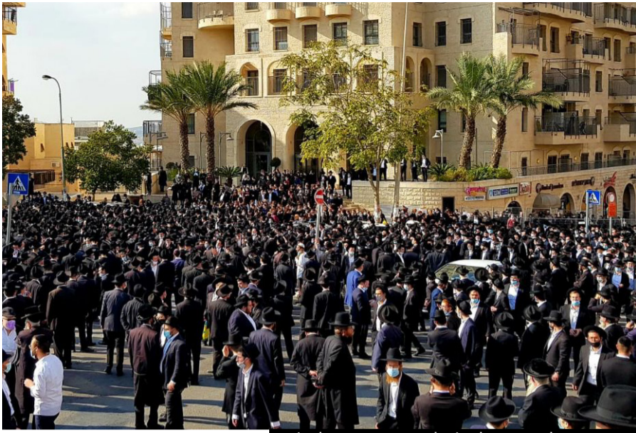
מסע ההלוויה בירושלים