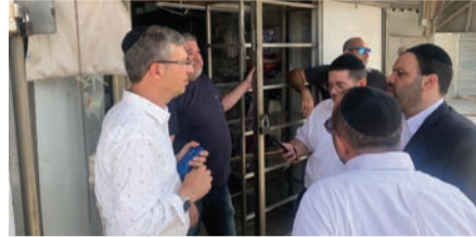
במהומות - ח"כ אזולאי בשטח