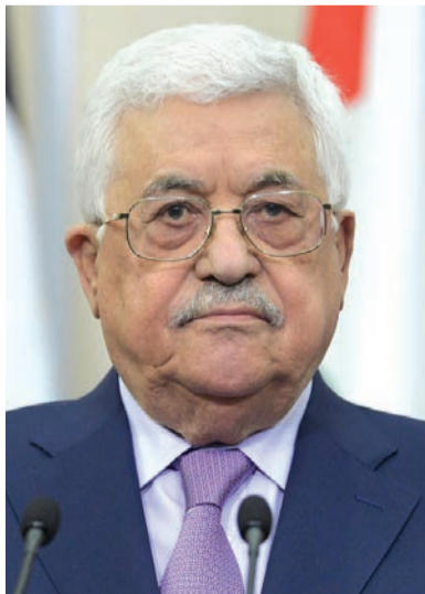
« גם בגיל 85 הוא מסרב לצאת לפנסיה. אבו מאזן

ציניקנים יאמרו שחמאס עובד בשירות נתניהו, שלא יכול היה לתסרט את האירועים טוב יותר עבורו. ביום ראשון בערב עוד נשמעו בליכוד דיבורים שקטים על החלפת המנהיג ואפילו מכתבם של פרוש ואייכלר שקרא תגר על מנהיגותו של ראה"מ יצר מומנטום של כותרות בנוסח 'היום שאחרי'. עשרים וארבע שעות חלפו והוא שוב על הגלגל, מתכנס בקריה לדין ביטחוני בהול - אחרי נאום עוקצני במיוחד למחליפיו הפוטנציאליים