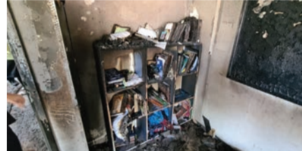
במהומות - תלמוד תורה שהוצת