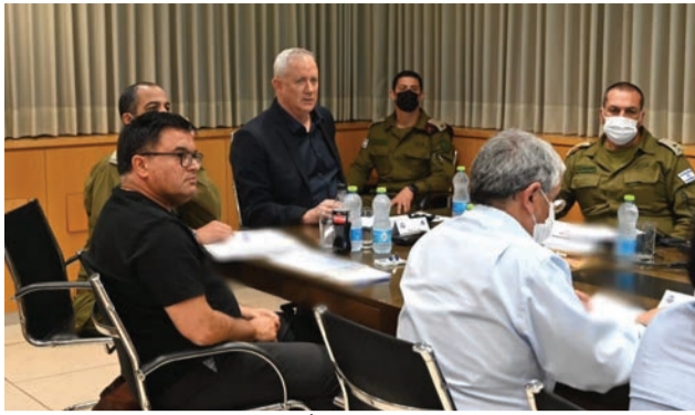
ראמ"מ החליפי ושר הביטחון בני גנץ בהערכת