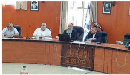
בישיבת ההערכות עם פקע"ר

עריית בני ברק קיימה דיוני הערכות ומוכנות - כחלק ממוכנות העיר לשעת חירום