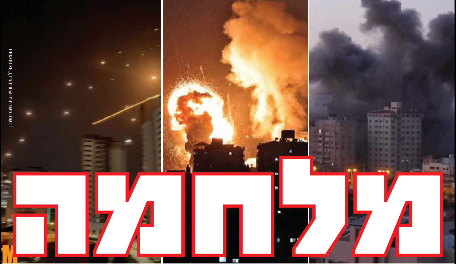
הפצצות צה"ל בעזה והיריטים בשמי גוש דן