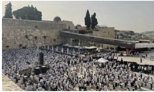
תפילות יום ירושלים ברחבת הכותל המערבי