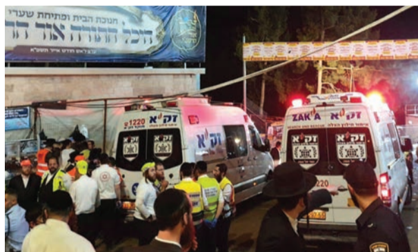
זירת האסון במירון

היו אלה שעות אימה קשות לאין שיעור. כאשר אבהלה והיקף האסון ניכרו היטב בשטח, רסיסי המידע והעדויות הפכו למציאות שחורה של אובדן פתאומי, תהליכי זיהוי מורכבים ולחץ