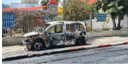
במהומות בלוד