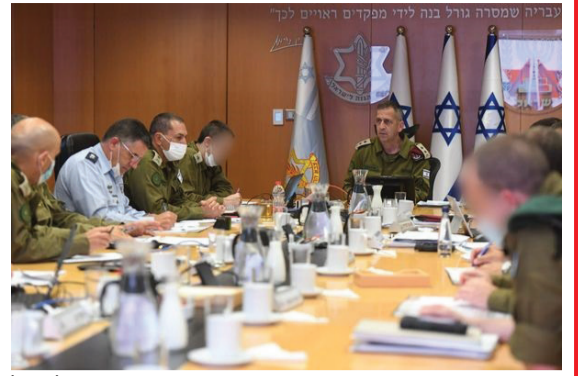
הערכת מצב בפיקוד דרום של צה"ל