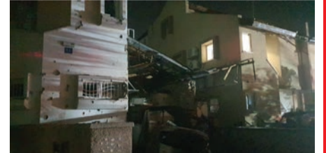
פגיעה ישירה בבית בראשל"צ