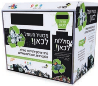
מתקן מיחזור לפסולת אלקטרונית

על "יום חשמלי". מדי שבוע בימי רביעי (או בפתיחת קריאה יזומה) תוכל כל משפחה להוציא למדרכה הסמוכה לביתה את מכשירי החשמל והאלקטרוניקה שהתקלקלו, ורכב איסוף מיוחד יגיע וייקח את המוצרים למיחזור אלקטרוני, וכל זאת ללא עלות לתושב. מדובר בפתרון נוח לתושבים להעברת פסולת חשמלית גדולה