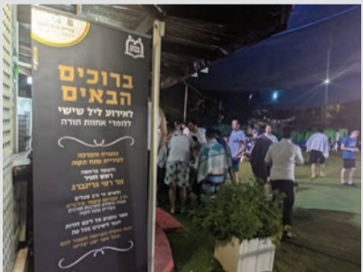
אירוע אחוות תורה הרגילים ללא הגבלות, וגם משום שהוכחתם שהלימוד הזה חשוב לכם יותר מכל התמריצים הקבועים של 'אחוות תורה' ואירועי הגיבוש המיוחדים שהיו נחלת הארגון בעבר."

כ-150 לומדים ברשת הקהילתית תורנית 'אחוות תורה' השתתפו בסוף השבוע שעבר באירוע גיבוש מיוחד בחסות עיריית פתח תקווה. הגיבוש המיוחד הופק ביוזמת מחלקת האירועים של 'אחוות תורה' כהמשך ישיר לתנופת הפיתוח והעשייה החברתית, לעידוד חינוך ושימור בשלהי זמן בסימן קיץ, חזרה לשגרה מלאה.