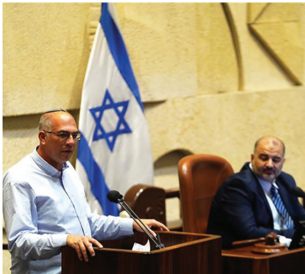
« מתנדנד למראית עין, ח"כ ניר אורבך

המבט שלנו צריך להיות מופנה פנימה, לאלו מתוכנו שהתלוננו על התחבורה הציבורית בשושן פורים וכעת יתמודדו עם תחבורה ציבורית בשבת. אותם שזעקו נגד סגירת תלמודי התורה בימי הקורונה וכעת יקבלו לימודי ליבה בכפיה בתלמודי התורה. אותם שמחו על איזו הקצאה או תקציב שלא מצא חן בעיניהם, וכעת ישכחו לחלוטין מתקצוב ממשלתי, אלא אם ליברמן יזרוק איזו עצם למריצה... כל אחד ואחד מאלו שלא הצביעו – יהיה התירוץ שלו אשר יהיה – הוא אחראי ישיר ועקיף לכל מה שתחולל כאן הממשלה הבעל"ר