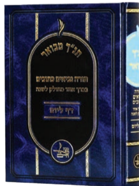
תנ"ך מבואר ומחולק לפי דף ליום

'תנ"ך דף ליום' מכנס את כל כ"ד ספרי הקודש לספר אחד, מוסיף ביאור משולב, מדויק ומתומצת ששופך אור חדש ובהירות מדהימה, מחלק הכול להספק שווה לכל נפש ודורש לימוד יומי בן 10 דקות בסך הכול עד לסיום השלם. "כבר בראשונים מובא שיש ללמוד תנ"ך בכל יום, וכעת זה אפשרי מתמיד, בטווח זמן שמתאים לכולם ותוך ביאור שמפשט את הלימוד הרציף, ללא עצירות שנגרמות בשל קושי בהבנה", אומר הרב כהן.