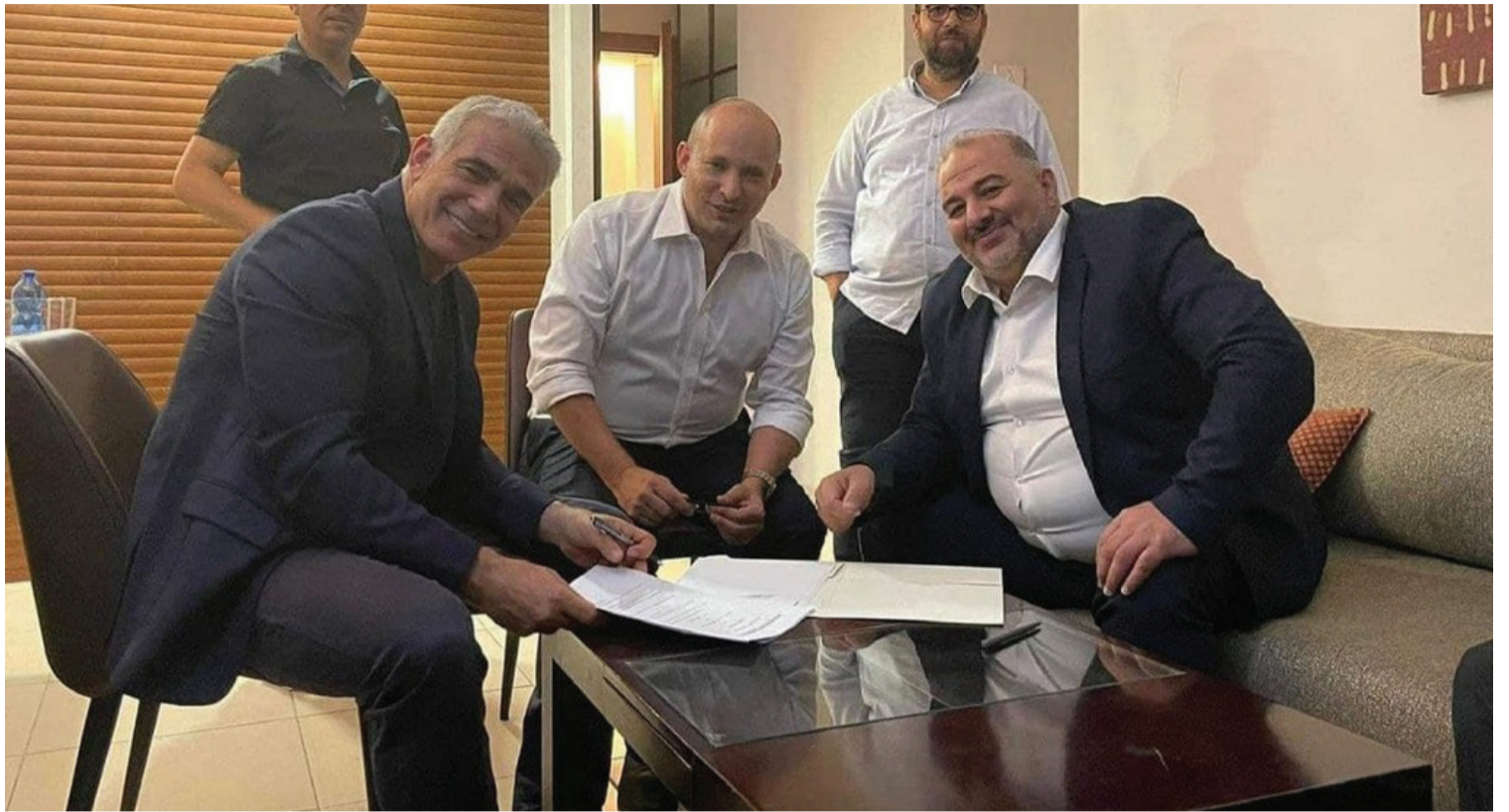
ריפוי ושיסוי. ראשי הממשלה המיועדת ברגעי הסגירה

שיחות שכנוע ממושכות עם חברי כנסת, כולל מהסיעות החרדיות.