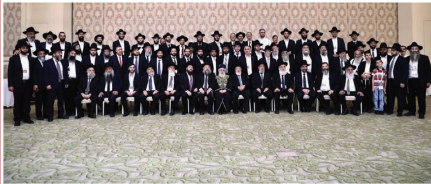
במעמד הכתרת רב העדה הבוכרית

במעמד רבנים ואישי ציבור מאות מרבני ומנהיגי העדה הבוכרית התכנסו ליום עיון במלון המפואר וולדורף אסטוריה בירושלים • במהלך הכינוס הוכתרו רבנים חדשים