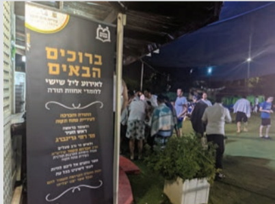
אירוע אחוות תורה הרגילים ללא הגבלות, וגם משום שהוכחתם שהלימוד הזה חשוב לכם יותר מכל התמריצים הקבועים של 'אחוות תורה' ואירועי הגיבוש המיוחדים שהיו נחלת הארגון בעבר."