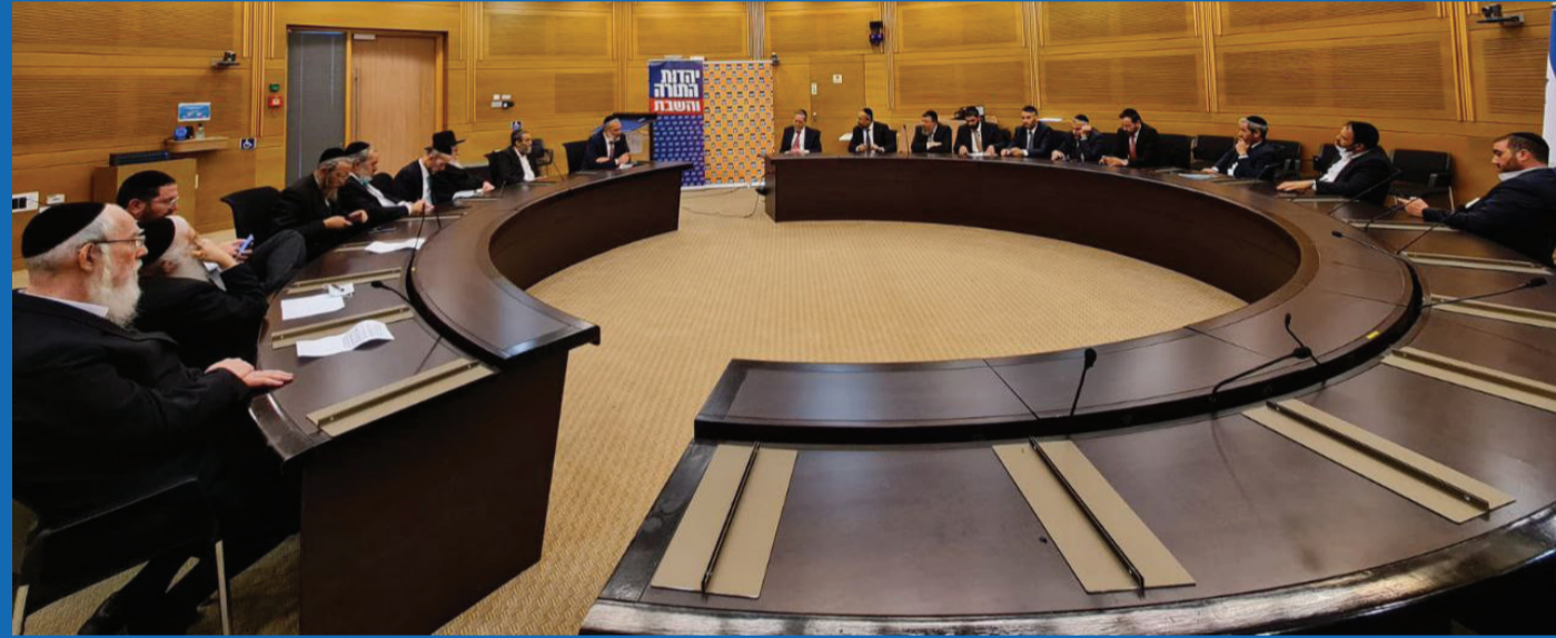
ישיבת החירום המשותפת של ש"ס ויהדות התורה

ההסכמים הקואליציוניים חושפים: חובת לימודי ליבה, העברת חוק הגיוס, החזרת מתווה הכותל, הקמת אגף רפורמי במשרד התפוצות, הכרה בגיורים רפורמיים, ביטול חוק המרכולים, קידום ברית הזוגיות, קידום נישואין אזרחיים, רפורמה בכשרות, קידום תחבורה ציבורית בשבת וזה עוד לא הכל • רה"מ המיועד נפתלי בנט מבטיח: "לימינה יש זכות וטו, לא תהיה פגיעה בסטטוס קוו" | עמ' 13