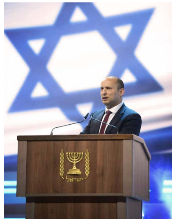
נפתלי בנט נושא דברים