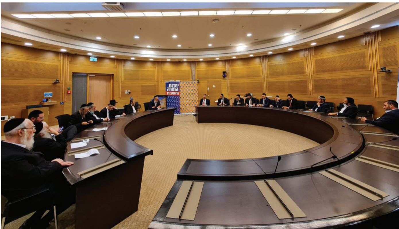
ישיבת החירום המשותפת של ש"ס ויהדות התורה

השר דרעי המשיך בדבריו: "במשך הרבה מאד שנים ובמיוחד בשנים האחרונות נבנתה שותפות אמת בין הציבור החרדי לציבור הדתי לאומי והתורני סביב ערכים משותפים של אהבת ארץ ישראל, חיזוק ההתיישבות ביהודה ושומרון והשמירה על זהותה היהודית של מדינת ישראל על שמירת עולם התורה יבנה וחכמיה. אני קורא למנהיגי הציבור הדתי לאומי, לרבנים וראשי הישיבות לאנשים ההגונים שהצביעו לימינה בבחירות האחרונות: תשמיעו קול, בואו נפעל וניאבק יחד בהקמת הממשלה הרעה הזו וכך