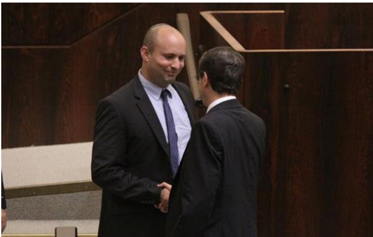
ה"מ המיועד עם הנשיא המיועד במליאה

בנאומו הראשון מאז הכריז לפיד שעלה בידיו להרכיב ממשלה הרבה בנט לעקוץ את נתניהו: "המשטר במדינת ישראל אינו מלוכני. לאף אחד אין מונופול על השלטון", אמר והוסיף: "אני קורא מכאן למר נתניהו: תרפה. תשחרר את המדינה להמשיך הלאה" • בסיום דבריו קרא לנתניהו: "אל תותיר אחרך אדמה חרוכה. כולנו, כל העם, רוצים לזכור את הטוב שהבאת בעת שירותך, ולא חלילה רוח רעה שתותיר עם פרידתך. אני מבחינתי, אמשיך לנהוג כך בכבוד"