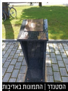
הסטנדר