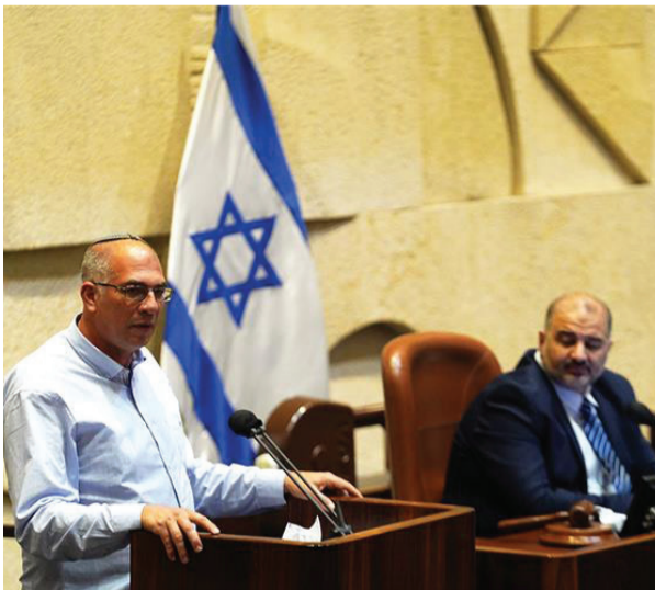
« מתנדנד למראית עין, ח"כ ניר אורבך

המבט שלנו צריך להיות מופנה פנימה, לאלו מתוכנו שהתלוננו על התחבורה הציבורית בשושן פורים וכעת יתמודדו עם תחבורה ציבורית בשבת. אותם שזעקו נגד סגירת תלמודי התורה בימי הקורונה וכעת יקבלו לימודי ליבה בכפיה בתלמודי התורה. אותם שמחו על איזו הקצאה או תקציב שלא מצא חן בעיניהם, וכעת ישכחו לחלוטין מתקצוב ממשלתי, אלא אם ליברמן יזרוק איזו עצם למריצה... כל אחד ואחד מאלו שלא הצביעו – יהיה התירוץ שלו אשר יהיה – הוא אחראי ישיר ועקיף לכל מה שתחולל כאן הממשלה הבעל"ר