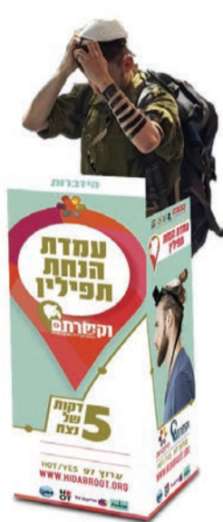
עמדת להנחת תפילין של 'הידברות'

רכישת הציוד, ותחזוקת הפרויקט לאורך זמן. זו הזדמנות עבור נדיבי לקחת חלק במהלך חשוב זה ולזכות באלפי רבבות הנחות תפילין, ברכות ורגעי רוממות וקשר בין יהודים רחוקים לאביהם שבשמיים. "בנוסף לתמיכה ותרומה במבצע 'וקשרתם' לעילוי נשמת יקיריכם, אנו קוראים למי שיש ברשותו זוג תפילין שלא נמצאים בשימוש להעבירם אלינו, במקרה הצורך נבדוק את התפילין ונתקן אותם, במטרה להציב אותם באחת מעמדות 'וקשרתם' ולזכות יהודים בהנחת תפילין מדי יום יום ביומו", אומרים באגף הלוגיסטי של הידברות.