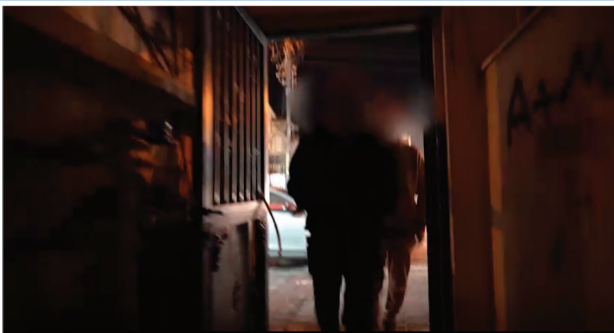
מתוך סרטון החילוץ של "יד לאחים"

חלק לא מבוטל מהפניות כולל דאגה של ממש לילדים הנחשפים לראשונה לאיומים וגידופים ישירים כלפי העם היהודי ואמם מולידתם הפניות כולן מטופלות בידי הצוותים המקצועיים של יד לאחים המונים עובדות סוציאליות, צוותי ביטחון שמנהלים את החילוץ, עורכי דין שמלווים את המאבק על משמורת הילדים ואנשי חינוך ורווחה הממשיכים ללוות את האימהות וילדיהן בדרכן החדשה והסלולה