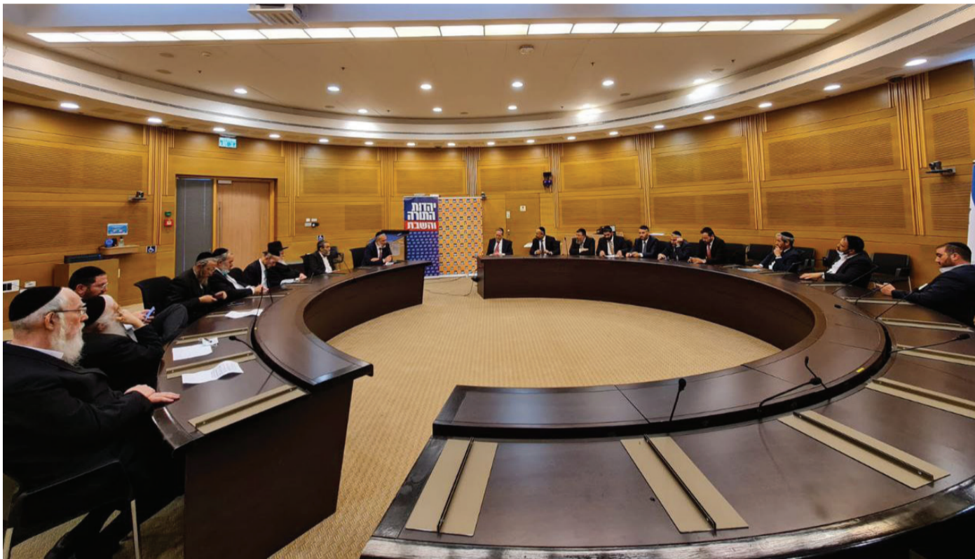
ישיבת החירום המשותפת של ש"ס ויהדות התורה

השר דרעי המשיך בדבריו: "במשך הרבה מאד שנים ובמיוחד בשנים האחרונות נבנתה שותפות אמת בין הציבור החרדי לציבור הדתי לאומי והתורני סביב ערכים משותפים של אהבת ארץ ישראל, חיזוק ההתיישבות ביהודה ושומרון והשמירה על זהותה היהודית של מדינת ישראל על שמירת עולם התורה יבנה וחכמיה. אני קורא למנהיגי הציבור הדתי לאומי, לרבנים וראשי הישיבות לאנשים ההגונים שהצביעו לימינה בבחירות האחרונות: תשמיעו קול, בואו נפעל וניאבק יחד בהקמת הממשלה הרעה הזו וכך