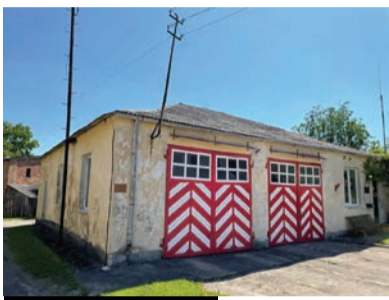
מבני הכנסת ששרדו בביירה