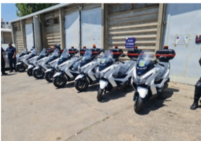
אופנועי השיטור החדשים