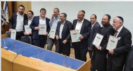
בחלוקת תעודות ההוקרה בכנסת