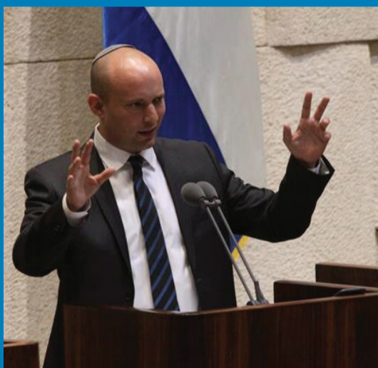
ראשי הממשלה הבאים: נפתלי בנט ויאיר לפיד

כפי הנראה ראשי מפלגות יש עתיד, ימינה, ישראל ביתנו, תקווה חדשה, העבודה, מרצ, כחול לבן ורע"ם הגיעו לסיכומים באשר להקמת ממשלה חדשה • לפיד הבטיח ממשלה צרה של 18 שרים אבל הממשלה החדשה, שככל הנראה תושבע ככל הנראה בשבוע הבא, תמנה 26 שרים • וזו לא הפרת הבחירות היחידה של חברי הממשלה החדשה | עמ' 10-12