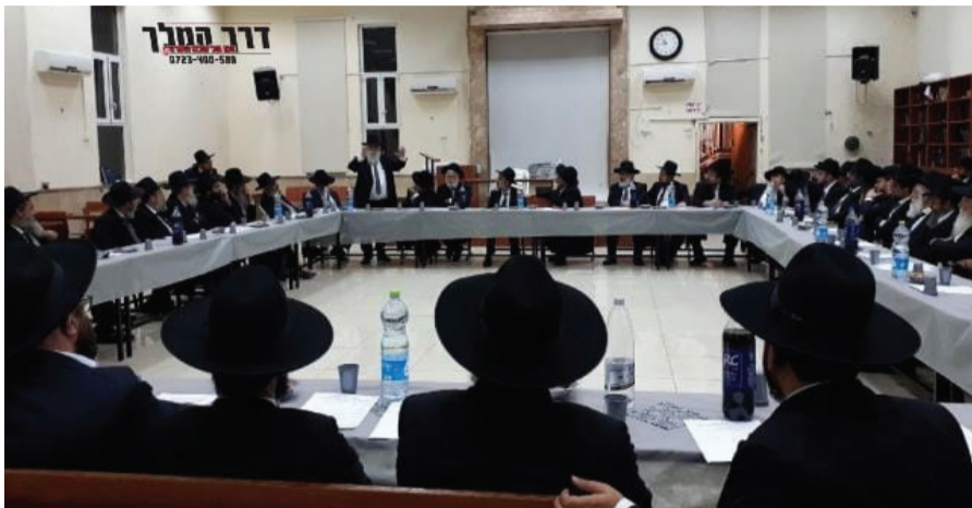
כינוס ראשי הישיבות הקטנות הספרדיות

בברכת גדולי ישראל, נועדו השבוע ראשי הישיבות הקטנות הספרדיות וקבעו כי תאריך המבחנים יהיה י"ח תמוז • איזו ישיבה חדשה נפתחת השנה ומה חדש בעולם הישיבות לקראת רישום תשפ"ב?