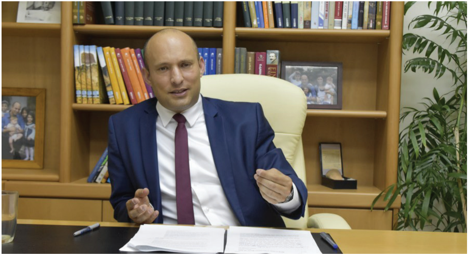
ראש הממשלה המיועד בראיון חג בעבר לכותב השורות

בו יכהן במשך שבע השנים הבאות, ובמסגרתו יוכל להטיל את הרכבת הממשלה אם וכאשר יהיה בכך צורך (ומן הסתם יהיה) וגם להעניק חנינות, לארח אירועים ולטייל בעולם כמנהג נשיאים חסרי תפקיד ממשי מקדמת דנא.