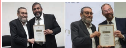
בחלוקת תעודות ההוקרה

היא נוגעת לשירות הרפואי של מכבי ביישובים השונים, במלוניות הקורונה ובכלל הקשר למערך בדיקות הקורונה בשלב הראשון והחיסונים בשלב המתקדם יותר.