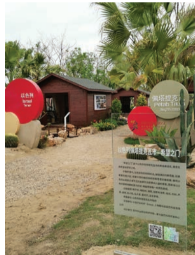
בית הדפוס ההיסטורי בתערוכה

עיריית שנחאי. במתחם הישראלי בתערוכה הוקמו 5 ביתנים, אשר נבנו כדוגמת בית הדפוס ההיסטורי הקיים בפ"ת, כאשר בכל ביתן נבחר עץ או שיח המשקף את האזור בו הוא גדל בארץ: ענבים (צפון הארץ), זיתים (צפון - מרכז), תפוזים (מרכז - פ"ת),