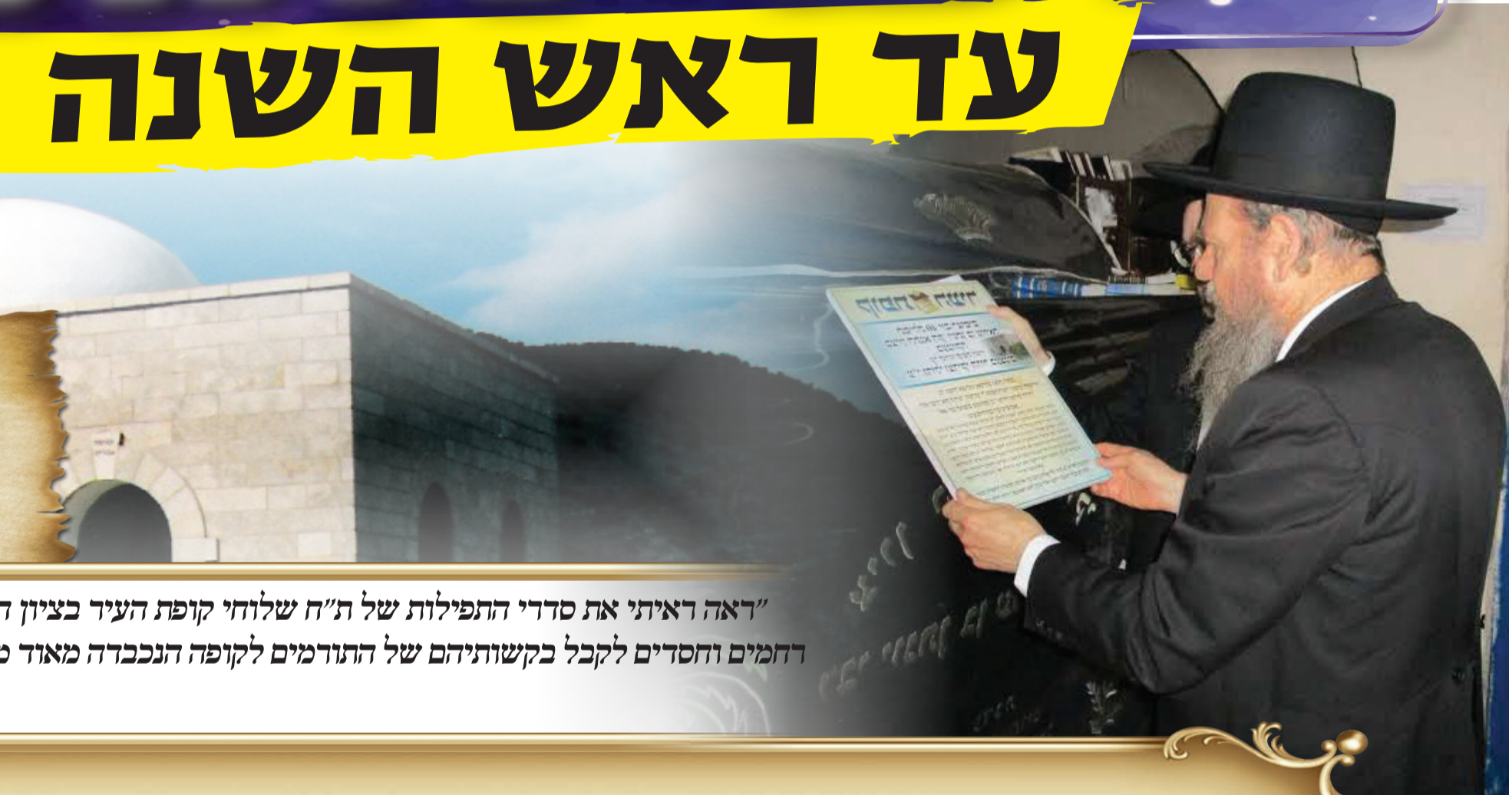
"דאה ראיתי את סדרי התפילות של ת"ח שלוחי קופת העיר בציון ה רחמים וחסדים לקבל בקשותיהם של התורמים לקופה הנכבדה מאוד כ