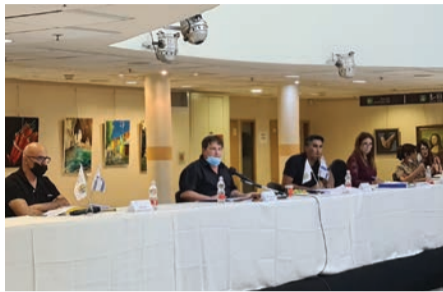
ישיבת מועצת העיר