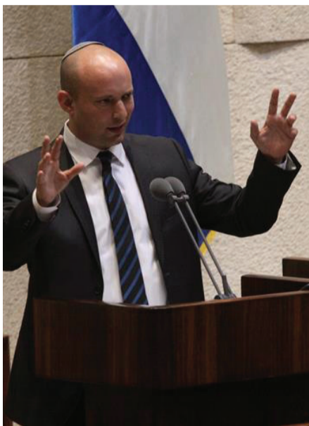
ראשי הממשלה הבאים: נפתלי בנט ואיר לפיד

הממשלה החדשה היא ככל הנראה עובדה מוגמרת. לראשונה מזה 12 שנה יצטרך נתניהו להתרגל לתואר ראש הממשלה לשעבר. החיים כיו"ר אופוזיציה יהיו משעממים הרבה יותר, בהנחה שייבחר להישאר בחיים הפוליטיים.