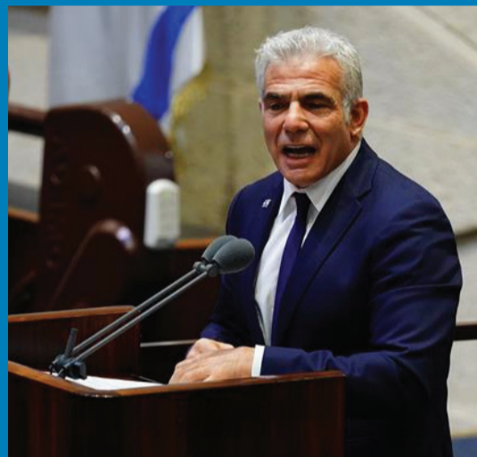
ראשי הממשלה הבאים: נפתלי בנט ויאיר לפיד

כפי הנראה ראשי מפלגות יש עתיד, ימינה, ישראל ביתנו, תקווה חדשה, העבודה, מרצ, כחול לבן ורע"ם הגיעו לסיכומים באשר להקמת ממשלה חדשה • לפיד הבטיח ממשלה צרה של 18 שרים אבל הממשלה החדשה, שככל הנראה תושבע ככל הנראה בשבוע הבא, תמנה 26 שרים • וזו לא הפרת הבחירות היחידה של חברי הממשלה החדשה | עמ' 10-12