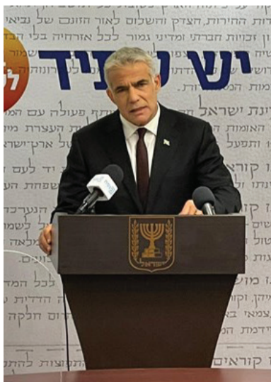
« תפר את הכל באופן מושלם. ראש הממשלה החליפי המיועד

לפיד הפגין מקצועיות כמעט מושלמת ביחס לכל מרכיב בקואליציה העתידית, והקפיד אפילו לשמר ערוץ סביר מול המפלגות החרדיות - גם אם ברור לכל שהן לא תצטרפנה בשלב זה לממשלת השינוי המדוברת, ולו מתוך תקווה שבעתיד, אחרי שיראו שהשד לא נורא כל כך ומשנתניהו ייעלם מהאופק, יואילו יהדות התורה וש"ס לחבור לממשלה בראשותו לכתחילה