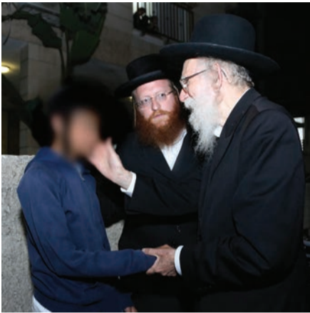
הגר"ש גלאי עם ילדי זה לזה

הופעתו הקורנת של הגה"צ רבי שמעון גלאי בפני משפחות האלמנות והיתומים התקיימה במסגרת יום פעילות של ארגון 'זה לזה' המקיים עבור המשפחות ימי פעילות ומעטפת תמיכה לאורך כל ימות השנה