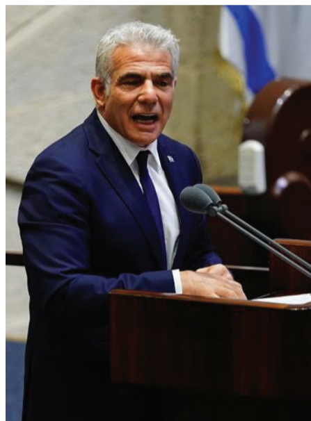
ננט בהצהרה ביום ראשון בערב שהועברה בשידור חי.

בהמשך הדברים אמר בנט: "בשנתיים וחצי האחרונות מדינת ישראל בסחרור. עוד מערכת בחירות, ועוד אחת, משך ארבע מערכות בחירות אנחנו מתבוננים בעיניים כלות על המדינה שלנו מחבלת בעצמה, מחלישה את עצמה, ומאבדת את היכולת שלה לתפקד.