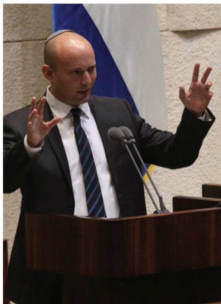
ראשי הממשלה הבאים: נפתלי בנט ויאיר לפיד

למעשה, המו"מ בין לפיד לבנט לא נפסק כמעט לרגע. גם כאשר בנט הכריז ש"ממשלת השינוי ירדה מהפרק" בעיצומו של מבצע "שומר החומות", נמשכו המגעים. המטרה הייתה להוריד את הלחץ הציבורי, בעיקר מהימין. המגעים להרכבת הממשלה הוצעו בשבוע האחרון עם ההכרזה הרשמית של בנט שבכוונתו לפעול להקמת ממשלה עם יאיר לפיד. "אני מודיע שבכוונתי לפעול בכל כוחי כדי להקים ממשלת אחדות לאומית יחד עם ידידי יאיר לפיד כדי שבעזרת השם, יחד, נחליץ את המדינה מהסחרור ונחזיר את ישראל למסלולה", אמר