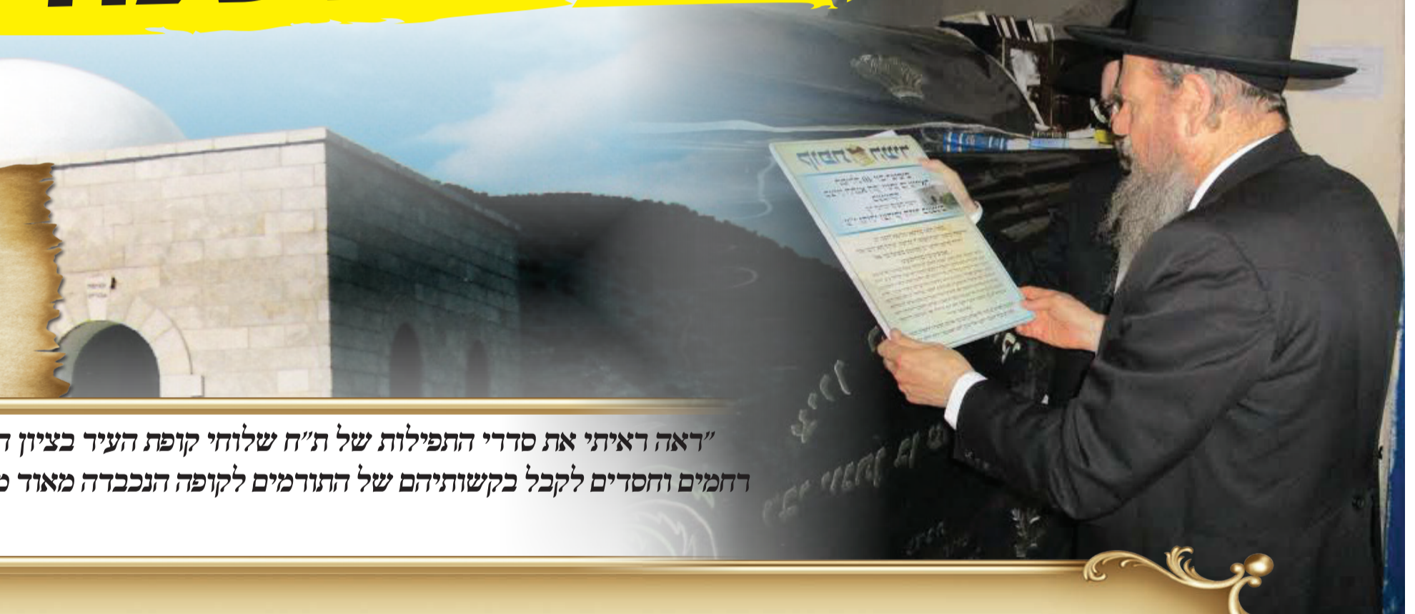
"דאה ראיתי את סדרי התפילות של ת"ח שלוחי קופת העיר בציון ה רחמים וחסדים לקבל בקשותיהם של התורמים לקופה הנכבדה מאוד כ