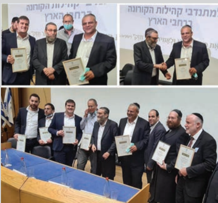
בחלוקת תעודות ההוקרה בכנסת

שזוקקים להמשך בדיקות נוספות. כל תושב שהיה זקוק קיבל מיידית דרך החפ"ק אישור לבדיקה מטעם נציג קופת החולים, ולאחמ"כ בוצעו הדגימות ושאר הטיפול הנדרש. בנוסף לשהות בחמ"לים העירוניים פעלו בשטח צוותי מאוחדת ברחבי הארץ בסיוע וטיפול בכל הנדרש, כולל בדיגום, מלוניות, וכלה בחיסונים שבוצעו במתחמים ייעודיים שהוקמו לשם כך.