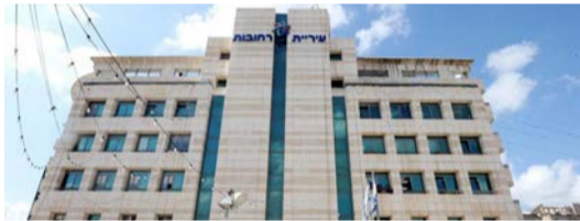
בניין עיריית רחובות