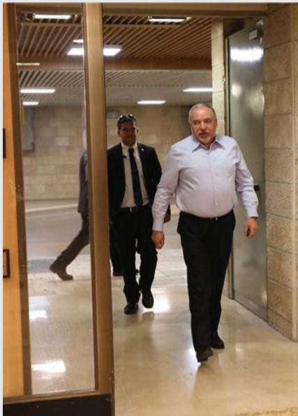
שרות חוקים נגד היהדות. שר האוצר המיועד אביגדור ליברמן

סעיף נוסף עוסק בשינוי הרכב הוועדה לבחירת רבנים. החשש הגדול הוא מפני הכנסת נשים ו'רבניות' רפורמיות לוועדה. גם חוק ברית הזוגיות, אותו בלמו המפלגות החרדיות במשך שנים, צפוי לעלות לבקשתה של ישראל ביתנו. במידה והחוק יעבור המאבק על טהרת הייחוס צפוי לעלות מדרגה במידה. עוד חוקים שעשויים לפגוע בסטטוס קוו: שינוי חוק הגיור ולפיו כל רב עיר יוכל לגייר, קידום חוק הגיוס, הכנסת לימודי ליבה בכל תלמודי התורה, ביטול חוק המרכולים וחוקים נוספים. חוקים אלו יזכו לתמיכה גם מצד חברי הכנסת של מרצ, מפלגת העבודה ויש עתיד. האם בנט ושקד, סגרו ואלקין יבלמו את ליברמן בממשלה החדשה הצפויה לקום, או שהקדנציה הקרובה תיזכר לדיראון עולם בתולדות היהדות החרדית. לא בכדי, בניסיון של הרגע האחרון ניסו השר אריה דרעי והשר יעקב ליצמן לפנות לבנט ושקד ולסער ואלקין, למנוע את הקמת הממשלה המתהווה. "לאור כל מה שהוצג בפנינו על האירועים הפוליטיים בימים האחרונים, אנו משוכנעים בביטחון מוחלט כי יש אפשרות להקים מידית ממשלת ימין בת 65 ח"כים", נאמר בהודעה