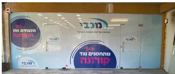
מתחם החיסונים של מכבי בבית שמש

אבל במקביל לטיפול בילדים, יש גם את הצד ההורי שנוכח בדרך כלל כאשר מדובר בילדים. "כשמדובר בילדים קטנים, חלק מהתפקיד זה גם לתת מענה להורים שלהם. לפעמים הורים דאוגים, לעיתים יש להם שאלות, והמטרה היא לתת להם את המידע הנכון וגם להרגיע ולכוון אותם. המטרה היא לתת לילד