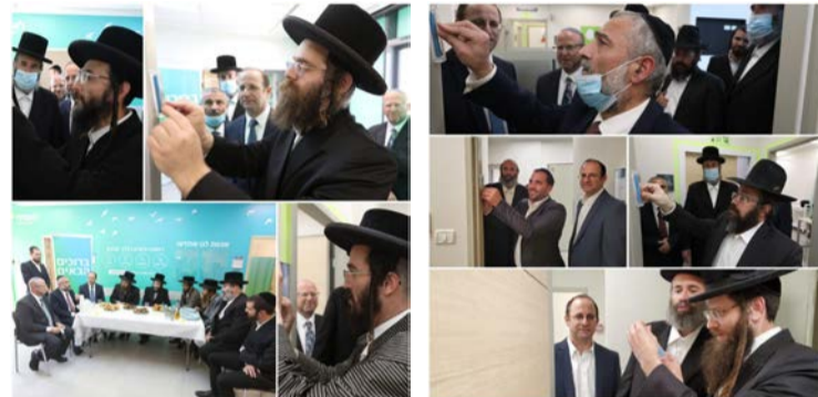
קביעת מזוזה במרכז הרפואי החדש של לאומית

ואמר שעל ידי קביעת המזוזה יזכו שתהיה שמירה מופלאה במקום ויגיעו רק לצורך שמחות וכיוצא בזה. בדבריו עמד רב השכונה על הקשר ההדוק שיש בין הנהלת לאומית שירותי בריאות לבין הרבנים אשר משבחים תמיד את שיתוף הפעולה הפורה. לאחר מכן קבע מזוזה הגר"א היימליך שליט"א המכהן כרב