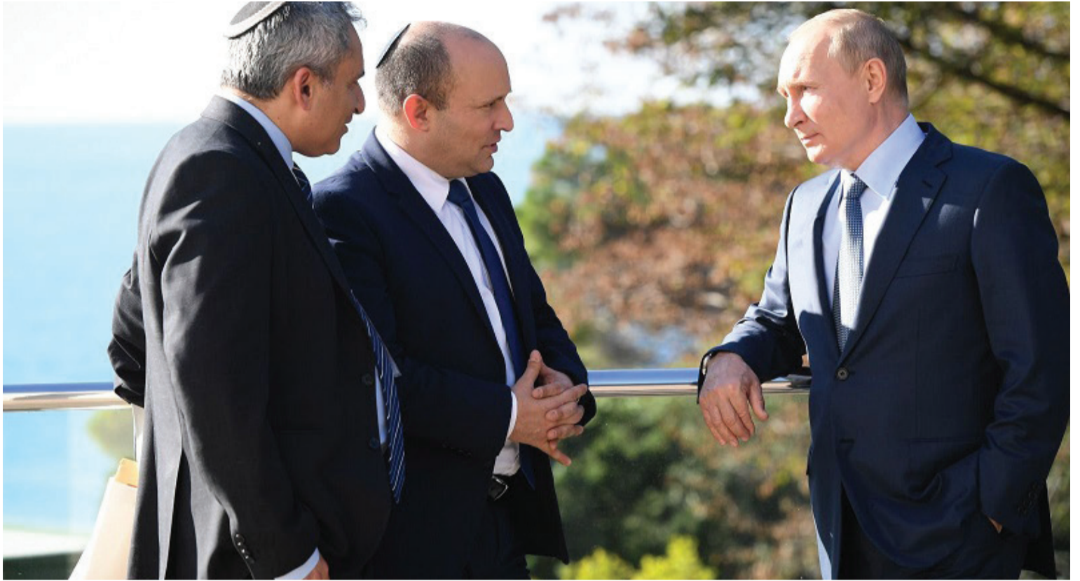
פרוש לטובת שקד? ראש הממשלה בפגישה עם נשיא רוסיה | צילום: קובי גרעון, לע"מ