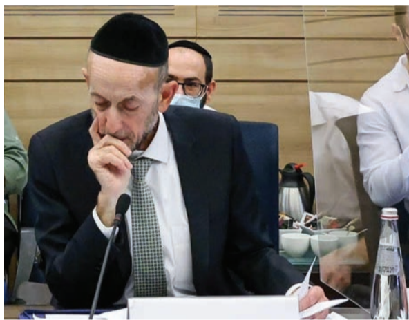
ח"כ אורי מקלב בוועדה

בעקבות ההחלטה על השתתפותן בישיבות ועדות הכנסת, הגיש ח"כ אורי מקלב מאות הסתייגויות לוועדה לענייני הדת בראשה עומדת ח"כ יוליה מילינובסקי מישראל ביתנו. כמה שעות לפני הוועדה פירסמה ח"כ מילינובסקי סרטון שבו היא לועגת למערכות הכשרות החרדיות ומכתירה את בד"צ מילינובסקי ככשרות הטובה. הסרטון עורר סערה והמחיש יותר מכל את הבורות האדירה של ח"כ מילינובסקי בנושאי הכשרות, כאשר כל מטרת הרפורמה היא לקעקע את חומת הכשרות ולא להיטיב עימה. במהלך הדיונים בוועדה הוכיח ח"כ אורי מקלב כי בעבודה פרלמנטרית יעילה, ניתן להגיע להישגים גם באופוזיציה. בגיבוי הייעוץ המשפטי של הוועדה, הוועדה לשירותי דת קיבלו שורה של הסתייגויות, ביניהן, הסתייגות הקובעת כי גם מועצות דתיות יוכלו להעניק תעודות כשרות, וכן הסתייגות נוספת ולפיה רב מוסמך יוכל לתת כשרות במסגרת מועצה דתית בה לא מכהן רב עיר. הסתייגות נוספת מסירה את דרישת החוק להציג את רשימת משגיחי הכשרות לאישור השר בעת בקשת רישיון הכשרות. למעשה כבר בשעותיה הראשונות של דיוני הוועדה ברפורמת הכשרות, הוועדה קיבלה 9 מההסתייגויות שהגיש ח"כ מקלב, שאמר: "זה מראה כמה החקיקה לא מקצועית, אנחנו היינו צריכים לתקן את הטעויות של הקואליציה".