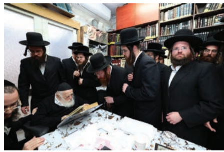
ראשי 'זה לזה' במעונו של מרן הגר"ח קניבסקי

מִרְן שֶׁר הַתּוֹרָה הוֹרָה וְהַיְלִידִים הֵיטוּמִים בְּאֲרֻגוֹן 'זֶה לֹזֶה' הַחֲלוּ בְּלִמּוּד שְׁבוּעֵי בְּדִינֵי שְׁבִיעִית • הַלִּמּוּד יִתְקִיִּים בְּמִסְגֶּרֶת הַשְּׁבוּעִית עִם מֵאוֹת הַחֲוֹנְכִים מִטַּעַם פְּרוֹיֶקְט בְּנֵי מַלְכִים שֶׁל אֲרֻגוֹן 'זֶה לֹזֶה' • בְּתוֹם הַלִּמּוּדִים יִעֲרֹכוּ חִדּוּשֵׁי נוֹשְׂאֵי פֶרְסִים עַל מִנַּת שְׁהִילְדִים יִיצְאוּ כְּשֶׁתִּלְמוּדֵם בִּידֵם