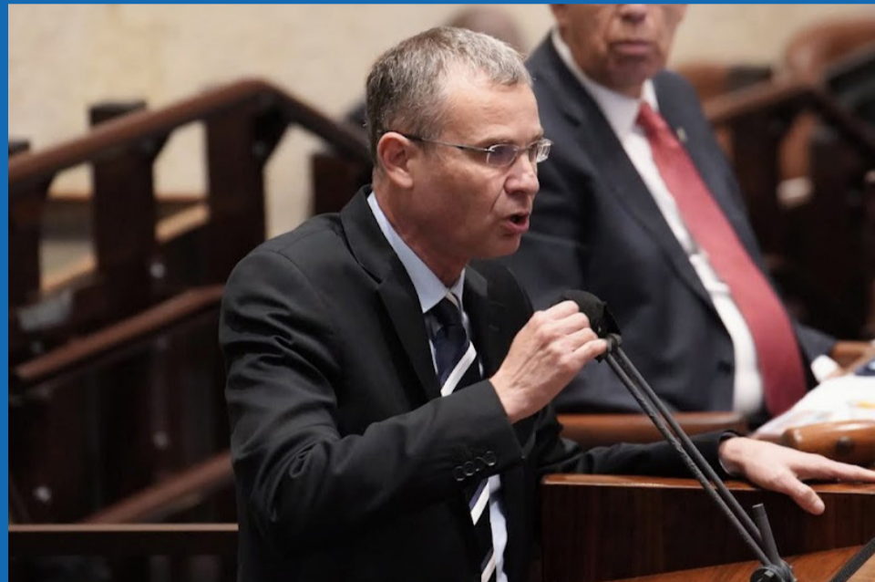
ח"כ יריב לוין בנואם שכונן במיוחד לח"כית זועבי ממר"צ

נפתלי בנט, שר הביטחון בני גנץ ושר החוק יאיר לפיד: "ביום רביעי הקרוב הקואליציה תניח את הצעת חוק הגיוס מחדש עם בקשה לפטור מחובת הנחה. ההצעה תעלה להצבעה במליאה בשבועות הקרובים."