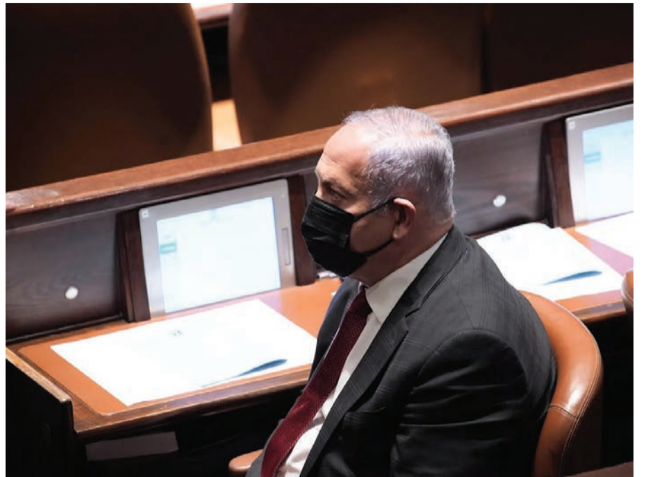
נתניהו ביום שני במליאת הכנסת

הידיעה על עסקת טיעון אפשרית, טרפה את הקלפים במערכת הפוליטית. לפחות שלוש מפלגות בקואליציה הנוכחית היו מעדיפות קואליציה עם הליכוד ללא נתניהו - ישראל ביתנו, תקווה חדשה וימינה. רה"מ בנט יעדיף בהמשך כהונתה של הממשלה הנוכחית, משום שסיכויו לשוב אל לשכת ראש הממשלה אפסיים. גם בני גנץ היה שש לכהן כשר ביטחון בממשלה אחרת. האיבה בינו לבין לפיד עודנה קיימת. בבחירה בין נתניהו לבין בנט ולפיד, גנץ בשניים האחרונים, חרף המשקעים האדירים שנותרו בעקבות פירוק כחול לבן בשעתו. גנץ אינו רואה בלפיד מועמד ראוי לראשות ממשלה. אם יש מישהו שישמח לראות כיצד התואר ראש הממשלה החליפי מתפיד מלפיד הוא גנץ עצמו. שר הביטחון עדיין ממתין להתנצלות של לפיד אחרי שבמשך שנה תמימה לעג מעל דוכן הכנסת לתואר ראש הממשלה החליפי ולשירת האודי