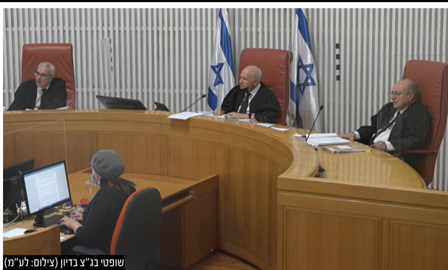
שופטי בג"ץ בדיון

הישג דרמטי לעתירת הארגונים החרדיים נגד הקיצוץ בסבסוד המעונות לילדי אברכים: ברוב של שניים נגד אחד דחה בג"ץ את הקיצוץ לשנת הלימודים הבאה • ארגון 'אמת ליעקב': "מברכים על ההחלטה וקוראים לשר האוצר לבטל את הקיצוץ המזיק וחסר התכלית" • חברי הכנסת החרדים בירכו על ההישג