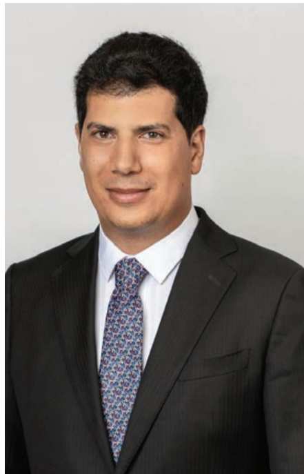
יצר את החיבור עם אהרון ברק. עו"ד עמית חדד

ויש עוד תרחיש: בעוד שנה או שנתיים, כאשר האווירה הציבורית תאפשר זאת, נתניהו יהיה רחוק מהגה השלטון. שמו כבר לא יעטר את הכותרות והמאמרים בכלי התקשורת. הוא עשוי לבקש מהנשיא בקשת חנינה, לפחות על הקלון. אם ריבלין העניק חנינה דומה לאולמרט, אין שום סיבה שהנשיא הרצוג לא יחון את נתניהו.