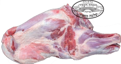
כתף טלה טרי מחפוד