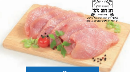
שניצל עוף טרי פרום חתם סופר