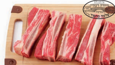
אסאדו טרי עם עצם מחפוד