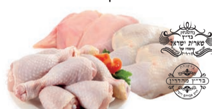
כרעיים / חזה / שוקיים עוף טרי כשרות רובין ו שארית ישראל