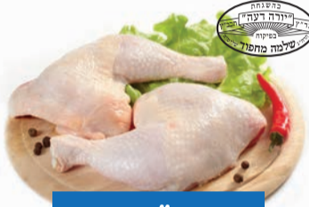
כרעיים / ירכיים / חזה עוף טרי ארוז מחפוד

חניה חינם ללקוחותינו! א' - ה' החל משעה 17:00 יום שישי מפתחת הסניף בחניון מגדל בסר 4, רח' מצדה 5