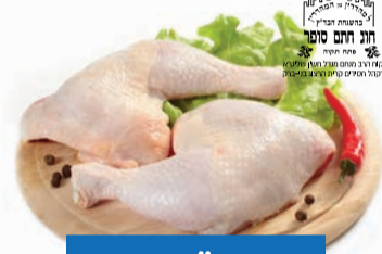
כרעיים / ירכיים עוף טרי חתם סופר