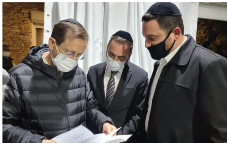
נ"כ בוסו ומאיר פנחס מגישים את אגרת התנחומים לנשיא המדינה

יהי רצון שפעולה ומעשיה יעמדו בבי"ד של מעלה לזכותה ולזכות צאצאיה ובייחוד לזכות כב' בתפקידו נישא ורם, והנני לברכו שתזכה