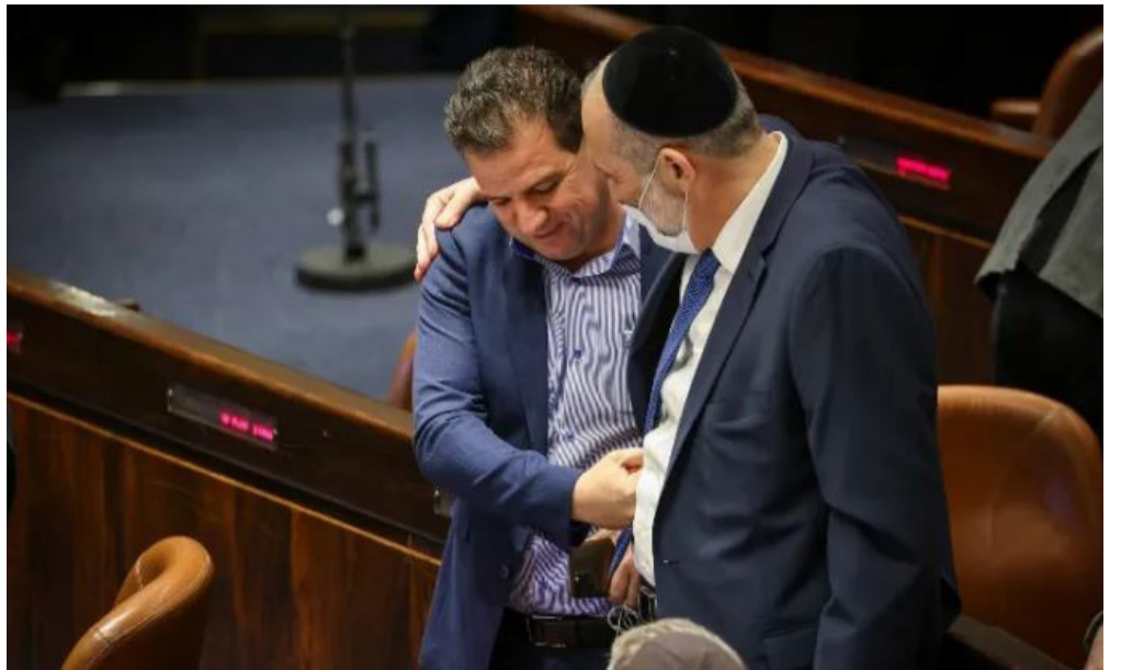
צ'אפחות בין ש"ס והמשותפת, רגעי הניחוח

הסכם טיעון תהיה עבורם התקפלות אחת יותר מדי. מהלומה קשה למחנה הנאבק בדיקטטורה השיפוטית בישראל.