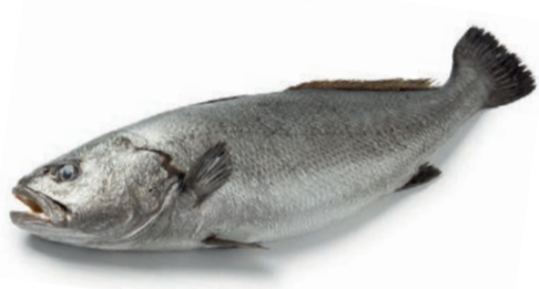
מוסר ים טרי