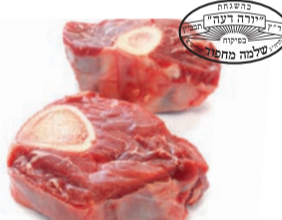
אוסובוקו טרי מחפוד