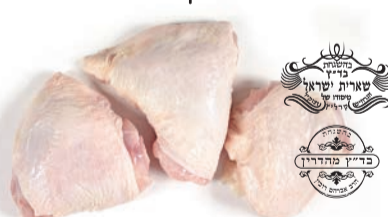
ירכיים עוף טרי כשרות רובין ו שארית ישראל