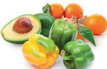
מגוון פלפלים / אבוקדו / קלמנטינה