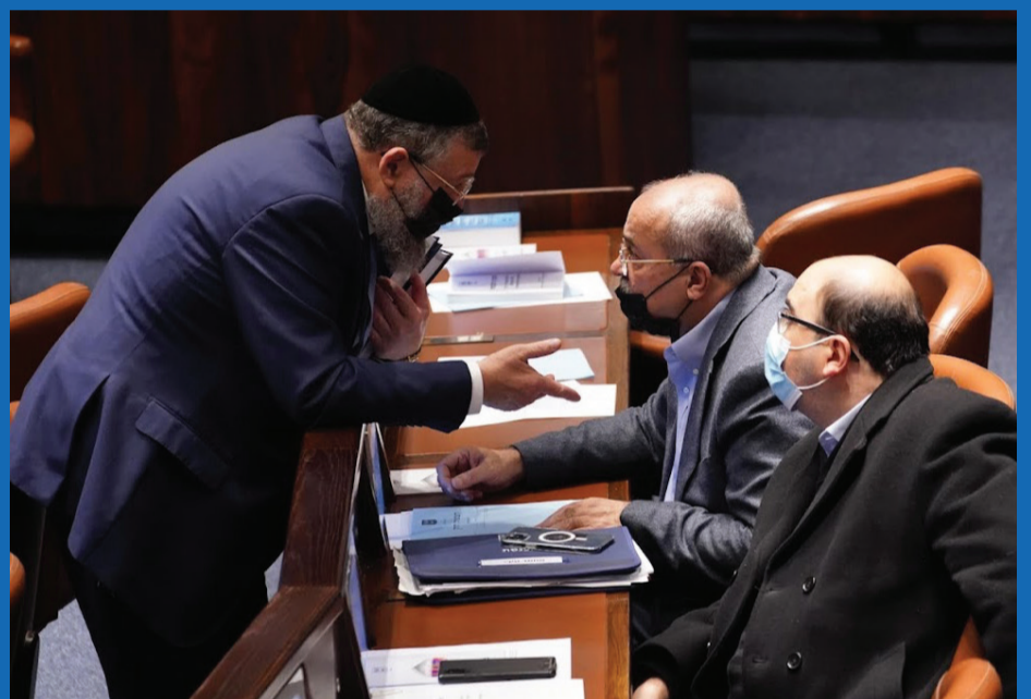
ח"כ בן צור בתיאום עם נציגי הרשימה המשותפת