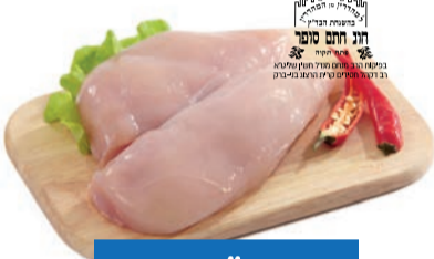
חזה עוף טרי חתם סופר