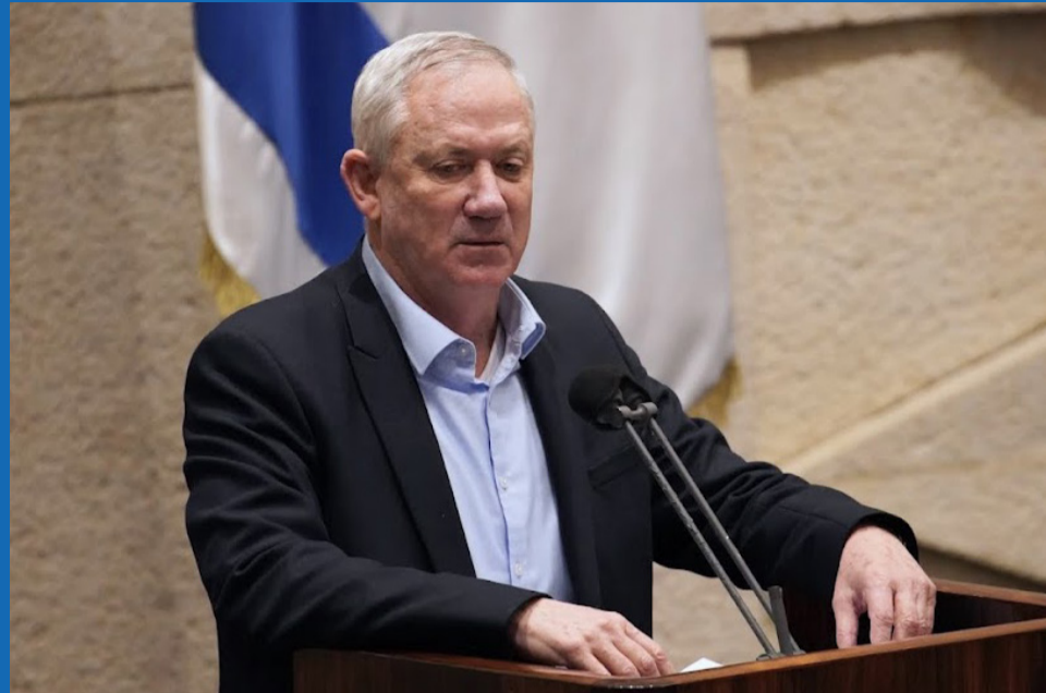
שר הביטחון בני גנץ מציג את הצעת החוק