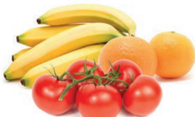
עגבניה / בננה / תפוז ברשת