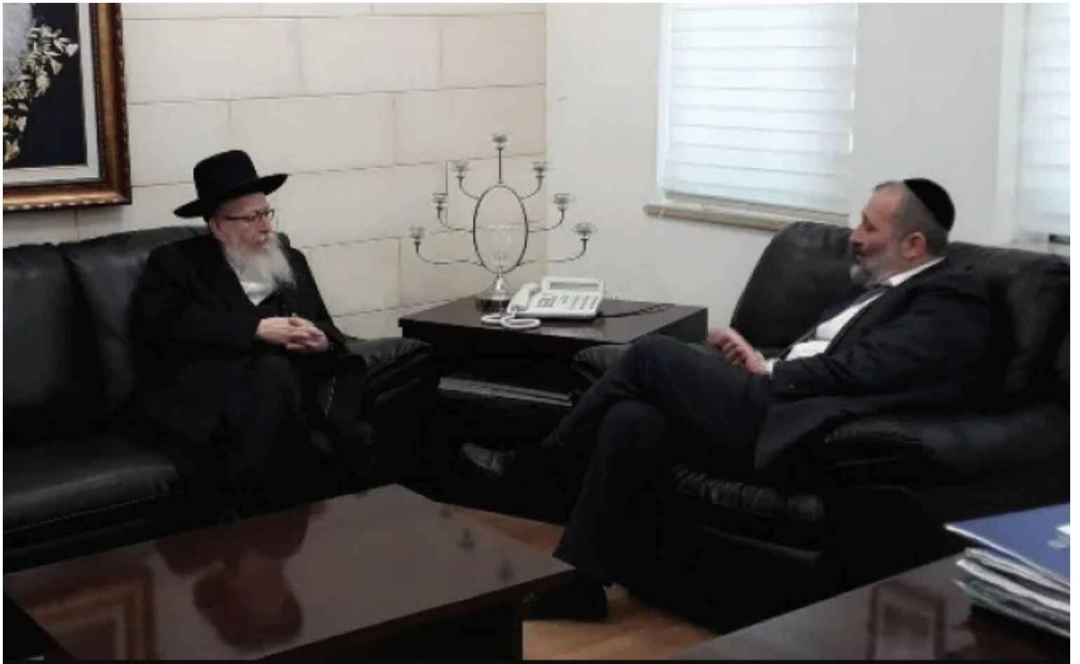
זמני וקבוע, שני הפורשים

כך או כך, במפלגה שאינה מושפעת מליכודניקים חדשים' או ישנים, מה שיקבע בסוף הוא כמובן אך ורק הכרעתו של הרבי מגור, שיכתיר את היו"ר הבא של 'אגודת ישראל' ובסבירות לא מבוטלת גם את השר הבא מטעמה.