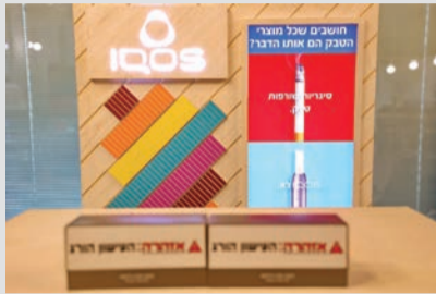
הנמצאים בעשן סיגריות.

עשן מקיימת פיליפ מוריס בע"מ פעילות להגברת המודעות לנזקי עישון הסיגריות. במקביל למימוש חזון החברה, השקיעה פיליפ מוריס אינטרנשיונל מאמצים ומשאבים רבים בפיתוח האייקוס, מוצר מבוסס מדע וטכנולוגיה, שהינו מוצר הדגל של החברה המיועד למעשנים בגירים שאינם מפסיקים. מוצר זה, בניגוד לסיגריות רגילות, מאזמזם טבק ולא שורף אותו, ונמכר כיום בלמעלה מ-60 שוקים ברחבי העולם. מאז השקתו בישראל, אלפי מעשנים בגירים כבר נטשו את הסיגריות והצטרפו למיליוני מעשנים בגירים ברחבי העולם שעברו להשתמש באייקוס.