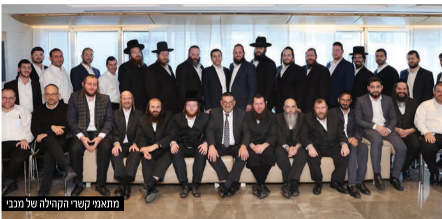
מתאמי קשרי הקהילה של מכבי