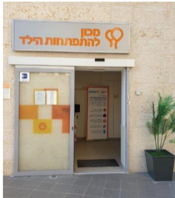
מאוחדת בית שמש

בבית שמש פרוסות 14 מרפאות של מאוחדת ברחבי העיר המעניקים שירותי רפואה ראשונית, רפואה מקצועית לצד שאר שירותי הרפואה, מבלי הצורך לצאת אל מחוץ לעיר.