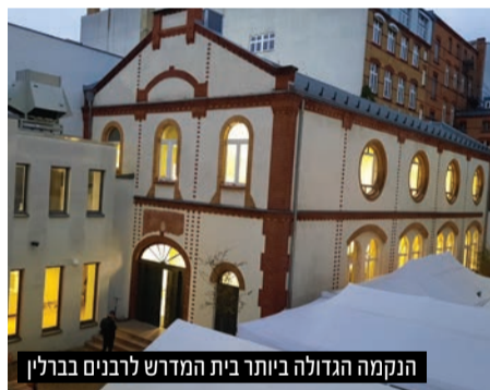
הנקמה הגדולה ביותר בית המדרש לרבנים בברלין