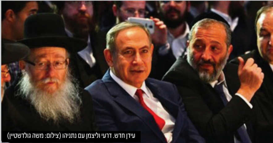
עידן חדש. דרעי וליצמן עם נתניהו

שתי דרמות פוליטיות פנים חרדיות: אריה דרעי צפוי להתפטר מהכנסת, לאחר שחתם על הסדר טיעון מול הפרקליטות והודה בשתי עבירות מס קלות • מנגד, ליצמן הטיל פצצה בראיון לערוץ הכנסת: זו הקדנציה האחרונה שלי, לא אתמודד שוב לכנסת, צריך לתת מקום לכוחות הצעירים