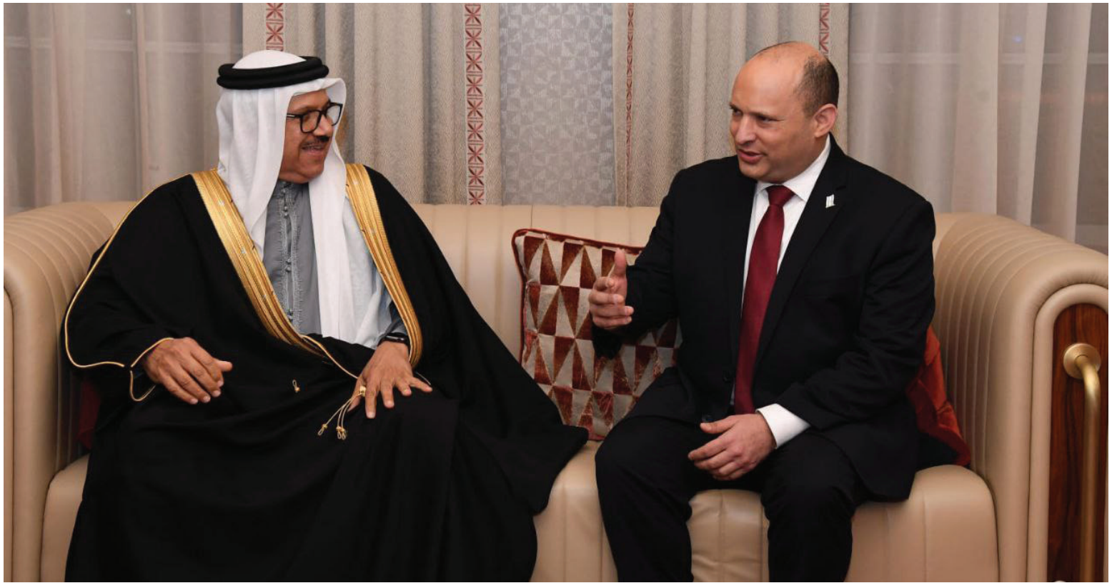
נמלט מהחזית הביתית, ראש הממשלה בביקור בבחריין

» לנציגות החרדית אין סיבה להתלונן מכמה טעמים: ראשית, במישור המעשי החלפת רבנים קשישים ברבנים צעירים היא צעד שיתרום לחיזוק היהדות בערים רבות. שנית, בקדנציות האחרונות נאלצו שרי הדתות להילחם בטחנות רוח בכל מינוי ומינוי. פישוט ההליכים הביורוקרטיים ישרת גם אותם בהמשך, אם וכאשר משרד הדתות ישוב לידיהם. וכמובן, בחירות אחת לעשר שנים יפתחו את האפשרות לריענון ומינוי רבנים אחרים לפי הצורך והעניין.