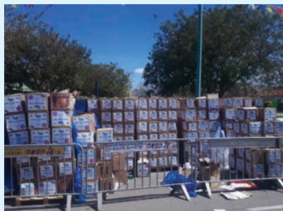
החלוקה בשנה שעברה

במסגרת החלוקה יחולקו כרטיסים נטענים של קרן טובה וברכה, המשתפת פעולה זו השנה השנייה עם עיריית אלעד כדי לסייע לתושבים ומשפחות הנזקקות לסיוע