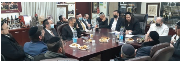
ישיבת מועצת העיר בנושא הוזלת מחירי המקוואות