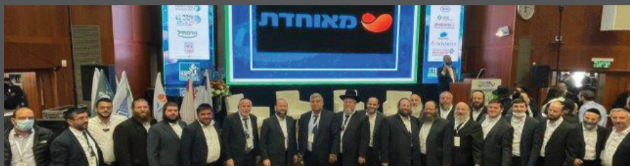
מנהלי קשרי קהילה של מאוחדת