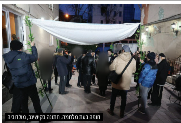
חופה בעת מלחמה. חתונה בקיישיב, מולדובה