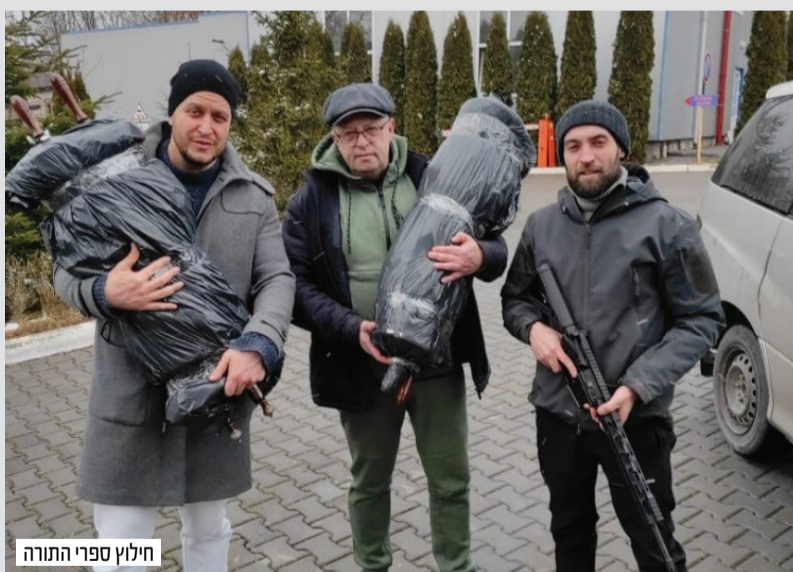
חילוץ ספרי התורה