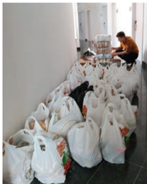
חלק מהמזון והמוצרים שנרכשו

ומוצרי מזון כדי לסייע לנזקקים המקומיים, בהם גם שאינם