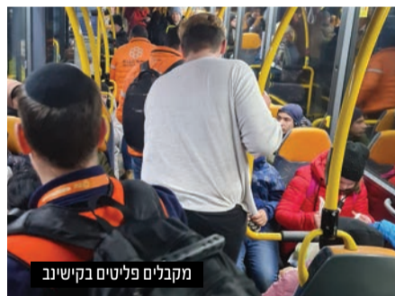
מקבלים פליטים בקיישיב

להגיע ליעדים אחרים באירופה. אנו שואבים כח ומעודדים מאוד מההיענות הלבבית מצד רבני הוועידה הפרוסים ברחבי אירופה ונמשיך בכך עד יעבור זעם".