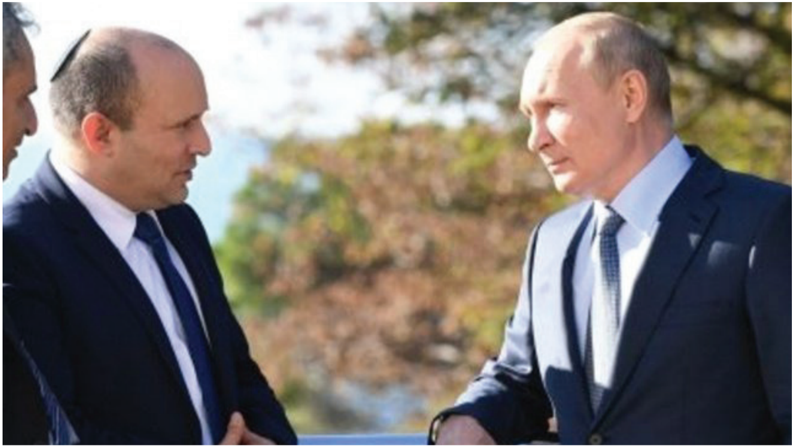
מדינאי מתחיל ודיקטטור ותיק. בנט ופוטין

אחרונים ברשימה - חוק מורשת הרב קוק של ח"כ אורבך וחוק חלופה לתמ"א 38 מטעם השרה שקד - והדיונים במליאה יימשכו במידת הצורך גם לתוך יום שישי.