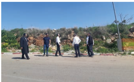
בניה חדשה וסיור עירוב