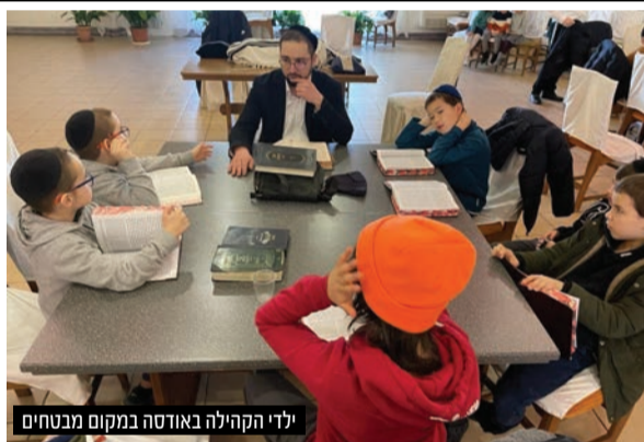
ילדי הקהילה באודסה במקום מבטחים