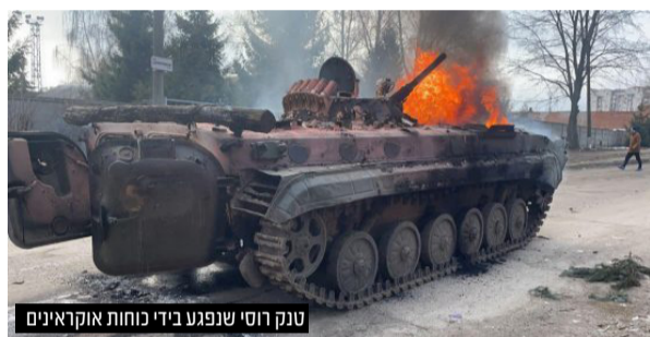
טנק רוסי שנפגע בידי כוחות אוקראינים

למלחמה. מראות החיילים השבויים עוררו זעם רב בקרב תושבי רוסיה ובלמעלה מחמישים ערים מרכזיות ברוסיה יצאו מאות אלפים להפגין נגד שלטונו של פוטיין.