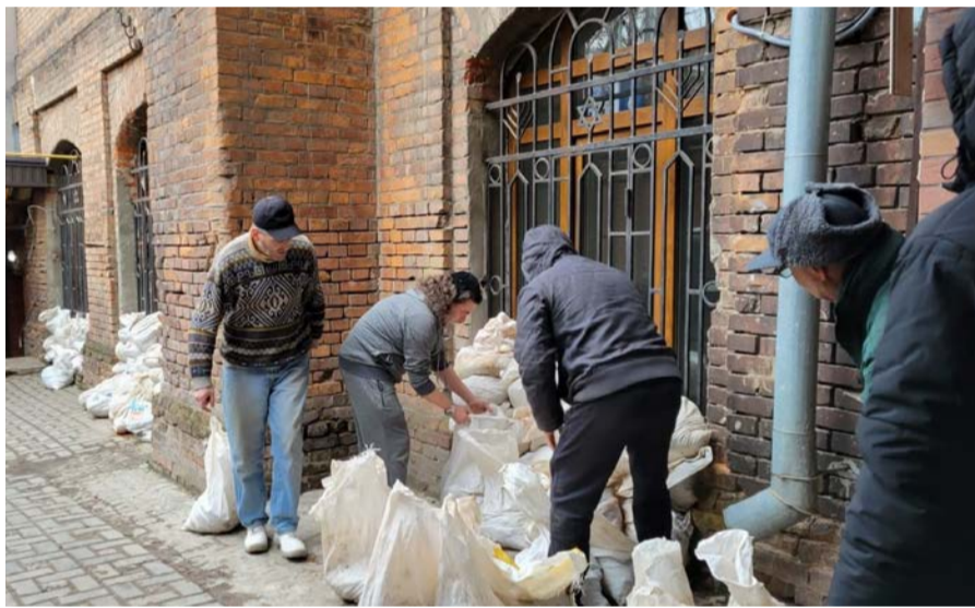
מאת: חיים רייך