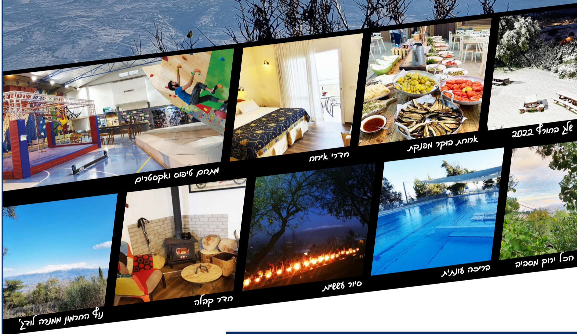
של החורף 2022