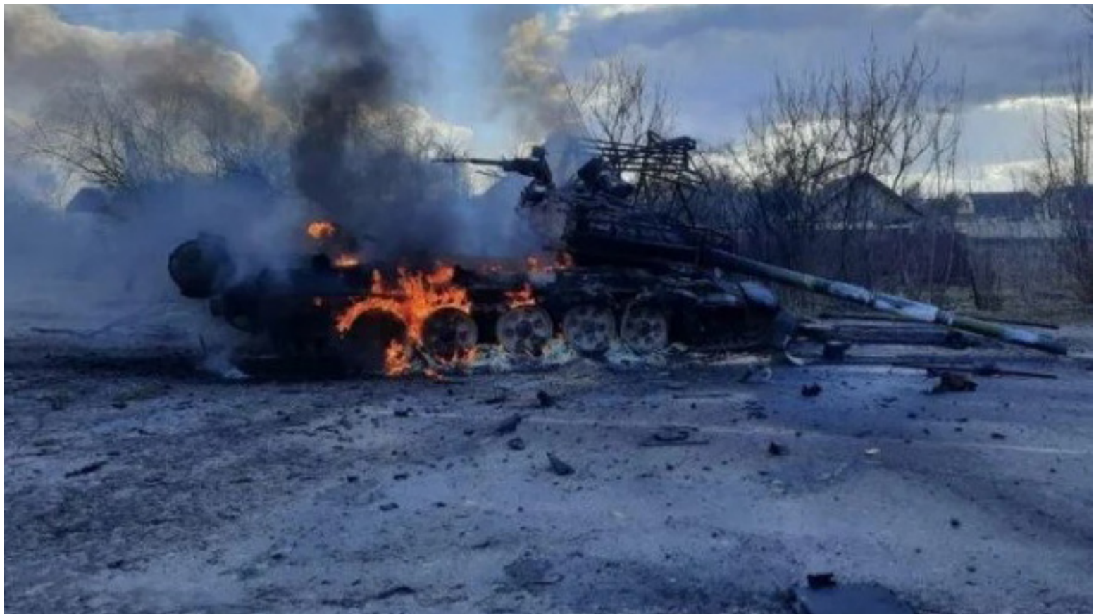
בלי מעורבות אמריקנית, המלחמה באוקראינה