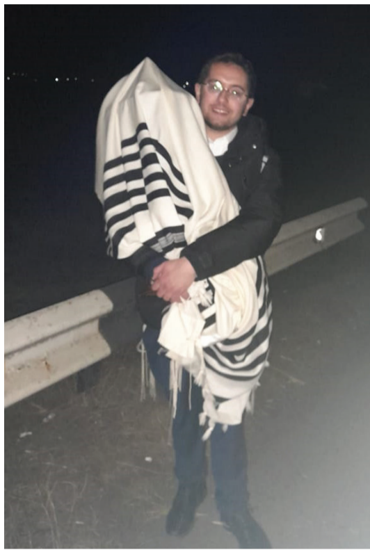
מחלצים את ספרי התורה

במבצע הצלה הרואי שיזם רבה של אודסה הרב שלמה בקשט, חילצו עשרה אוטובוסים 150 ילדים יהודים יתומים במסך שהחל ביום שישי בבוקר והסתיים רק כעבור 27 שעות בצהרי יום השבת. הרה"ג שלמה בקשט, רבה של אודסה וסגן יו"ר הוועדה המתמדת של ועידת רבני אירופה משחזר את מסע ההצלה המסובך