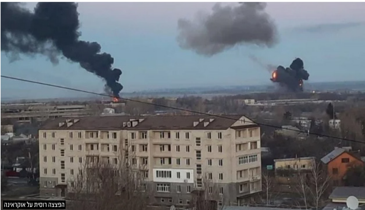
הפצצה רוסית על אוקראינה