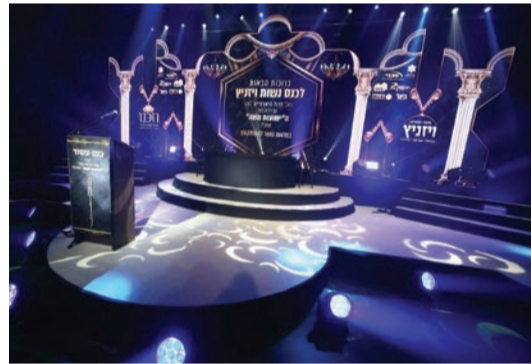
נס ויד'ניץ של מכבי

בכל רחבי העיר. כמו כן קיימים גם מכוני שמיטה, ריפוי בעיסוק, מכוני הלב, מכוני סכרת, מוקדי רפואה דחופה הפעילים בכל ימות השבוע, ארבע מרפאות שבת בכל רחבי העיר, מכוני גדול של התפתחות הילד שמתרחב בימים אלו ממש, מרפאת טבעי לרפואה משלימה, 26 כיסאות לרפואת שיניים, בתי מרקחת ועוד."