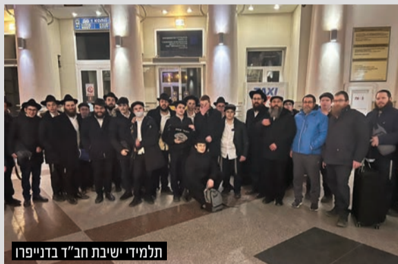
תלמידי ישיבת חב"ד בדנייפרו