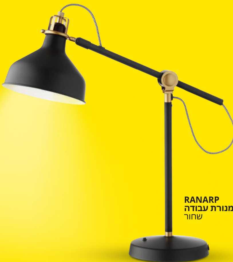
RANARP מנורת עבודה שחור

זמן איכות עם סבא וסבתא הוא זמן יקר, בואו נהנה איתם כמה שיותר.