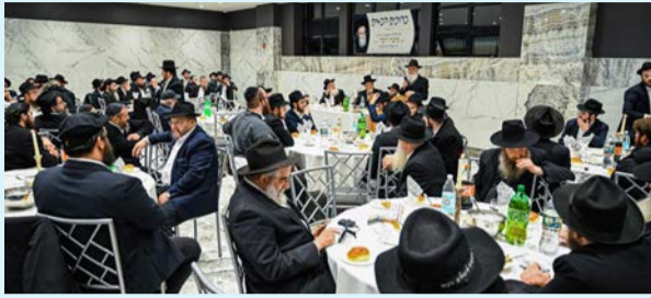
חלק מבני ההילולא

במשך שעות ארוכות העלו הנוכחים זכרונות הוד משנות הסתופפותם בצלו של ענק התורה והחסידות ושיתפו בעובדות אישיות ומרגשות סביב דמותו הגדולה, שהטביעה חותם בל-יימחה על יהודים רבים, אשר חיים לו את התקרבותם לצור מחצבתם. זכותו תגן עלינו.