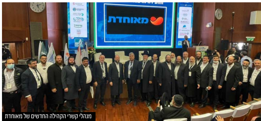
מנהלי קשרי הקהילה החדשים של מאוחדת