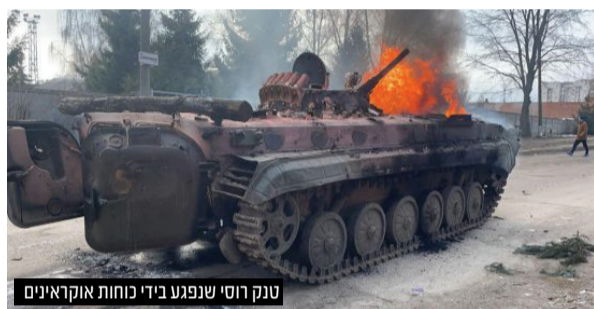
טנק רוסי שנפגע בידי כוחות אוקראינים