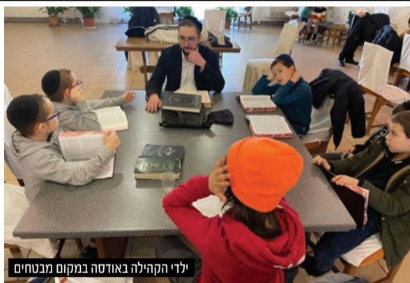
ילדי הקהילה באודסה במקום מבטחים