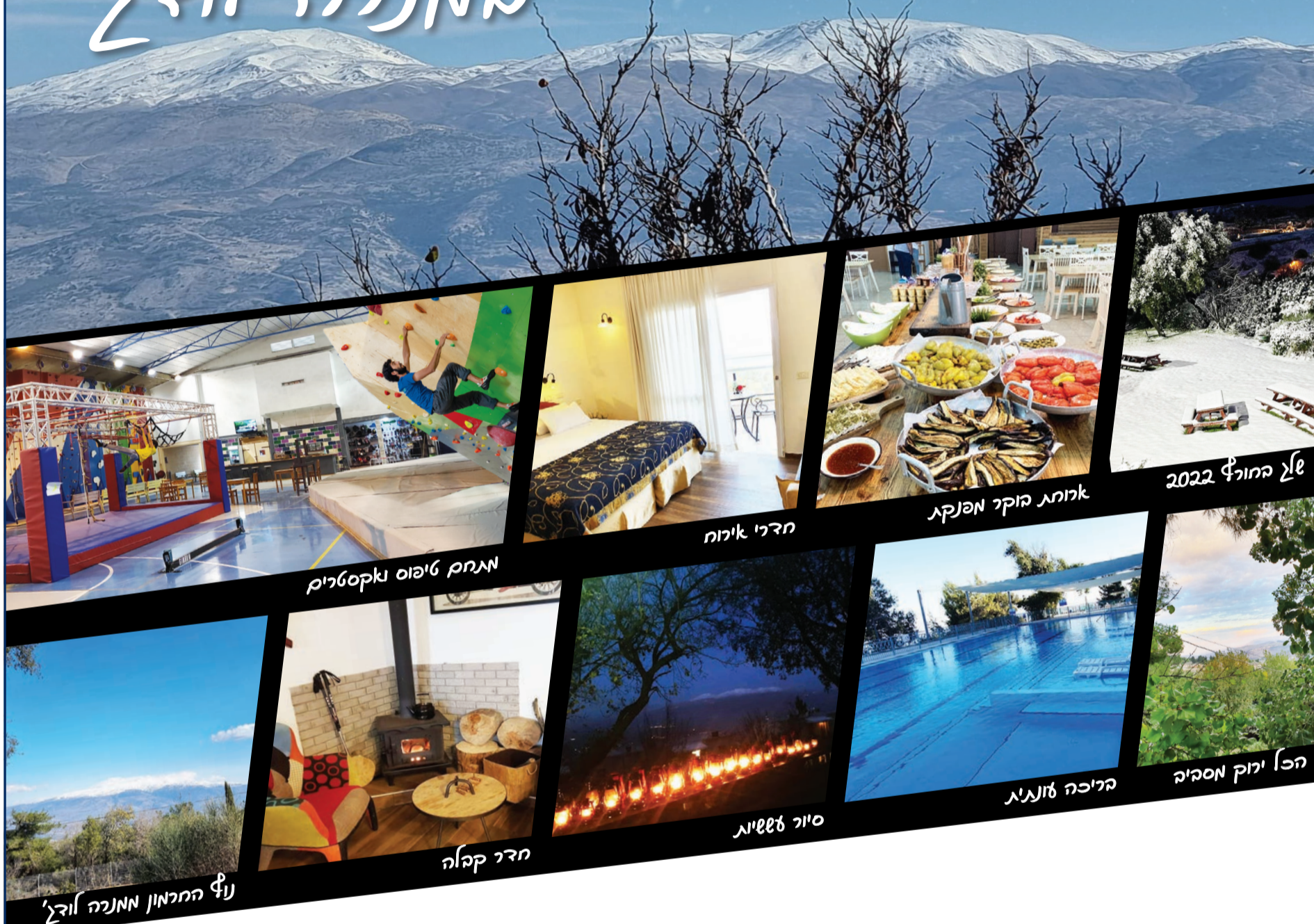
מתחם טיפוס ואקסטרים