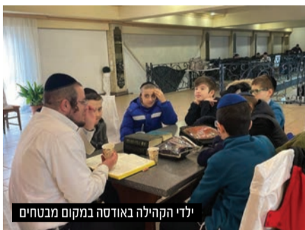
ילדי הקהילה באודסה במקום מבטחים

למולדובה הגיעו עד היום אלפי פליטים והם מסתייעים ברבה של המדינה הרב זלצמן המפעיל כ-150 מתנדבים הפרוסים ב-17 נקודות הגבול ובמוסדות 'אגודת ישראל' של הקהילה האורתודוקסית. בשבת האחרונה סיפקה 'אגודת ישראל' כאלפיים מנות אוכל לשבת לפליטים ובהם תלמידי והסגל של ישיבת חב"ד מדנייפר ששעו את דרכם ליאסי. למאות אורחי בתי המלון שנשכרו ולמאות שנקלטו בבתי ובבתי הארחה בעיר קיישינב וסביבתה. "מה שמאפיין את הפליטים ושובר את הלב כפשוטו הוא השקט שאופף את הפליטים. הם מגיעים הלומי קרב. שבורים ורצוצים. אינם יודעים מה יולד יום ולאן יגיעו ואנו עושים ככל שביכולתנו להקל על סבלם" – אומר הרב זלצמן בכאב עצור.