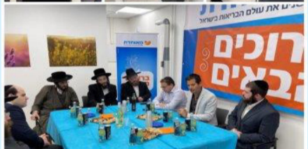
מרפאת מאוחדת החדשה בבית שמש

הבריאות בצורה המותאמת ביותר למגזר החרדי, מאוחדת בבית שמש מונה 15 מרפאות בנוסף בבית שמש 3 מרפאות שיניים, 7 בתי מרקחת, 8 מוקדי שבת וחג, 2 מכוני רנטגן, מרכז התפתחות הילד, מרכז לבריאות האישה, מרכז לבריאות הנפש, מוקד רפואה דחופה כל הלילה, מרפאה לרפואה משלימה, ועוד.