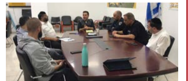
ישיבת הערכות לקראת פסח

בין הנושאים שנידונו בפגישה: הסדרה של תחום קמחא דפסא והגעת כלים