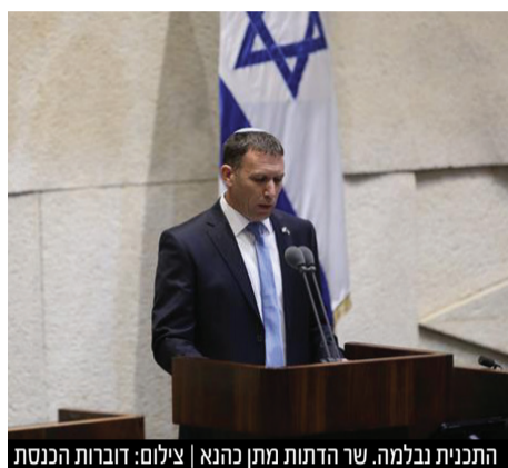
התכנית נבלמה. שר הדתות מתן כהנא

יו"ר רע"מ מנסור עבאס הבהיר לראש הממשלה ולראשי הקואליציה שאין בכוונת מפלגתו להתערב בחיי הדת היהודים ובקואליציה הבינו שאין רוב לרפורמת הגיור של השר כהנא • החוק נדחה למושב הקיץ אך ספק רב אם ימצא לו רב • בש"ס מיהרו לחגוג: "חוק הגיור שעמד להמיט חורבן גדול על שלמות העם - נהדף משולחן הכנסת וממושב החורף"