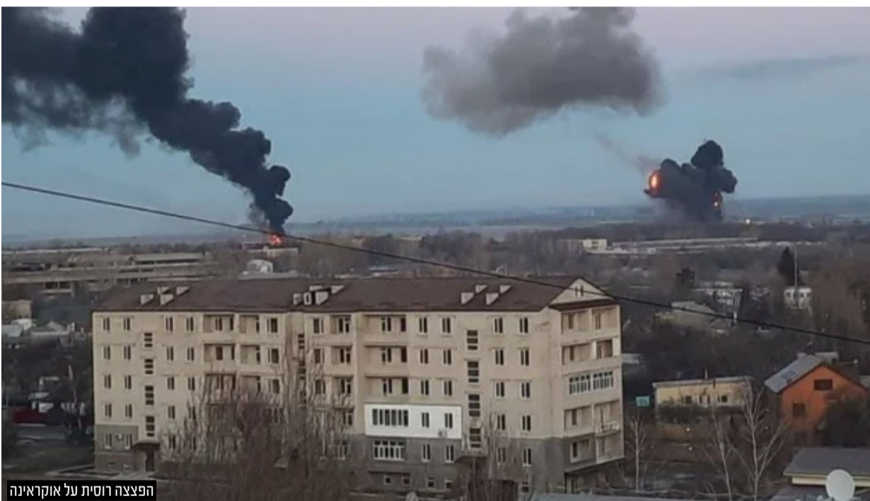
הפצצה רוסית על אוקראינה