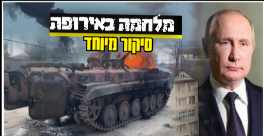
מלחמה באירופה סיקור מיוחד

ההפצצות הבלתי נגמרות על הערים המרכזיות, ההימלטות של מאות אלפים אל מעברי הגבול, המשבר ההומניטרי שמתפתח, ההסתערות של חנויות המזון ותחנות הדלק, והפחד ששולט בכל פינה • יומן מלחמה: כך מצאו עצמם עשרות מיליוני תושבי אוקראינה יחד עם עשרות קהילות יהודיות בקו האש • עדויות של ראשי הקהילות היהודיות באוקראינה על החיים בחזית המלחמה ועל הניסיונות להשיג מים ומזון כשאיש אינו יודע לומר מתי תסתיים המלחמה | סקירה נרחבת - עמ' 4-17