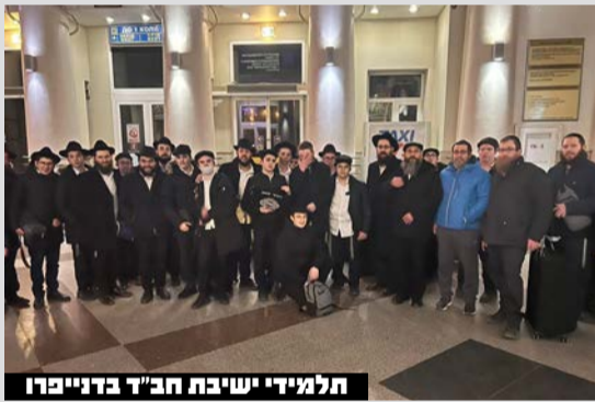
תלמידי ישיבת חב"ד בדנייפרו

עשרות בחורים משיבת חב"ד בעיר דנייפרו, עיר העסקים והשלישית בגודלה באוקראינה, חולצו ביום שלישי בלילה במבצע מיוחד והורחקו מהחזית הבווערת. הישיבה שהוקמה בעיר לפני 9 שנים, מונה 60 בחורים שכולם בנים למשפחות שלוחי חב"ד – רובם מאוקראינה וחלקם מרוסיה ומדינות ברית המועצות לשעבר. הוריהם של הבחורים עסוקים בימים אלו בעזרה ליהודים בעריהם נוכח המלחמה, והם העדיפו שהילדים יישארו בישיבה, במסגרת מוגנת ומוסדרת. יחד עם זאת, נוכח התקרבות החזית לדנייפרו ואזעקות שנשמעו בה ימים האחרונים, החליטה הנהלת שלוחי חב"ד במדינה, בעצה אחת עם גורמי בטחון והורי התלמידים, להוציאם בהקדם מהמדינה, כדי שיוכלו להמשיך בלימודיהם ללא חשש. כאמור, ביום שלישי בלילה יצאו הבחורים לדרך, יחד עם משפחות אנשי הצוות, ברכבת לילה לאודסה. הנסיעה ארכה 11 שעות והבוקר הם הגיעו לעיר.