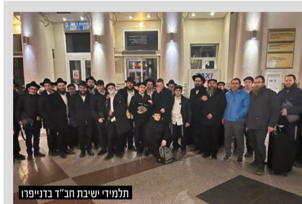
תלמידי ישיבת חב"ד בדנייפרו