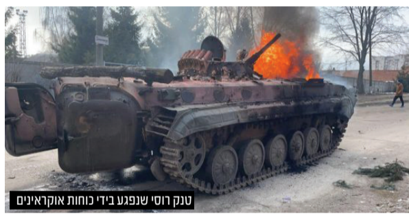
טנק רוסי שנפגע בידי כוחות אוקראינים

למלחמה. מראות החיילים השבויים עוררו זעם רב בקרב תושבי רוסיה ובלמעלה מחמישים ערים מרכזיות ברוסיה יצאו מאות אלפים להפגין נגד שלטונו של פוטיין.