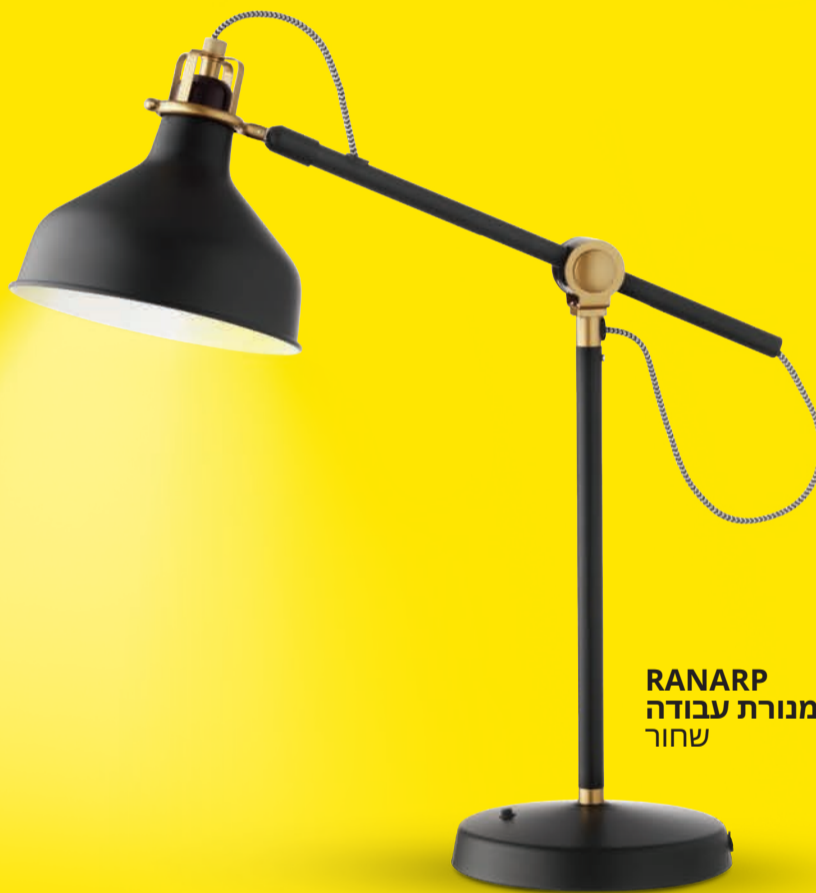
RANARP מנורת עבודה שחור

זמן איכות עם סבא וסבתא הוא זמן יקרה בואו נהנה איתם כמה שיותר.