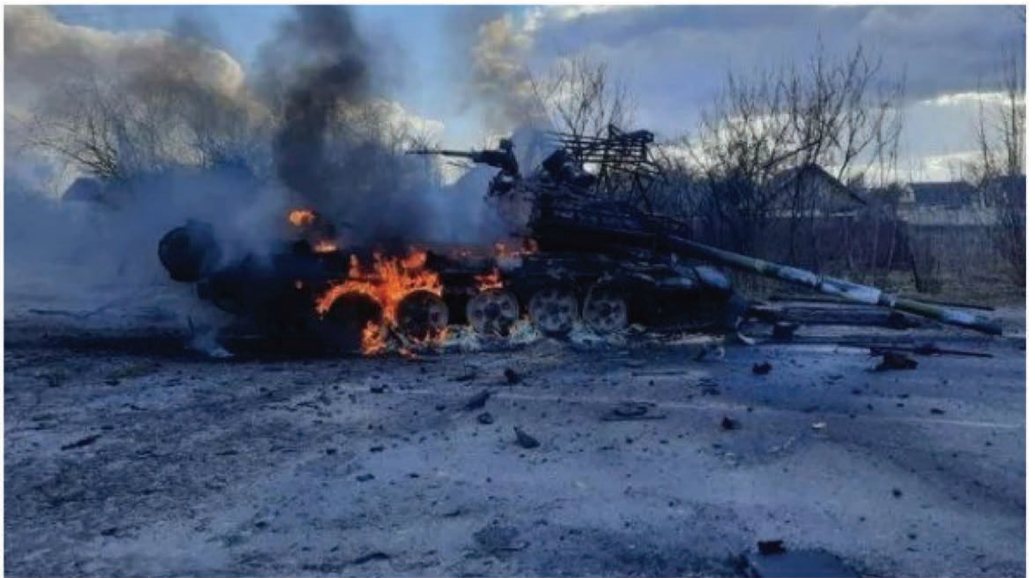
בלי מעורבות אמריקנית, המלחמה באוקראינה