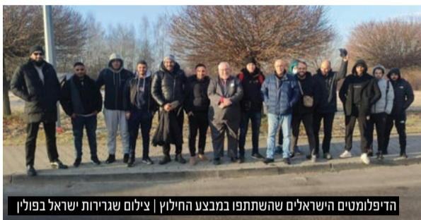
הדיפלומטים הישראלים שהשתתפו במבצע החילוץ

נכון ליום שלישי בערב, כוחות הצבא הרוסי עדיין מכתרים את עיר הבירה קייב, אך טרם ניתנה ההוראה לפרוץ אל תוך העיר. האוקראינים מבטיחים שבמידה ויחליטו הטנקים הרוסים לשעוט פנימה אל תוך קייב, צפויה התנגדות עזה. רבים מתושבי העיר הכינו מלאי עצום של בקבוקי מולוטוב על מנת להשליך על כוחות