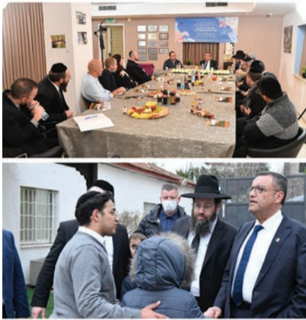
ראש העיר בביקור בבית סנהדריה