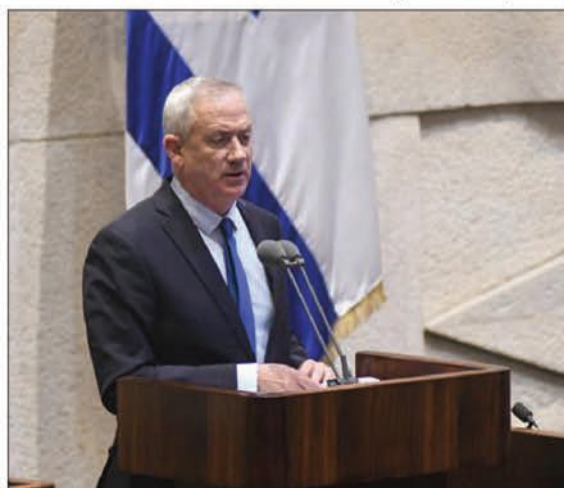
« רשם ניצחון. שר הביטחון בני גנץ

קשה לנחש לאן יתחרר קצין הק.ג.ב. לשעבר במערכה הנוכחית ומה הם יעדיו האמיתיים.