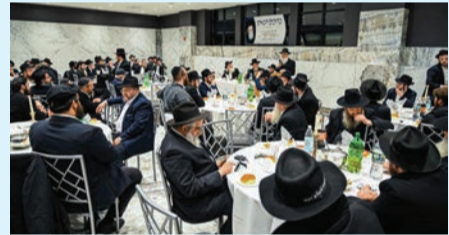
חלק מבני ההילולא