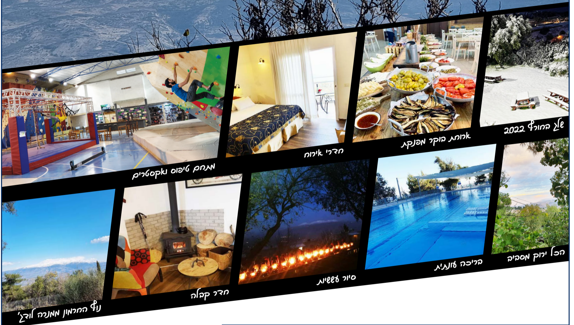
מתחם טיפוס ואקסטרים