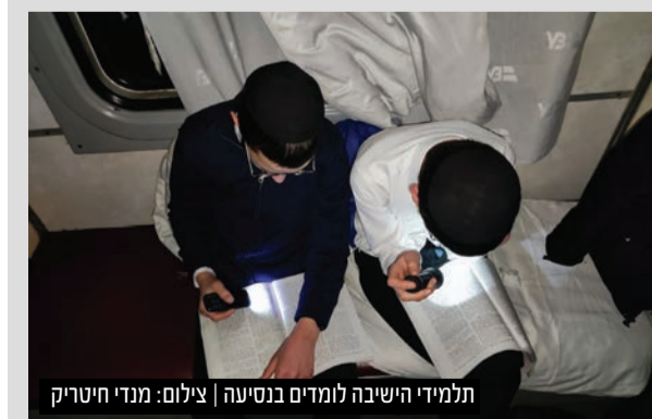
תלמידי הישיבה לומדים בנסיעה