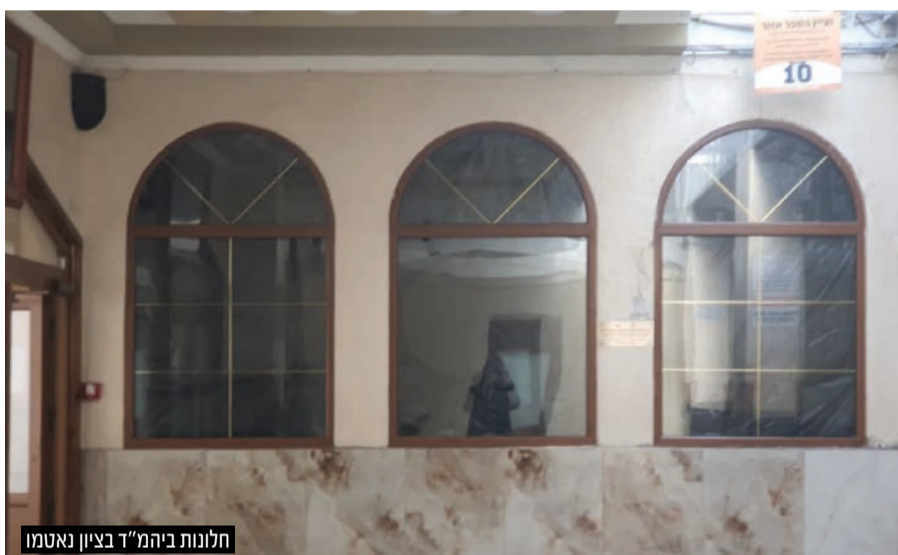
חלונות ביהמ"ד בציון נאטמו

והאבטחה באזור ציון רבי נחמן. בין הצוותים של המשמר הלאומי, צוותי החירום של עיריית אומן ונציגי איחוד ברסלב מתקיים תיאום מלא ואינטנסיבי, לשמירת הסדר הציבורי במהלך התקופה המורכבת. שוטרי יחידת המשמר הלאומי מקיימים סיורי הגנה ואבטחה ברחבי העיר 24 שעות ביממה, תוך שימת דגש על זמני חובת ההאפלה במשך כל שעות הלילה ברחבי האזור. במהלך הדיונים המשותפים עלה הצורך הדחוף להפעיל חדר בקרה משותף, שהחל לפעול מיידית לאורך כל שעות היממה, כדי למנוע וונדליזם ופעילות של גורמים עוינים ומפוקפקים. בשל הנחיות החירום המחייבות האפלה במשך כל שעות הלילה, כוסו כל החלונות בקברו של רבי נחמן בכיסויים אטומים. מנהיגי הפדרציה היהודית באוקראינה פנו בקריאה ליהודי המדינה להישמע להנחיות ולא לצאת מהבתים. רבנים של 160 הקהילות היהודיות באוקראינה הוציאו הנחיות מיוחדות למנהיגי הקהילות במדינה, ביקשו מהם לשמור על כלל ההנחיות, לדאוג לכל היהודים בעריהם והדגישו כי הם נשארים במדינה, לצידם. מי שיכול לעזוב את אוקראינה בצורה בטוחה, אמרו, מוטב שיעשה זאת דרך מעברי היבשה.