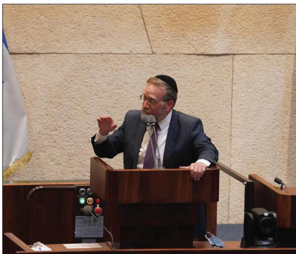
« מוביל המאבק על קדושת הכותל, ח"כ יצחק פינדרוס »

ישראל אולי תוכל לספק מעט גז לגרמניה בדרכים שונות, אבל לא בהיקפים משמעותיים, לבטח לא בשנתיים הקרובות. כמובן, אין לשכוח מי האיש שהוביל - כמעט בכוח - את המאבק לחילוץ הגז ממעמקי הים. רמז: מדובר באותו אדם שבנט מנסה כל כך להידמות אליו במסעותיו חובקי היבשות כמדינאי טירון