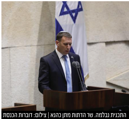
התכנית נבלמה. שר הדתות מתן כהנא

יו"ר רע"מ מנסור עבאס הבהיר לראש הממשלה ולראשי הקואליציה שאין בכוונת מפלגתו להתערב בחיי הדת היהודים ובקואליציה הבינו שאין רוב לרפורמת הגיור של השר כהנא • החוק נדחה למושב הקיץ אך ספק רב אם ימצא לו רב • בש"ס מיהרו לחגוג: "חוק הגיור שעמד להמיט חורבן גדול על שלמות העם - נהדף משולחן הכנסת וממושב החורף"