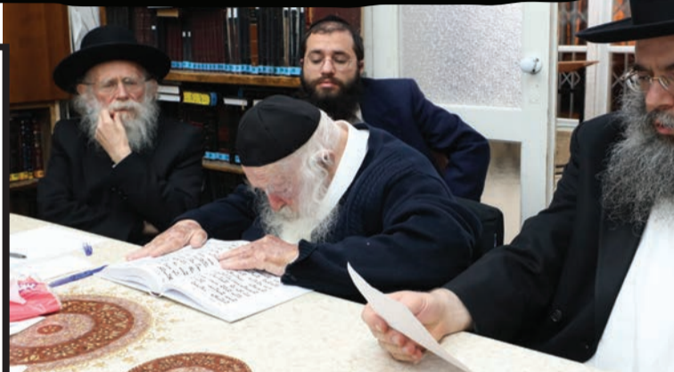
מרן הגר"ח קניבסקי שליט"א באמירת ס באסיפה למען יהודי אוקראינה