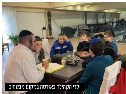
ילדי הקהילה באודסה במקום מבטחים