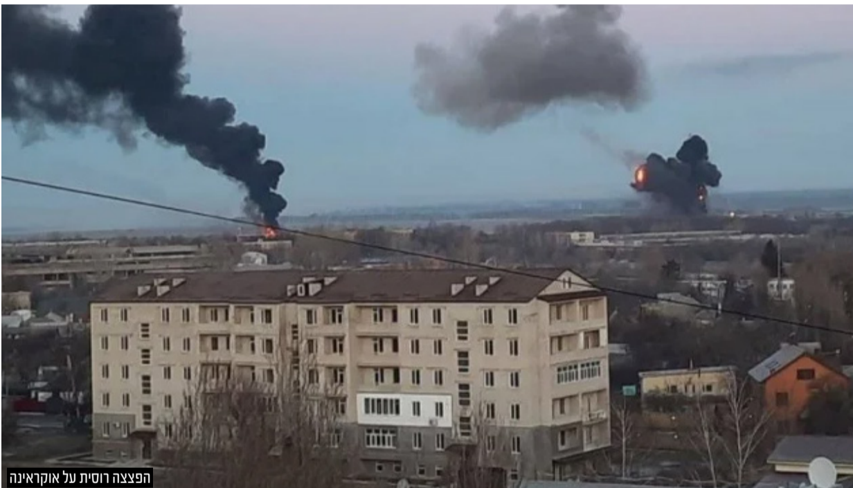
הפצצה רוסית על אוקראינה

בסיום הראיון, ביקש הרב וולך בקשה אחת בדמעות: "אמרו תהלים להצלת יהודי אוקראינה."