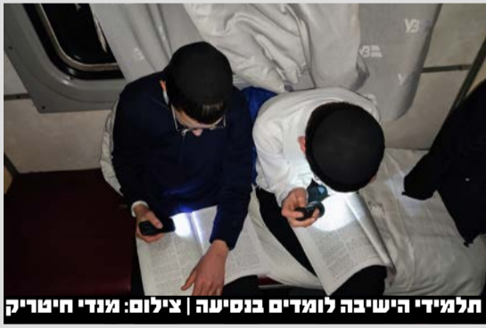
תלמידי הישיבה לומדים בניסיעה