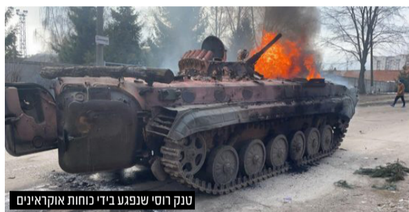
טנק רוסי שנפגע בידי כוחות אוקראינים

למלחמה. מראות החיילים השבויים עוררו זעם רב בקרב תושבי רוסיה ובלמעלה מחמישים ערים מרכזיות ברוסיה יצאו מאות אלפים להפגין נגד שלטונו של פוטיין.