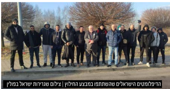
הדיפלומטים הישראלים שהשתתפו במבצע החילוץ

נכון ליום שלישי בערב, כוחות הצבא הרוסי עדיין מכתרים את עיר הבירה קייב, אך טרם ניתנה ההוראה לפרוץ אל תוך העיר. האוקראינים מבטיחים שבמידה ויחליטו הטנקים הרוסים לשעוט פנימה אל תוך קייב, צפויה התנגדות עזה. רבים מתושבי העיר הכינו מלאי עצום של בקבוקי מולוטוב על מנת להשליך על כוחות