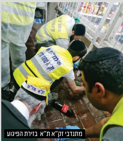
מתנדבי זק"א ת"א בזירת הפיגוע

ולוחמים: תפסיקו להעביר את תמונות הקורבנות זה פוגע בזכרם, ולתקשורת תפסיקו להראות את המחבל יורה, זה רק מחזק את הארורים האלה". חה"כ מירי רגב: "פיגוע רודף פיגוע, שבוע קשה עם אחד עשר נרצחים כתוצאה מפיגועי טרור מזעזעים ואכזריים במרכזי הערים. מציאות שמזכירה את ימי אוסלו הקשים. אני מבקשת להביע את תנחומיי למשפחות הנרצחים ומתפללת לרפואתם של הפצועים. חייבים להחזיר את הביטחון לאזרחי מדינת ישראל ולפעול ביד קשה כנגד הטרור".