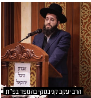
הרב יעקב קניבסקי בהספד בפ"ת

הנכד הגר"ג הוניגסברג וראש הכולל הגרמ"י שטרן עצרת חיזוק והתעוררות בהיכל ישיבת 'באר יהודה' הגדולה בראשות הגר"י טופיק שליט"א בהשתתפות הגר"ב רימר שליט"א ר"י קרית מלך והגר"א אפשטיין שליט"א מראשי ישיבת תורה בתפארתה. עצרת הספד התקיימה גם בהיכל ישיבת גורדנא בבאר יעקב. נשאו דברים ראשי הישיבה חברי מועצת גדולי התורה הגר"צ דרבקין והגר"י הקר ונשיא הישיבה הגר"א כהנמן.