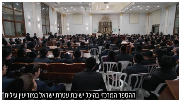
ההספד המרכזי בהיכל ישיבת עטרת ישראל במודיעין עילית