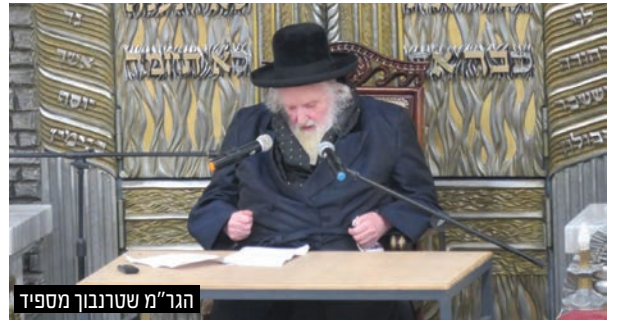
הגר"מ שטרנבוך מספיד

בעצרת נשאו דברי הספד מרטיטים הגר"ש גלאי שליט"א והגרצ"י לאו שליט"א - מרבני העיר, ובשיאו של הערב נשא דברים נרגשים נכדו של מרן שר התורה זצוק"ל ר' יעקב ישראל קניבסקי, שפתח צוהר לעולמו הנשגב של הגר"ח קניבסקי זצוק"ל בחיי חיותו, שהיה כמלאך הדר עם בני תמותה וחי חיי אצילות מרוממים.