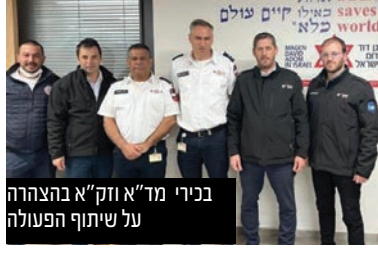
בניו"ד זק"א בהצלה על שיתוף הפעולה