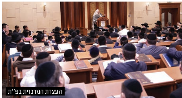
העצרת המרכזית בפ"ת