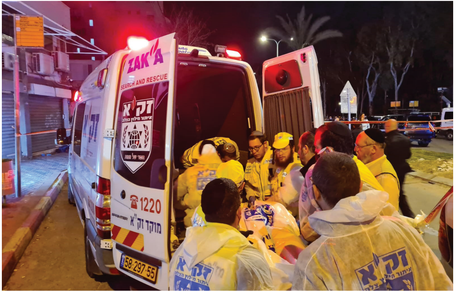
גל טרור רצחני, זירת הפיגוע בבאר שבע