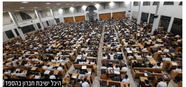
היכל ישיבת חברון בהספד

"אל הסיפור הזה התוודענו רק עכשיו במהלך ימי השבעה והוא מלמד על רובד נוסף באישיותו הגדולה. לפני עשרים ושתיים שנה הייתה גניבה בבית הרב. הרב היה באמצע לימוד והרבנית ביקשה לפתוח את הארון שבו היה שמור הכסף, כדי לתת הלוואה למישהו. פתחו וראו שהארון מרוקן לחלוטין ואין כסף."