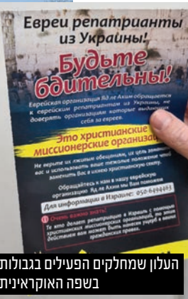
העלון שמחלקים הפעילים בגבולות בשפה האוקראינית