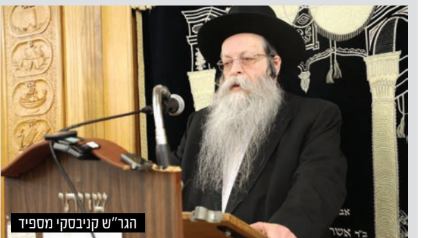
הגר"ש קניבסקי מספיד