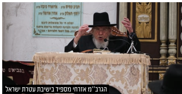
הגר"מ אורחי מספיד בישיבת עטרת ישראל