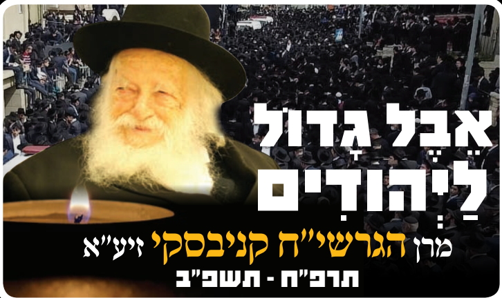
מֶרֶן הֶגֶרֶשִׁי"ח קֵינִיבֶסְקִי זִיטְע"א תִּרְפ"ח - תִּשְׁפ"ב

בעצרת נשאו דברי הספד מרטיטים הגר"ש גלאי שליט"א והגרצ"י לאו שליט"א - מרבני העיר, ובשיאו של הערב נשא דברים נרגשים נכדו של מרן שר התורה זצוק"ל ר' יעקב ישראל קניבסקי, שפתח צוהר לעולמו הנשגב של הגר"ח קניבסקי זצוק"ל בחיי חיותו, שהיה כמלאך הדר עם בני תמותה וחי חיי אצילות מרוממים.