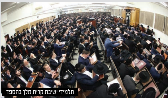
תלמידי ישיבת קרית מלך בהספד