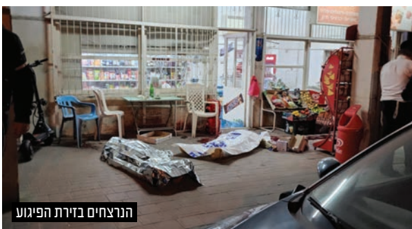
הנרצחים בזירת הפיגוע