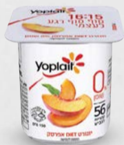
יופלה דיאט אפרסק 0% 150 גרם בד"צ ועדת מהדרין