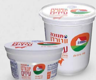
יוגורט תנובה מחלב עיזים מלא 750 גרם | 140 גרם בד"צ ועדת מהדרין