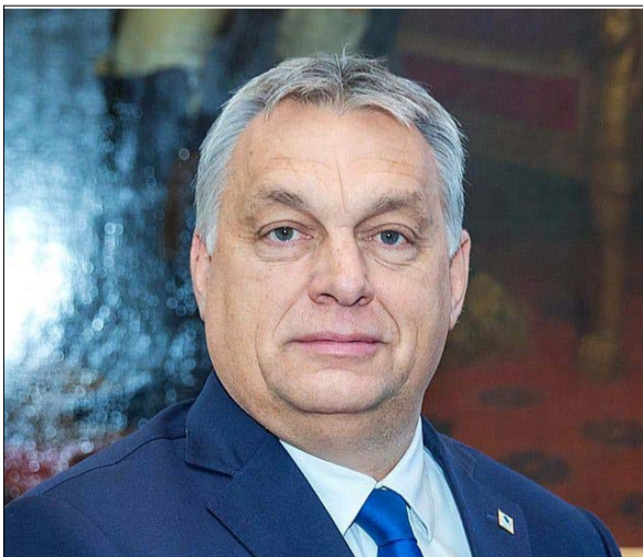
« ראש הממשלה הנצחי של הונגריה, ויקטור אורבן

"אתה אמור לפגוש את ראשי הרשויות ביהודה ושומרון ובאותו יום אתה הורס? איפה ההיגיון שלך כשר ביטחון? הוא לא סופר את ראש הממשלה ולא את ראש הממשלה החליפי, השאיפה שלו היא להיות ראש ממשלה. הוא הולך לפגוש את קמלה האריס. בשביל מה הוא צריך לפגוש אותה? מה היא מבינה בענייני ביטחון? איזה טנקים היא צריכה להניע? למצב את עצמו מול האמריקאים"