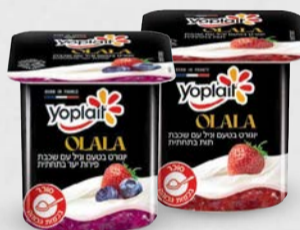
יופלה OLALA עם תות | פירות יער 150 גרם בד"צ ועדת מהדרין