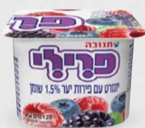
פירלי פירות יער 1.5% 125 גרם בד"צ ועדת מהדרין