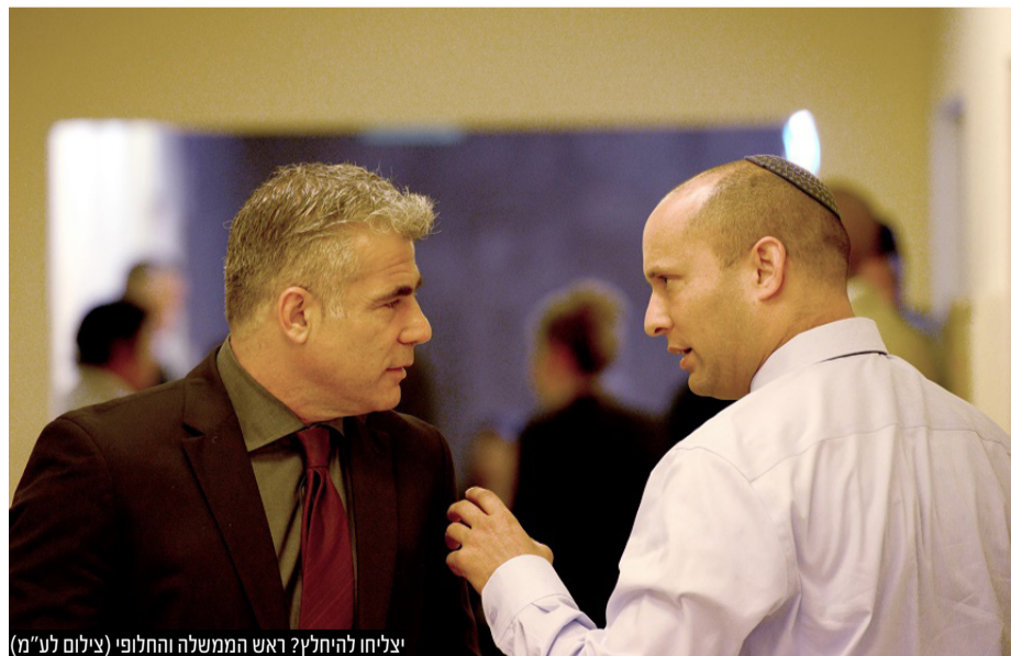
צילוח להחליף ראש הממשלה והחלופי

ראש האופוזיציה בנימין נתניהו אמר: 'התרגשתי לשמוע את הצהרתה של ח"כ עידית סילמן, ואני מברך אותה בשם המונים בעם ישראל, שייחלו לרגע הזה. עידית את הוכחת שמה שמנחה אותך זה הדאגה לזהות היהודית של מדינת ישראל והדאגה לארץ ישראל. אני מקבל אותך בחזרה הביתה למחנה הלאומי. הוכחת שנציגי ציבור אמיתיים פועלים לפי צו מצפונם, ואין זכות גדולה מזו. אני קורא לכל מי