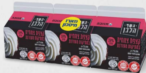
מארז קצפת צמחית במתיקות מעודנת 20% 3 יחידות x 250 מ"ל בד"צ ועדת מהדרין