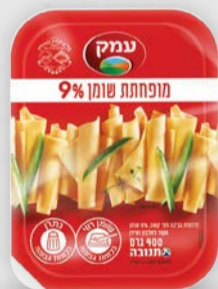
עמק מופחתת שומן 9% 400 גרם בד"צ ועדת מהדרין