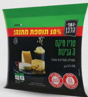
השף הלבן - טריו מיקס 3 גבינות 330 גרם בד"צ ועדת מהדרין