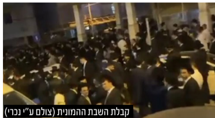
קבלת השבת המונית

מאות מתושבי השכונות הסמוכות הגיעו בערב שבת לקבלת שבת המונית בליווי שירי רגש והתעוררות לזכר הקדושים במקום בו התרחש הפיגוע