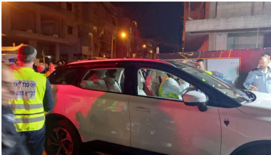
זירת הפיגוע