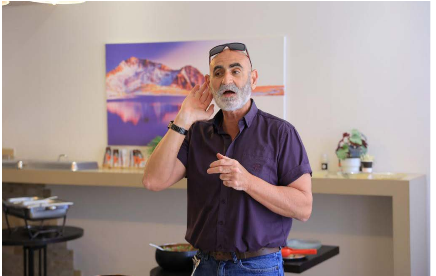
יו"ר מועצת יש"ע עולה למתקפה נגד שר הביטחון.

» בר לב מקבל את הריקושטים ומתפוצץ מזעם, באוזני מקורביו השמיע בשבוע האחרון את ספקותיו לגדל על ברכי דור המייסדים של מפא"י, דיבורים על פרישה אפשרית הם בראש ובראשונה קריאת 'תחזיקו אותי' לשותפיו, אבל מאחורי הזעקה מסתתר איום אמיתי, אם הכשל התדמיתי ימשיך להתרחב ובר לב יישאר לבדו במערכה, הוא עשוי לפרוש מתוסכל לביתו ולהותיר את יאיר לפיד משוטט בשער שכם להנאתו