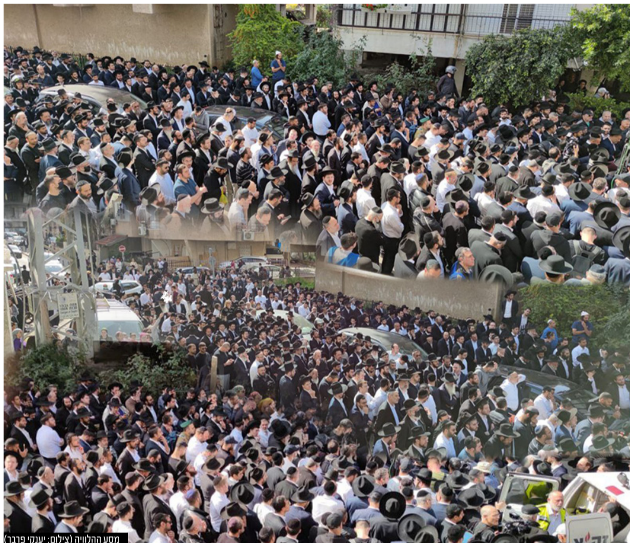
מסע הלוויה

במסע הלוויה שיצא מביתו ברחוב השניים הספידוהו אחיו הרב עובדיה יחזקאל, רבה של ב"ב הגאון רבי מסעוד בן שמעון שליט"א, ראש העיר ב"ב הרב אברהם רובינשטיין, יו"ר ש"ס אריה דרעי וגיסו של הקד' הרב שלמה