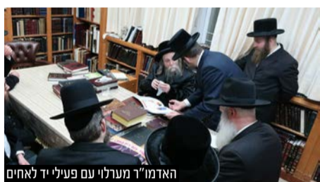
האדמו"ר מערלוי עם פעילי יד לאחים