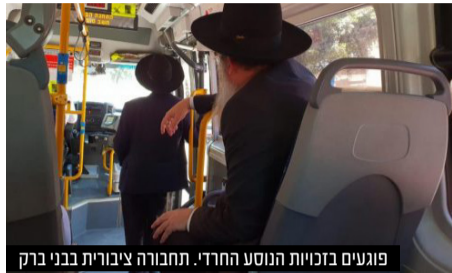
פוגעים בזכויות הנוסע החרדי. תחבורה ציבורית בבני ברק

שעות לאחר מסיבת העיתונאים של שרת התחבורה מרב מיכאלי שחשפה את הרפורמה במחירי התחבורה הציבורית שתיכנס לתוקף החל מהקיץ הקרוב, פירסמה לשכתו של חבר הכנסת אורי מקלב מסמך המפרט את הפגיעה הקשה של הרפורמה בתחבורה הציבורית בציבור החרדי. לדברי ח"כ מקלב, הרפורמה החדשה פוגעת בנוסעי התחבורה הציבורית בערים החרדיות שם תהא עלייה של מאות אחוזים במחירי הנסיעה. מהמסמך עולה כי בניגוד לנטען כי הרפורמה מוזילה את המחירים, נסיעה בודדת ממודיעין עילית לירושלים תתייקר מתשעה שקלים לשנים עשר שקלים חדשים, כך גם נסיעה בודדת בתוך העיר מודיעין עילית תתייקר באופן דרמטי משני שקלים לחמישה וחצי שקלים. כך יוצא כי אדם שנוסע רק פעמים בשבוע מירושלים למודיעין עילית וישלם עד כה 144 ש"ח ישלם קרוב למאתיים שקלים.