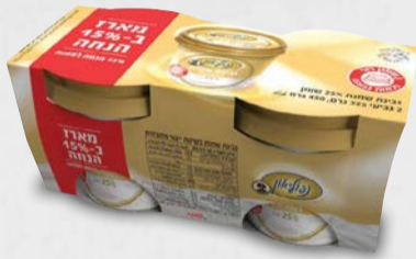
מארז גבינת נפוליאון 25% 2 יחידות x 225 גרם בד"צ ועדת מהדרין