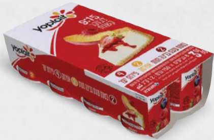
מארז יופלה פרי 3% 8 יחידות x 150 גרם בד"צ ועדת מהדרין