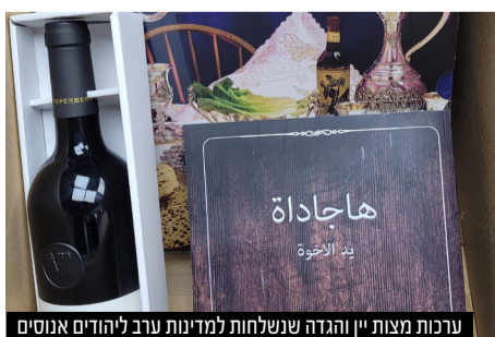
ערכות מצות יין והגדה שנשלחות למדינות ערב ליהודים אנוסים

של נער בר מצוה יהודי, נכד של שייח' בשכונת שועפט שחזר ליהדות ע"י פעילות הארגון, כשהוא מתברך אצל אביו, בעל מחשבת הלוי' זצוק"ל. הגאב"ד התרגש מאוד לראות את התמונה ואת הקשר שהיה גם לאביו זצ"ל עם ארגון הפעילים.