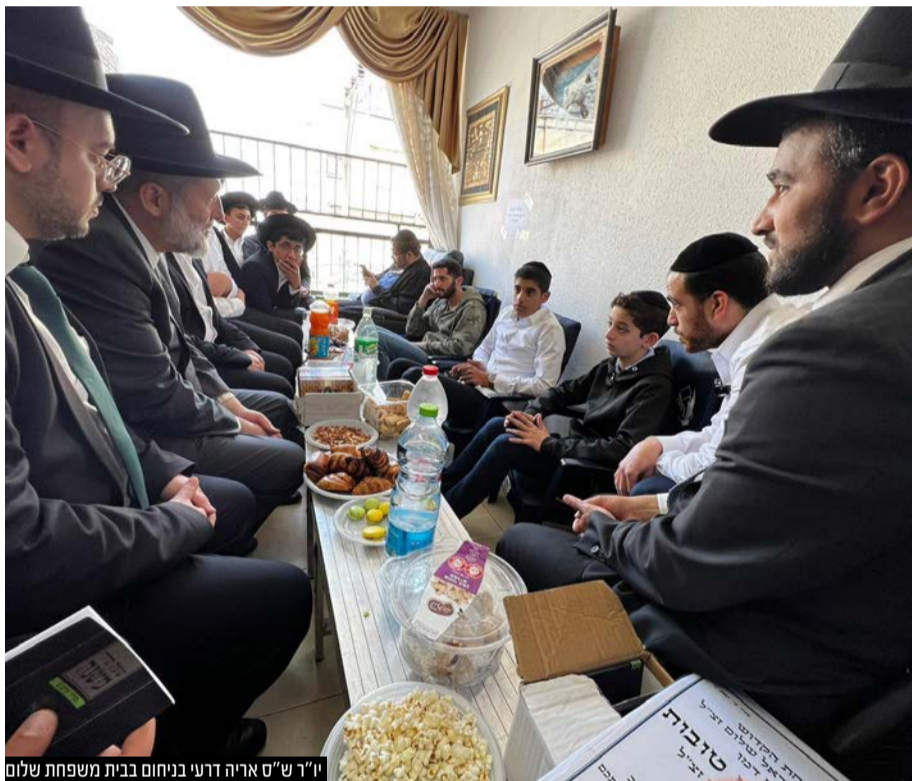
יו"ר ש"ס אריה דרעי בניחום בבית משפחת שלום