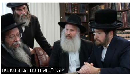
הגרי"ב ואזנר עם הגדה בערבית