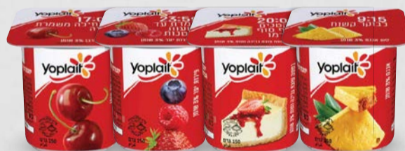
יופלה אננס | עוגת גבינה ותות | פירות יער | דובדבן 3% 150 גרם בד"צ ועדת מהדרין