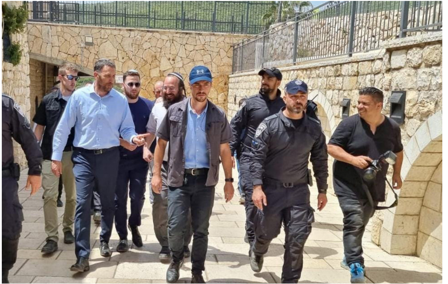
השר לשעבר ולעתידין בציין הרשב"י לקראת ההילולא