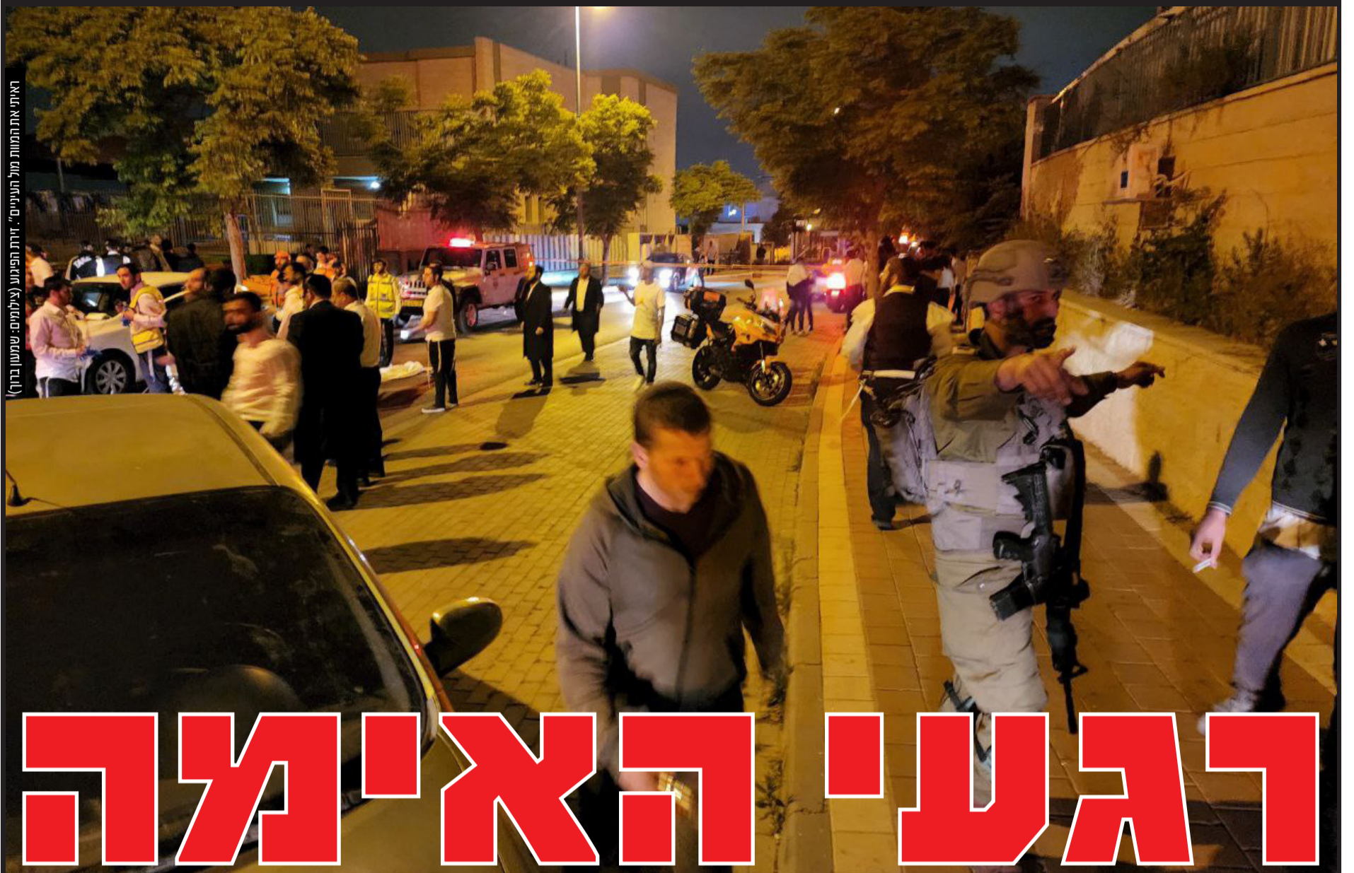
ראיתי את המוות מל העיניים. זירת הפיגוע