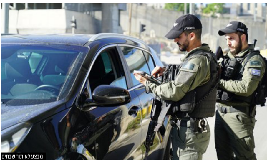
מבצע לאיתור שבחים

בכל הערים החרדיות קיימים כיום מאות אתרי בניה בהם פעילים שבהם מועסקים מאות פלסטינאים, חלקם עם אישורי עבודה וחלקם ללא אישור כניסה לישראל שהסתנו לישראל באמצעות מערכת ענפה של מבריחי שב"חים • במשטרה טוענים: האחריות היא על הדרג המדיני והצבאי לסתום את הפרצות בגדר ועל מערכת המשפט שתחמיר את הענישה • בערים החרדיות - בני ברק, אלעד, בית שמש, ביתר עילית, מודיעין עילית וקריית יערים מסבירים: כך נמנע העסקת שב"חים בתחומי העיר המסכנת את חייהם של תושבי הערים החרדיות