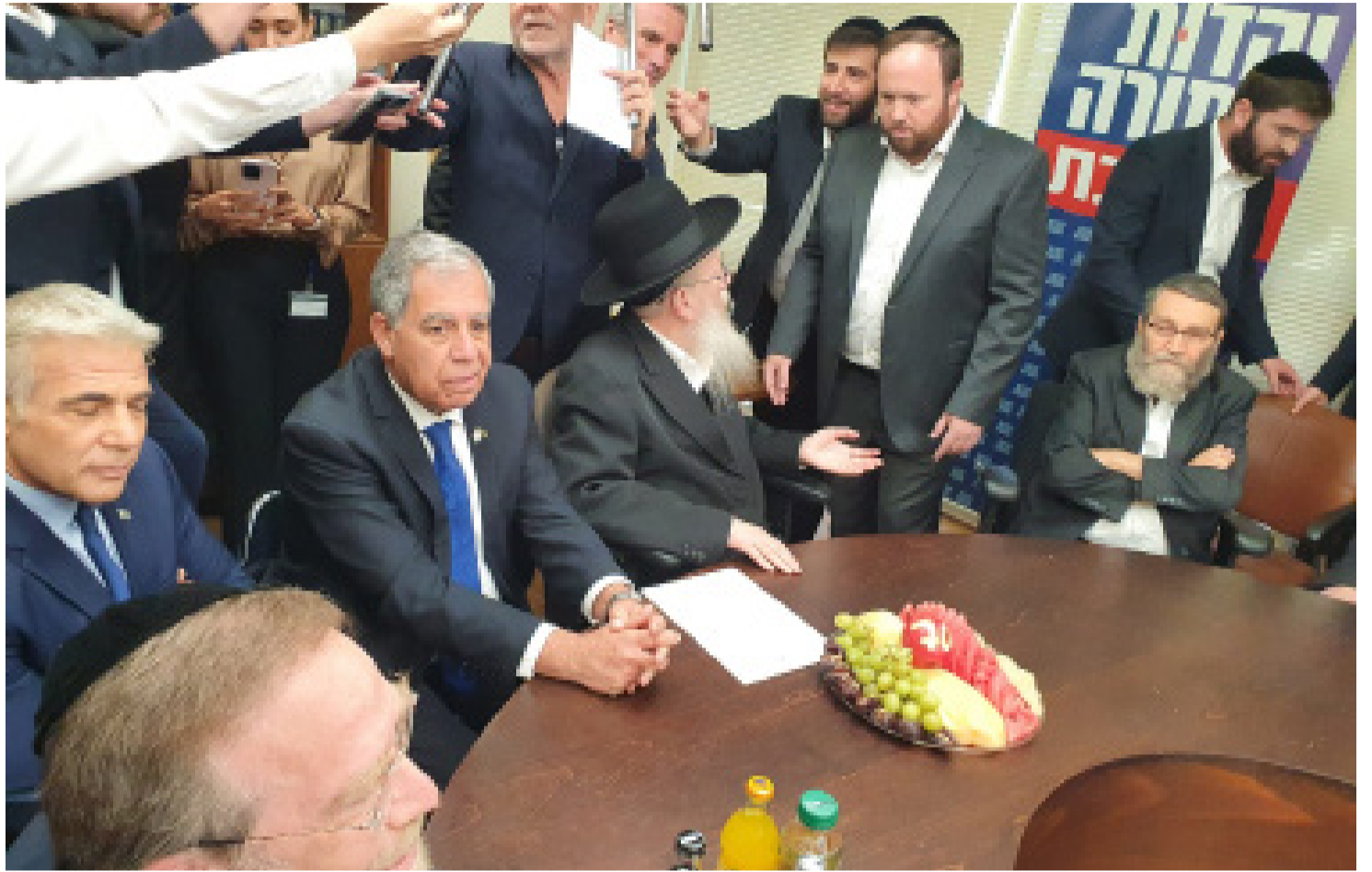
ספין על גב יום ההולדת. לפיד משבח את גפני.

במיוחד, כמו ניסיון החדירה ליישוב תקוע או פיגוע הדקירה בשער שכם בירושלים.