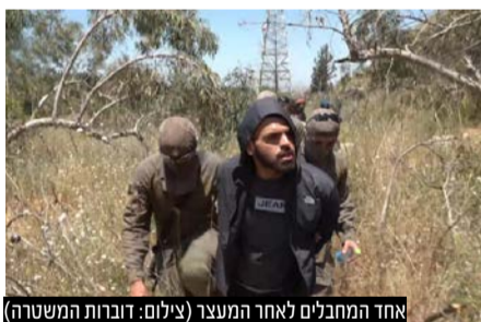
אחד המחבלים לאחר המעצר

60 שעות רצופות של חיפושים נרחבים ביער הסמוך לאלעד בהשתתפות שוטרי משטרת ישראל, חיילי צה"ל, לוחמי מגלן, אנשי יחידת מרעול ואנשי שמורות הטבע והגנים הביאו סוף סוף ללכידתם של שני המחבלים שביצעו את הפיגוע המחריד בליל שישי באלעד. סגן י' מיחידת מגלן, שנטל חלק בלכידת שני המחבלים, סיפר: "זיהינו גוש עשבים בתוך הסבך, שזו בקצב נשימה. הבנו שהמחבלים שם. הפתענו אותם, שלפנו אותם והם לא התנגדו"