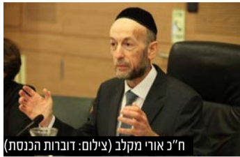
ח"כ אורי מקלב

הצעת החוק שיזם ח"כ אורי מקלב מעצימה את כוחם של בתי הדין הרבניים ומאפשרת להם כלים עדכניים במאבקם מול סרבני הגט