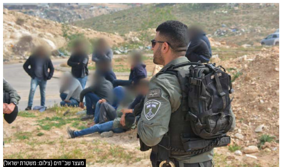
מעצר שב"חים

"מערך האבטחה מבוקר על ידינו הן בסיוורים והן בשערים. מאבטחים שלא ממלאים את הנחיות הקב"ט מוצאים את עצמם מחוץ למערכת, מתוך הבנה שמאבטח שלא ממלא הנחיות ולא מבצע את עבודתו הוא סכנה לביטחון העיר והתושבים.