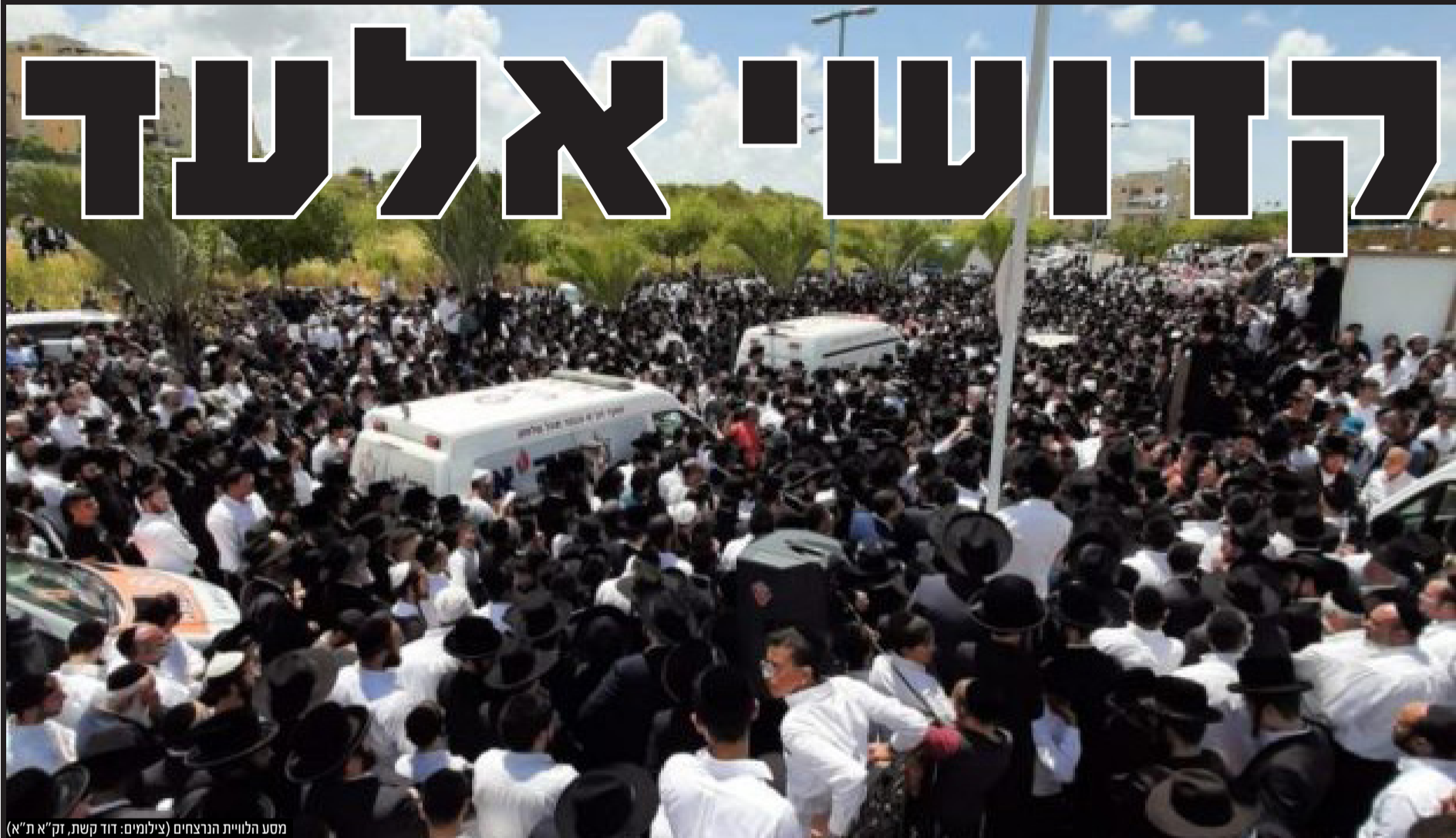
מסע הלוויית הנרצחים