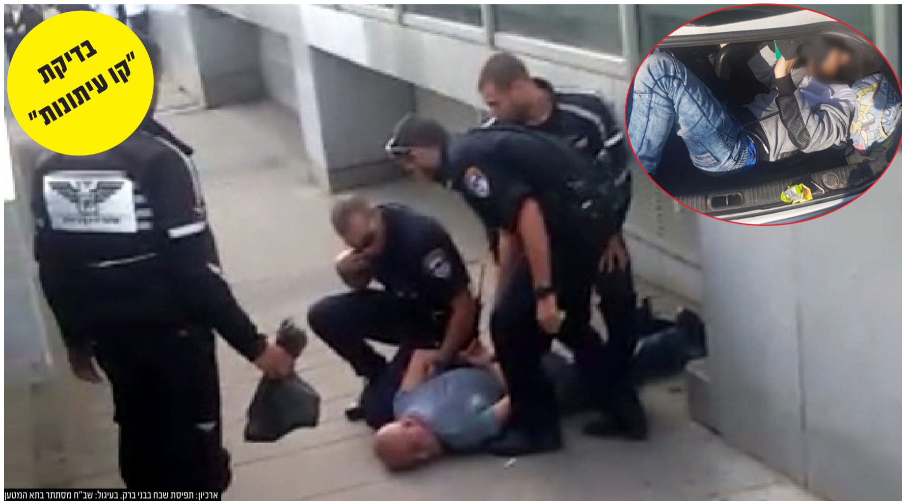
ארכיון: תפיסת שבח בני ברק. בעיגול: שב"ח מסתתר בתא המטבח

מבצעים שוטפים ויזומים בשיתוף עם משטרת ישראל לאיתור שב"חים ביישוב וסביבתו. המוטו של המועצה הוא אפס סובלנות בנושא."