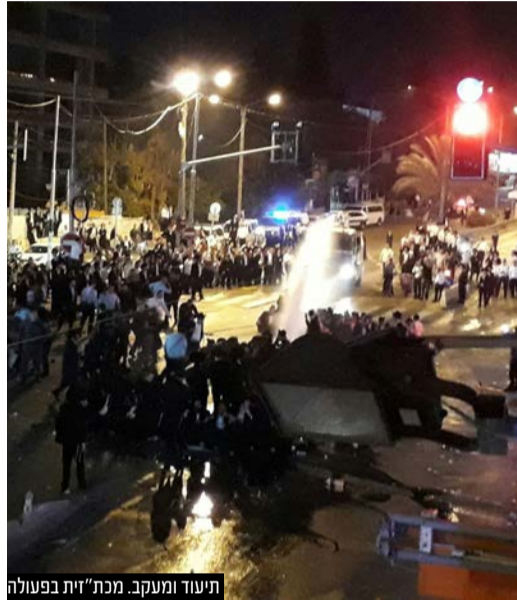
תייעוד ומעקב. מכת"זית בפעולה

ועדת השרים לענייני חקיקה אישרה השבוע את הצעת החוק של חברי הכנסת אורי מקלב מחייבת את משטרת ישראל לתעד את פעילות המכוניות להתזת מים (מכתזיות), זאת לאחר מקרים רבים בהם עוברי אורח תמימים נפגעו כתוצאה מהפעלת המכתזיות שלא על פי הנהלים.