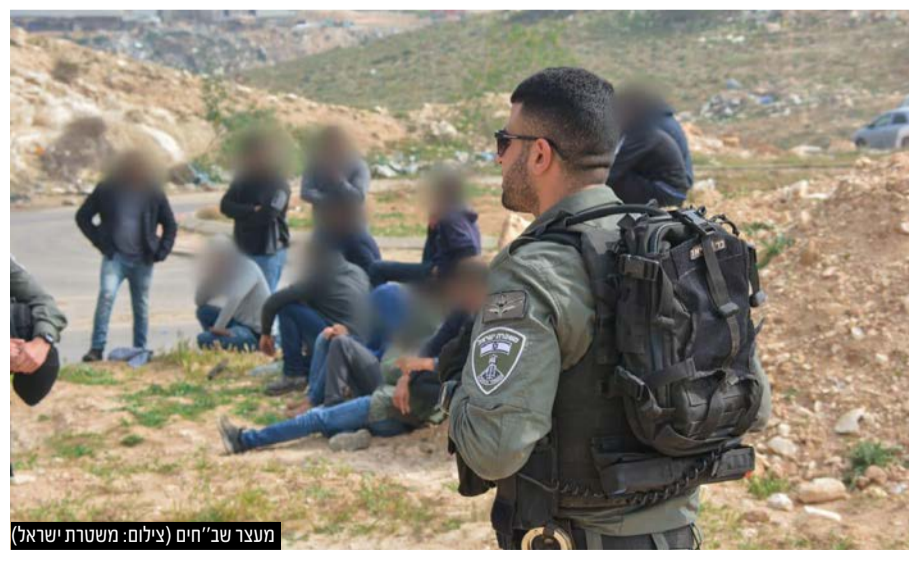
מעצר שב"חים

(המספר חסוי מסיבות מובנות) ומערך מצלמות מתקדם שאי אפשר להרחיב עליהם מאותן הסיבות. "מערך האבטחה מבוקר על ידינו הן בסיוורים והן בשערים. מאבטחים שלא ממלאים את הנחיות הקב"ט מוצאים את עצמם מחוץ למערכת, מתוך הבנה שמאבטח שלא ממלא הנחיות ולא מבצע את עבודתו הוא סכנה לביטחון העיר והתושבים.