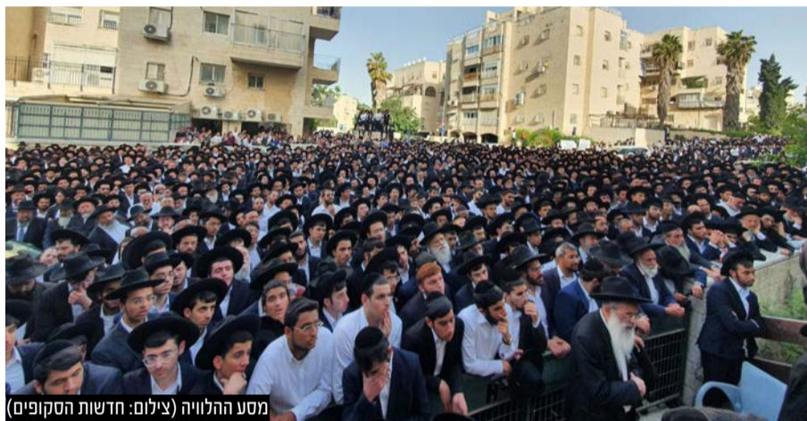
מסע ההלוויה