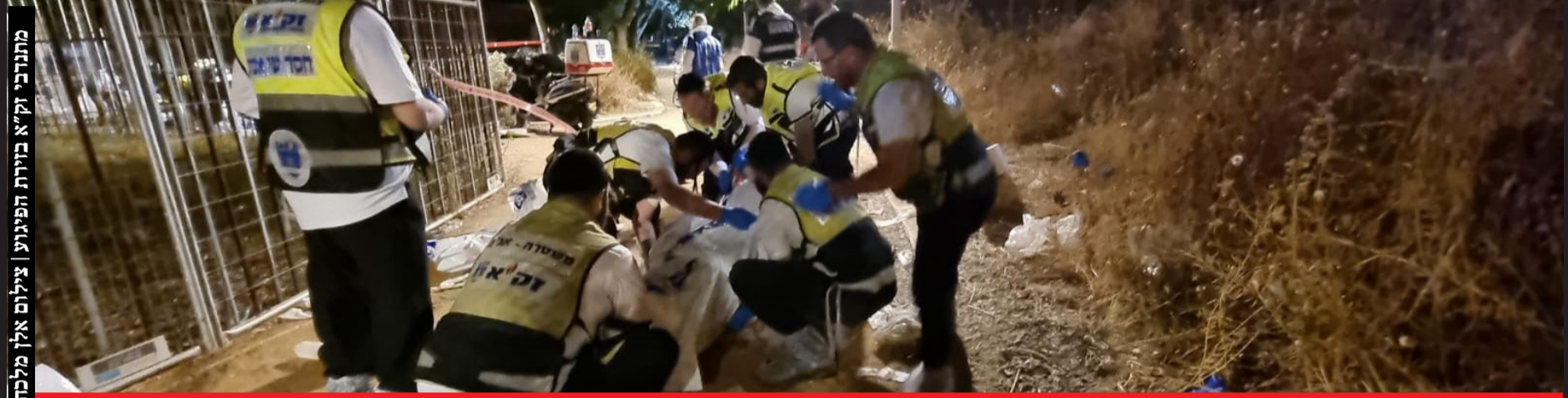
מתנבכי זק"א בוירת הפיגוע

רגעי האימה: עדי הראיה משחזרים את רגעי החרדה המצמיחים ועל המוות שראו בעיניים | עמ' 8 קדושי אלעד: אלפים הגיעו להיפרד מהקדושים יונתן חבקוק, בועז גול ואהרן בן יפתח הי"ד | עמ' 10 המצוד: 66 שעות של חיפוש אינטנסיביים הסתיימו בלכידת המחבלים ביער סמוך לאלעד | עמ' 12