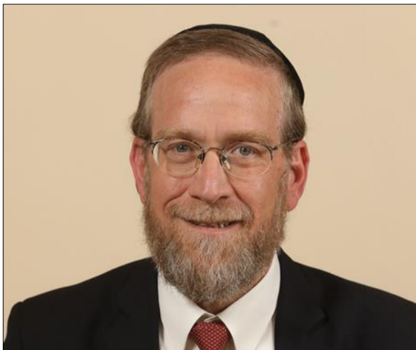
פיצוץ מטאפורי. ח"כ 'צחק פינדרוס

אם בסיעות החרדיות היה מי ששקל הצטרפות לממשלה, היה זה בשלב הקמתה - בו יכלו החרדים לקבל את 'תעריף עבאס' ולצאת עם מיליארדי שקלים והשפעה שתמנע חקיקה אנטי דתית, לא בשלב בו הממשלה גוססת ותלויה על כרעי תרנגולת. עוד חשוב לציין, כי יהדות התורה לא תוכל לשבת עם ישראל ביתנו בראשות איווט-מריצות-ליברמן וגם לא עם העבודה ונציגה הרבא"י הרפורמי גלעד קריב. עם כל הכבוד לשבעת חברי יהדות התורה, הם לא יוכלו לספק לקואליציה שמונה עשר אצבעות כתחליף