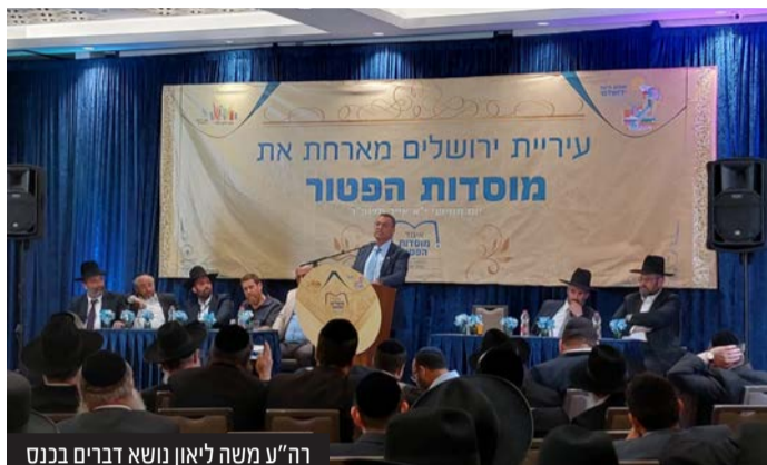
רה"ע משה ליאון נושא דברים בכנס

במהלך כנס מוסדות הפטור מכל רחבי הארץ שהתקיים בבית וגן, הפתיע ראש העיר משה ליאון את הנוכחים והציג בשורות דרמטיות לרווחת המוסדות וילדי הת"ת. בין היתר: ציוד כיתות לילדי הת"ת ולימודי שחיה חנים בכפוף להנחיית הרבנים. הרבנים ומאות המשתתפים הודו לראש העיר ושיבחו אותו על המאמצים והמסירות למען ילדי ירושלים