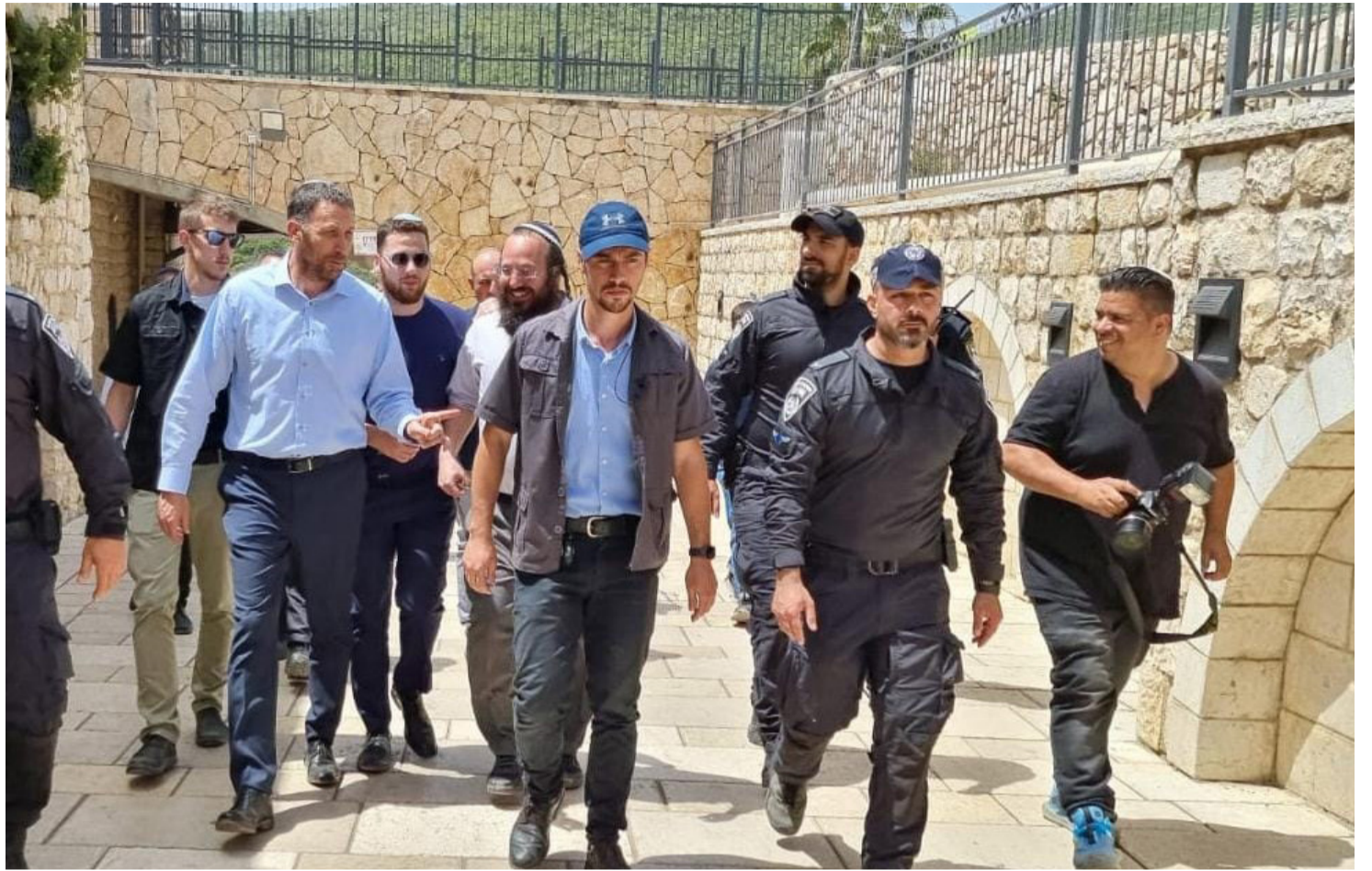
השר לשעבר ולעתיד מסייר בציון הרשב"י לקראת ההילולא

» הפטרון בכזה מקרה הוא ללכת עם ולתת כלום. כלומר, להעיד את מה שנדרש על פי הסיכום עם הפרקליטות, אבל לאפשר להגנה לעשות את שלה ולפורר לחלוטין כל משמעות או אמינות לעדותו. כך, הוא הסביר שחלק מהעדות נשענות על מה שאמרו לו החוקרים ונראה לו הגיוני, וננזף על ידי השופטים שדרשו ממנו לספר עובדות בלבד ולא זיכרונות מדומים. כך הוא התעקש על גרסתו המקורית, המופיעה גם בכתב האישום, ולפיה 'פגישת ההנחיה' המדוברת הייתה בעצם בתזמון בלתי אפשרי