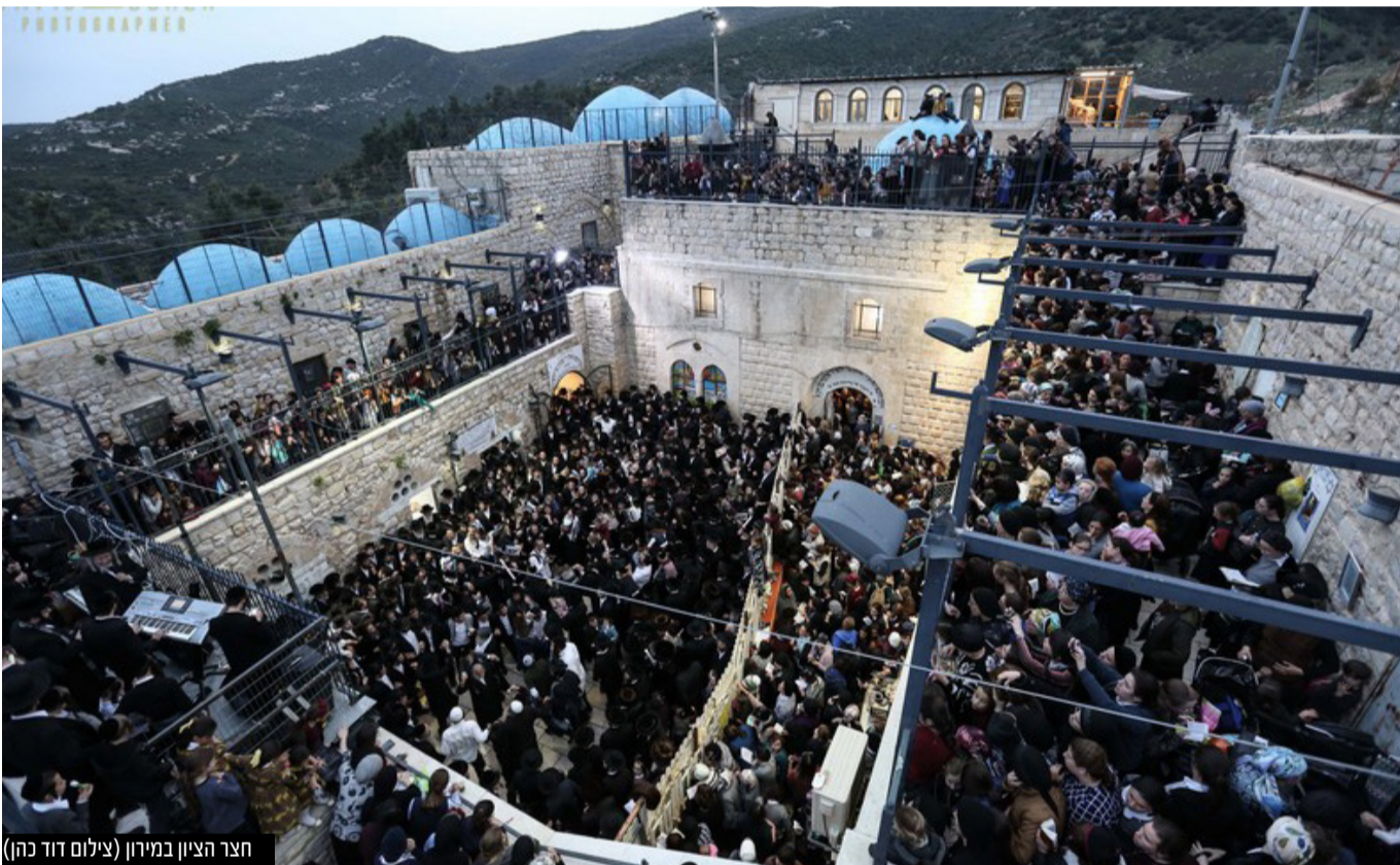
חצר הציון במירון

בעקבות האסון הכבד בהר מירון בשנה שעברה ולאחר שהממשלה אימצה את מסקנות הביניים של ועדת החקירה הממלכתית שהוקמה בעקבות האסון הכבד, יוגבל מס' המשתתפים בהר ל-16,000 בני אדם, הנסיעה למירון תתקיים רק על ידי מכירת כרטיסי נסיעה, ניתן לשהות עד 4 שעות במתחם ההר ולא תתאפשר הגעה רגלית או מעבר של רכבים פרטיים. כ-8,000 שוטרים ולוחמי מג"ב יעבדו מסביב לשעון על מנת לאבטח את מתחם הישוב מירון באמצעות מסוק, אמצעי תצפית, רחפנים, טרקטורונים, רכבי שטח, אופנועים ופרשים. כל הפרטים על הערכות לקראת אירועי מירון תשפ"ב