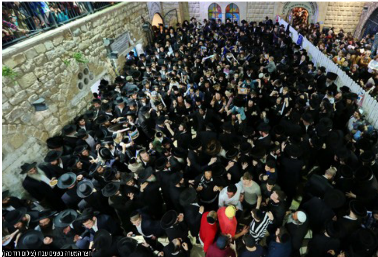
חצר המערה בשנים עברו

"על אף ההשגות, על אף חוסר הנוחות שבדבר, ננהג באחריות כפי שהתורה מצווה אותנו: 'ונשמרתם מאוד לנפשותיכם'."