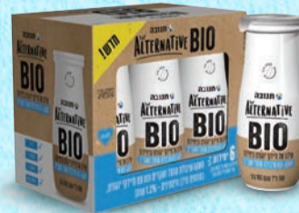
מאגדת משקאות סיו אישיים על בסיס שיבולת שועל ושקדים 100 מ"ל X 6 יחידות בד"צ העדה החרדית