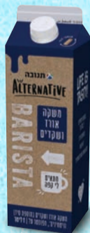
משקה בריסטה אורז ושקדים 1 ליטר בד"צ העדה החרדית