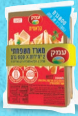
מאגדת זוג עמק 600 גרם X 2 יחידות בד"צ העדה החרדית