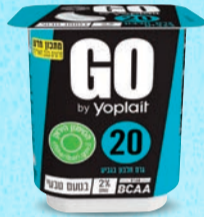
יוגורט GO בטעם טבעי בד"צ ועדת מהדרין