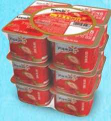
מאגדת יופלה תות 100 גרם X 12 יחידות בד"צ העדה החרדית