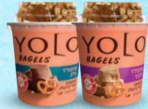
יולו עם שברי בייגלה שוקולד בלונד | שוקולד חלב בד"צ ועדת מהדרין