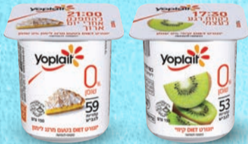
דיאט יופלה קיווי | מרנג לימון בד"צ ועדת מהדרין