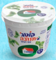
קוטג' תנובה 5% עם זעטר בד"צ ועדת מהדרין