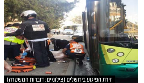
זירת הפיגוע בירושלים