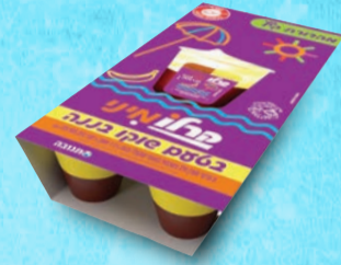
מאגדת קרלו שוקולד בננה 100 גרם X 8 יחידות בד"צ ועדת מהדרין