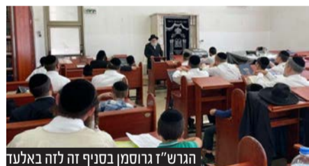
הגרש"ז גרוסמן בסניף זה לזה באלעד

מעמד מרגש התקיים בבית המדרש 'היכל זהר' בעיר אלעד, שם מתקיימים בדרך קבע פעילות אגף החונכים ליתומים תושבי העיר. היתומים לומדים עם החונכים של ארגון 'זה לזה' המלווים אותם בכל ימות השנה במסגרת פרויקט 'בני מלכים'. ביום שישי הגיע במיוחד רבה של אלעד הגאון רבי שלמה זלמן גרוסמן שליט"א לחזק את הפעילות ולראות מקרוב כיצד ארגון זה לזה תומך ועושה את הילדים היתומים. הגרש"ז גרוסמן שיתף שהרגיש שהוא חייב להגיע כדי להיות חלק מהפרוייקט המרגש הזה, כיוון שגם הוא התייתם ל"ע בהיותו בגיל 6 בלבד ולצערנו בתקופה ההיא לא היה את ארגון 'זה לזה' והוא יחד עם 11 אחיו ואחיותיו נאלצו להתמודד לבד עם היתמות ללא שום סיוע. הלוואי ואז היה לנו את ארגון 'זה לזה' שיעזור ויתמוך. בהמשך דבריו פנה הגרש"ז גרוסמן לילדים ואמר: "תדעו לכם שההורים שלכם נמצאים כאן