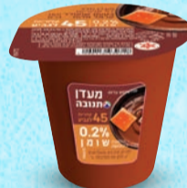
מעדן תנובה דיאט שוקולד קרמל מלוח בד"צ ועדת מהדרין