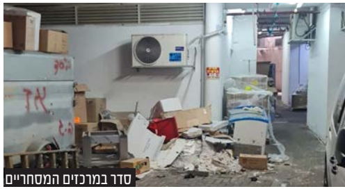
מאת: אלי כהן

במהלך השבוע התקיים מבצע מיוחד של השיטור העירוני יחד עם שוטרי נקודת אלעד במרכזים המסחריים בעיר, במטרה לסייע לתושבים בהשלטת סדר במעברים הציבוריים. השוטרים פעלו מול הצבת דוכנים וסחורות במעברים, באופן שמקשה על הלוקחות להסתובב באופן חופשי במרכזים המסחריים. בחלק מהמקרים ניתנו דו"חות וקנסות לבעלי העסקים, ובחלק מהמקרים אף הותרמו סחורות. כמו כן בוצעה אכיפה נגד תופעת השלכת פסולת במרחבים הציבוריים, בצורה שמסכנת את העוברים ושבים.