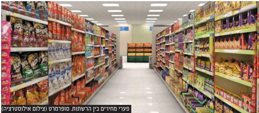
פערי מחירים בין הרשתות. סופרמרט (צילום אילוסטרציה)

אנשי mako יצאו לבדוק את רשתות השווק במגזר החרדי יחד עם המועצה לחקר הקמעונאות • ברשתות מסוימות תמצאו מוצרים ספציפיים זולים יותר - אבל על סל הקניה החודשי תשלמו מחיר יקר יותר מרשתות השיווק לציבור הכללי