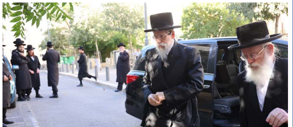
האדמו"רים מגיעים לכינוס המועצת