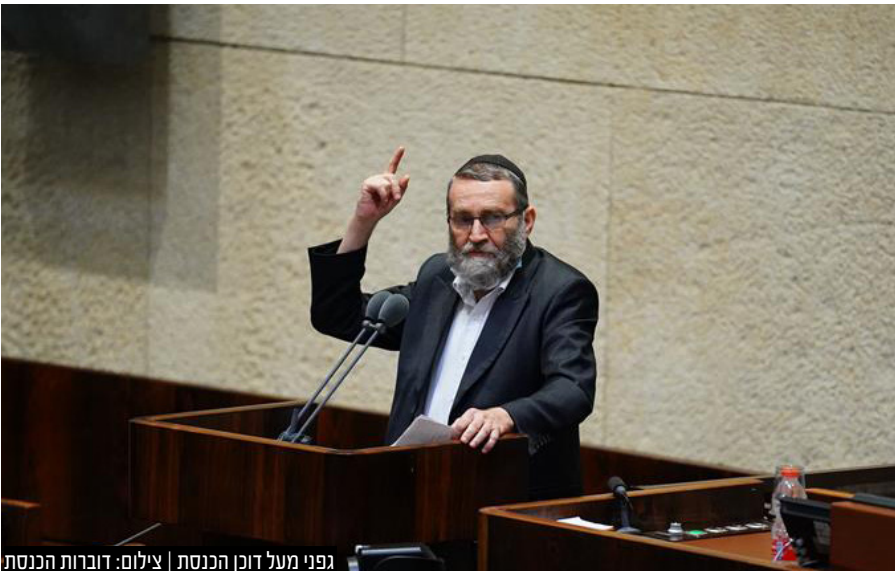
גפני מעל דוכן הכנסת

בשיחה עם "קו עיתונות", אומר בכיר במפלגות החרדיות: "בלוק הימין כבר לא קיים. נתניהו פירק אותו כשהחליט להשאיר את ימינה באופוזיציה כשהוקמה הממשלה הפריטטית עם גנץ. לא נלך עם נתניהו לכל הרפתקה פוליטית. הדאגה לעולם הישיבות ולצרכים של הציבור החרדי גוברת על כל שיקול פוליטי כזה או אחר". לדברי אחד הח"כים החרדים: "יש מספיק שותפים פוטנציאליים ואפשרויות להרכיב ממשלה. בעדיפות ראשונה עם הליכוד, אבל יש גם עדיפות שניה"