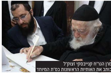
מרן הגר"ח קניבסקי זצוק"ל מותב את האותיות הראשונות בס"ת המיוחד

זה כבר הפך למסורת שרבים מצפים לה: בפעם ה-12 ברציפות יערוך יד לאחים הגולה על ספר תורה מהודר ומפואר בין כלל השותפים למצוות פדיון שבויים שעורך הארגון, וכמדי שנה מציפים המוני פניות של יהודים מכל רחבי הארץ את מוקד ההרשמה להגולה.