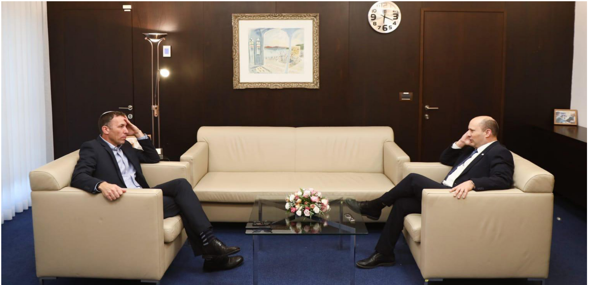
ייקח פסק זמן מהחיים הפוליטיים, או יישאר על הגלגל. בנט וכהנא השבוע בלשכת רה"מ

אחד לא יכולה לדבר על משהו שמאחד. היו ימים ש"בלי חרות ומק"י" הייתה סיסמת השמאל. בשנים האחרונות זה התחלף ב"רק ממשלה שמבוססת על מחנה הימין בלבד, אינם גבוהים, סיכויי של הימין יצא מחוזק מהמתקפות נגדו.