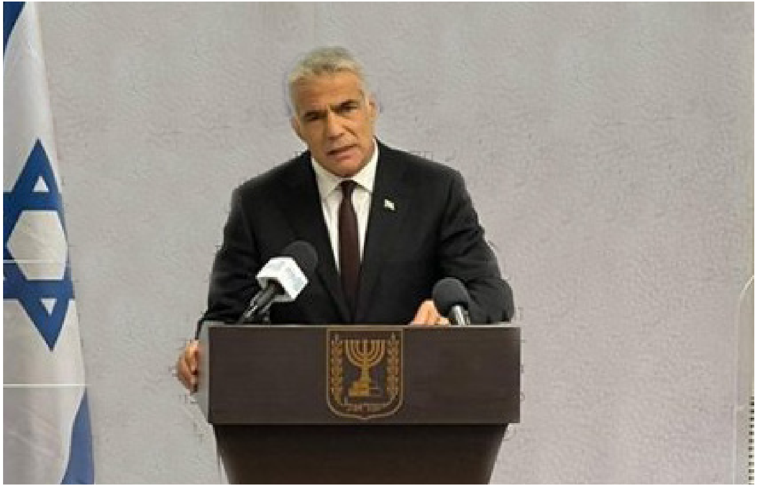
ראש הממשלה הארבעה עשר יאיר לפיד