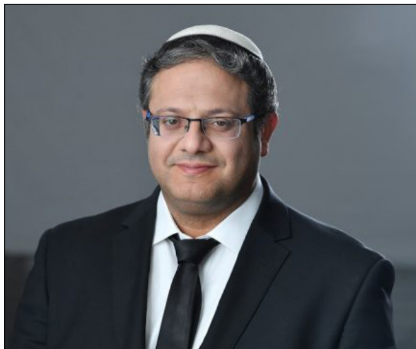
« נוכח הקמפיין, ח"כ איתמר בן גביר

לפיד חשש גם מתרגיל נוסף שהתגלגל בחוגי כחול לבן והמפלגות החרדיות בשבוע האחרון, ובמסגרתו תעביר האופוזיציה הצעת אי אמן קונסטרוקטיבית במקביל לפיזור הכנסת ותעמיד בראשות הממשלה לתקופת המעבר את יו"ר כחול לבן בני גנץ, הן כפיצוי עבורו על הקדנציה המוחמצת בכנסת הקודמת, הן כתשלום מקדים על האפשרות של שותפות עתידית אחרי הבחירות, ואם על הדרך אפשר גם לגנוז (סופית, כנראה) את חלומו של לפיד להפוך לראש ממשלה, מה טוב