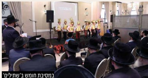
במסיבת חומש ב'שתילים'

על אף שנצטווה רק לדבר לסלע, כדי להראות לעם ישראל שהקב"ה ביכולתו להצמיח גם מעץ התלוש וללא לחלוחית, כך גם ביכולתו להוציא מים מהסלע. "חובתנו להאמין ביכולת להפריח בכל אחד ואחד את התורה הקדושה גם שנראה שיש קושי ואין לחלוחית, לא פעם אנו מגלים שהילד פורח לאחר השקעה עוד יותר ממה שחשבנו שביכולתו וזה דבר שמחייב אותנו להאמין בילד, להמשיך ולהשקיע יותר ויותר, עד לפריחה שתבוא בע"ה.