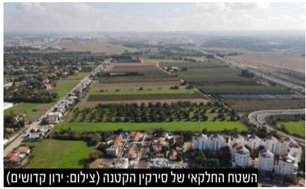
השטח החלקאי של סירקין הקטנה

שרת הפנים ומנכ"ל משרדה קיבלו את בקשת ראש העיר פ"ת רמי גרינברג והחליטו לא לספח את מתחם "סירקין הקטנה" לעיר אלעד ולכן גם לא יבנו בו ה-4000 יחידות דיור שתכננו להבנות במתחם