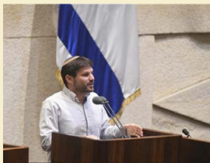
נאב ראש. בצלאל סמוטריץ'

המפלגה. היא שיגרה טפסי הצהרה לכלאף מתפקדי המפלגה וביקשה נאמנות מחודשת. 500 מתוכם השיבו בחיוב. היא הקימה מחדש את מוסדות המפלגה כולל את בית הדין של התנועה בראשות שופט בדימוס. היא מתכוונת להריץ את המפלגה בבחירות הקרובות, עבור הציבור שבעבר תמך בבנט ושקד וכיום אין לו בית פוליטי.