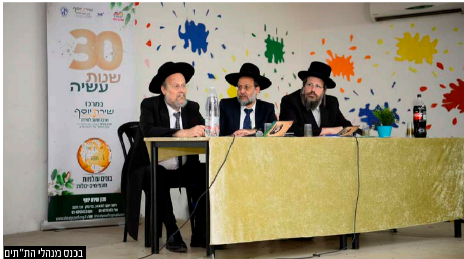
בכנס מנהלי הת"תים