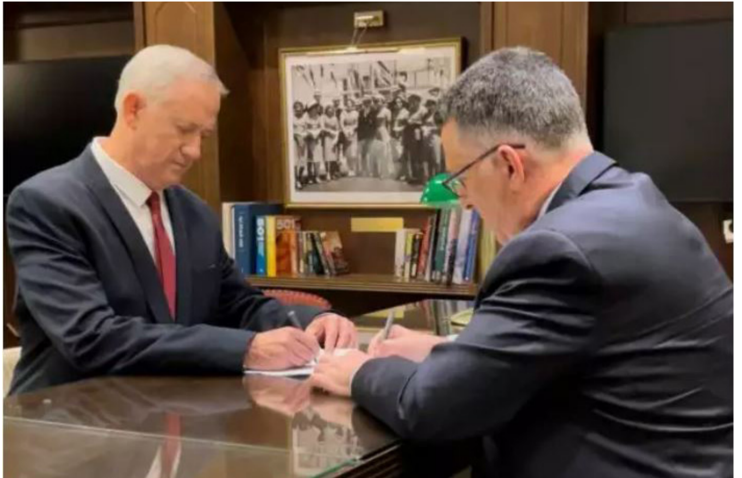
שועל וטירון מתאחדים, גנץ וסער בחתימת ההסכם

ובונים על האחריות הגושית שתמנע מדגל התורה לנקוט בצעדים ממשניים בבחירות הקרובות. אם לא תחול תזווה בעמדות הצדדים, סביר להניח שהמתחיות תתגבר עד לשעת השין, מועד סגירת הרשימות בעוד למעלה מחודשיים.