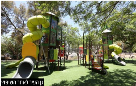
גן העיר לאחר השיפוץ

נמשכת תנופת עשייה והתפתחות לרווחת ילדי העיר ותושבי השכונות: בקצב מקצועי של שדרוג הגינות העירוניות לקראת ימי הקיץ וחודשי החופשה, השלימה עיריית בני ברק את שדרוגו של 'גן עקיבא גור' המוכר בשמו כ'גן העיר' הצמוד לבניין העירייה ברחוב ירושלים אל מעלה 'הר השלום'.