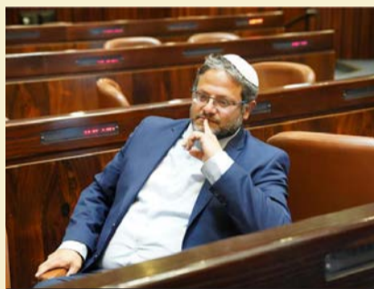
דורש 5 מקומות. בן גביר