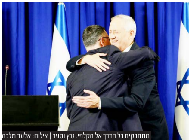
מתחבקים כל הדרך אל הקלפי. גנץ וסער

במידה וגוש נתניהו לא יצליח את מחסום ה-61 המנדטים - מבין כל המועמדים האחרים, לבני גנץ סיכוי לא מבוטל להיות ראש הממשלה ה-15 של מדינת ישראל.